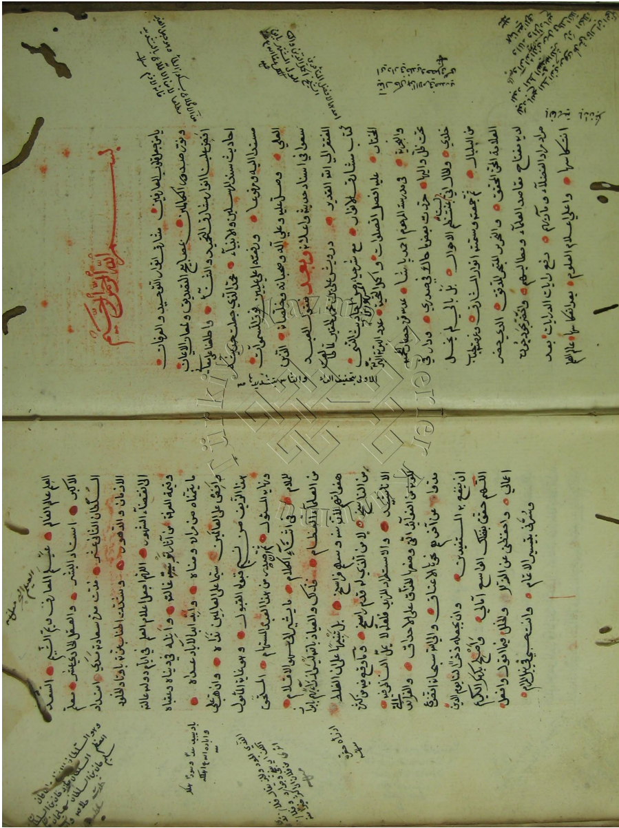
Şekil 1: Carullah 276 1b-2a