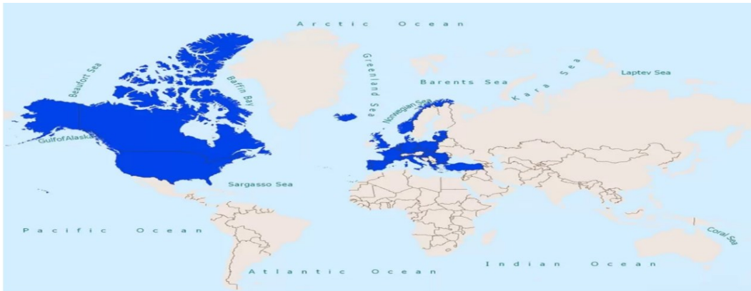
Şekil 1. NATO’nun Dünya Haritasındaki Görünümü

Şekil 1 ve Şekil 2’ye bakıldığında dünyanın önemli stratejik bölgelerini kapsayan bu iki örgüt, direkt etkisi altında olmayan diğer ülkeler üzerinde de etki kapasitelerini artırabilmek için büyük bir mücadele vermektedirler. Bu iki örgütün en önemli iki ülkesi olarak ön plana çıkan ABD ve Çin, bu iki örgüt üzerinden önemli bir güç mücadelesi yürütmektedirler.