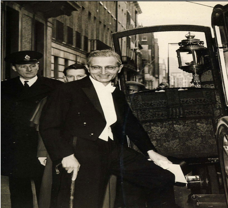
Foto 2: Kuneralp İkinci Kez Londra Büyükelçisi İken (10 Ekim 1969)