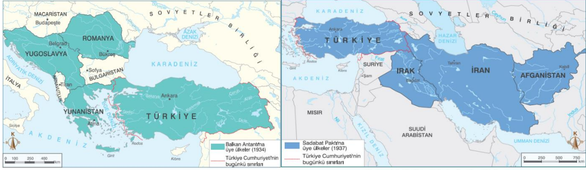
Harita 6.1: Balkan Antantı'na katılan ülkeler

Ayrıca Sosyal bilgilerin SB.6.3.1. (Konum ile ilgili kavramları kullanarak kıtaların, okyanusların ve ülkemizin coğrafi konumunu tanımlar.) kodlu kazanımını temsil eden örnekler de ders kitabında şu şekildedir: