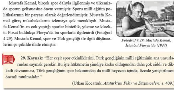
Görsel 20. Atatürk'ün sporla ilgili görüşü (s.139)

Yine sadece bu öğrenme alanında temsil edilen bir diğer disiplin olan Beden Eğitimi ve Spor kitapta BE.5.2.3.2. BE.6.2.3.2. BE.7.2.3.2. BE.8.2.3.2. (Atatürk'ün sporla ilgili söylediği sözleri açıklar.) kodlu kazanımlarla şu şekilde temsil edilmektedir: