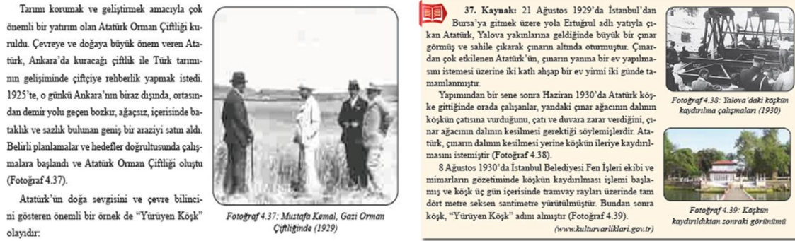
Görsel 21. Çevreyi koruma ve güzelleştirmeye yönelik metinler (s.148)

Son olarak yine yalnız bu öğrenme alanında yer alan Fen Bilimleri dersine ait F.5.6.2.1. F.5.6.2.4. (İnsan ve çevre arasındaki etkileşimin önemini ifade eder.) kodlu kazanımlarla ders kitabında şöyle temsil edilmektedir: