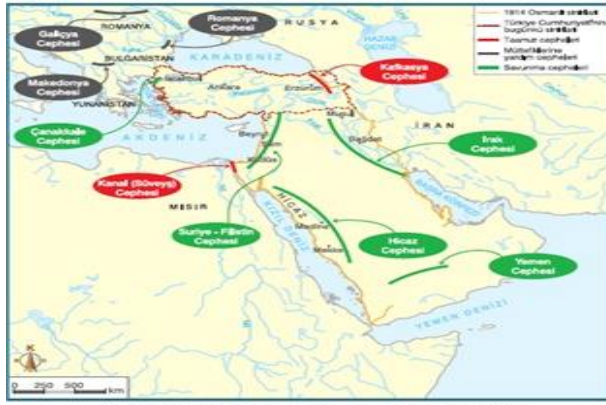
Harita 2.2: Osmanlı Devleti'nin Birinci Dünya Savaşı'nda savaştığı cephesi