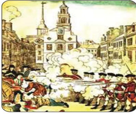
İllüstrasyon 1.1: Fransız İhtilali

Öğrenme alanında Görsel sanatların G.6.2.5. (Görsel sanatlar, tarih ve kültürün birbirlerini nasıl etkilediğini açıklar.) kodlu kazanımını temsil eden örnek aşağıdaki gibi yer almaktadır: