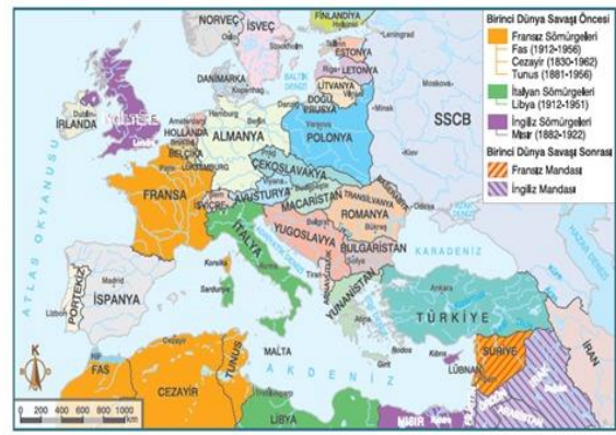
Harita 2.4: Birinci Dünya Savaşı'ndan sonra (1923 - 1924) Avrupa