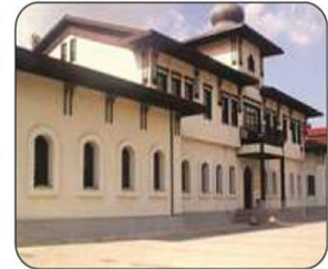
Fotoğraf 2.16: Amasya Genelgesi'nin hazırlandığı Saraydüzü Kişlasi

İzmir'in işgali sırasında Türk halkında oluşan tepkiyi gören Mustafa Kemal, 12 Haziran 1919'da Amasya'ya geçti. Artık ulusal mücadeleyi kişisel bir girişim olmaktan çıkarıp tüm ulusa mal etmek gerekiyordu. Bu amaçla burada halkı Milli Mücadele'ye çağırarak bir metin üzerinde çalıştı. Bu metinde ülkenin içinde bulunduğu durum ve bu durum karşısında yapılması gerekenler açıklanmaya çalışılıyordu. Mustafa Kemal'in yaveri Cevat Abbas (Gürer) Bey'in kaleme aldığı metin, 22 Haziran'da Amasya Genelgesi (Tamimi) olarak tüm ilgililere duyuruldu (Fotoğraf 2.16). Genelgenin başlıca noktaları şöyleydi: