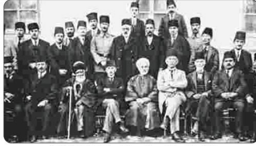
Fotoğraf 2.18: Mustafa Kemal, Erzurum Kongresi delegeleriyle (1919) Erzurum Kongresi, toplanma amacı ve temsil yetisi açısından bölgesel bir kongredir. Ancak aldığı kararlar açısından ulusal bir nitelik taşır. Kongrede Mustafa Kemal'in başkanlığı olduğu dokuz kişilik bir Temsil Kurulu seçilmiş, Temsil Kurulunun geçici bir hükümet gibi çalışmasına

Bu öğrenme alanında en fazla yer alan Türkçe T.5.3.21., T.6.3.15., T.7.3.14., T.8.3.12. (Görsellerden ve başlıktan hareketle okuyacağı metnin konusunu tahmin eder.) kodlu kazanımlara şu şekilde yer verilmektedir: