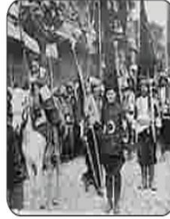
Fotoğraf 3.2: Maraş’ın düşman işgalinden kurtuluşu kutlamaları (1920)

Sütçü İmam olayı ile başlayan gerilim, “bayrak olayı” ile tımandı. Fransızların Maraş Kalesi’ndeki Türk bayrağını indirip Fransız bayrağını çekmeleri protestoları artırdı. Ezan okunduktan sonra Ulu Cami’de toplanan halk hep bir ağızdan “Bayraksız namaz kılınmaz!” diye bağırды. O sırada cami imamı Rıdvan Hoca’nın “Özgürlüğü olmayan bir milletin cuma namazı kılması doğru olamaz!” sözleri ile Maraş halkı yürüyüşe geçti ve kaleye tekrar Türk bayrağı asıldı.