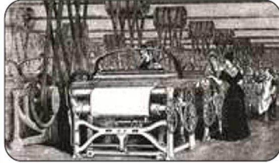
İllüstrasyon 1.2: Sanayi Devrimi'ni tasvir eden bir resim