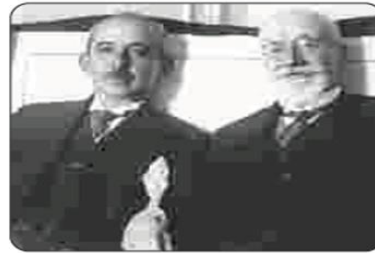
Fotoğraf 6.2: Yunanistan Başbakanı Venizelos ve Türkiye Başbakanı İsmet İnönü (1931)

Atatürk, Türk milletinin on yıldan fazla süren savaşlar nedeniyle yaptığı fedakârlıkları, yaşadığı kayıpları ve dayanma gücünü dikkate alarak adını atmıştır. Türk milletinin gelişerek uygar dünyada hak ettiği yeri alması için uzun bir barış dönemine ihtiyaç olduğunu saptamıştır. Millî sınırlarımız içinde Türkiye’nin güvenliğini sağlayıp başka devletlerin topraklarına göz dikmeden, “Yurtta barış, dünyada barış” ilkesi çerçevesinde yaşamak, dış politikanın bir başka ilkesi olmuştur. Bu ilke doğrultusunda uluslararası hukuka bağlı kalarak sorunları karşılıklılık (mütakabilyet) esasına dayalı diplomasi yoluyla çözmeyi amaçlamıştır. (Fotoğraf 6.2)