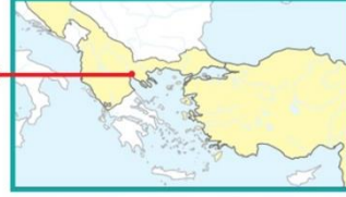
Harita 1.3: Selânik'in yerini gösteren harita