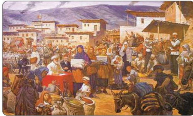
İllüstrasyon 3.3: Kurtuluş Savaşı’nda Tekâlif-i Milliye Emirleri’nin uygulanmasını gösteren tablo. (Türk, Azeri ve Rus sanatçıların ortaklaşa çalışması ile oluşturulmuştur. Ankara Atatürk ve Kurtuluş Savaşı Müzesi-Anıtkabir sergilenmektedir.)

Tekâlif-i Milliye Emirlerinin uygulamasını sağlamak için İstiklâl Mahkemeleri kuruldu. Emirlerde belirtilen şartları yerine getirmeyen sorumlular ile bu emirlerin dışında uygulamada bulunan görevliler sert bir biçimde cezalandırıldı.