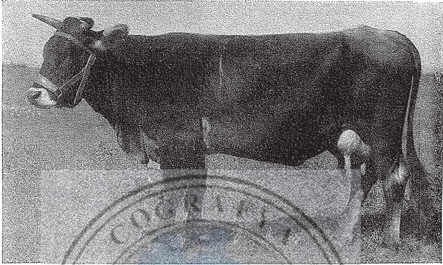
3 — Yerli sığırları ıslah için getirilen montafon'ların döllerinden bir yarımkan inek