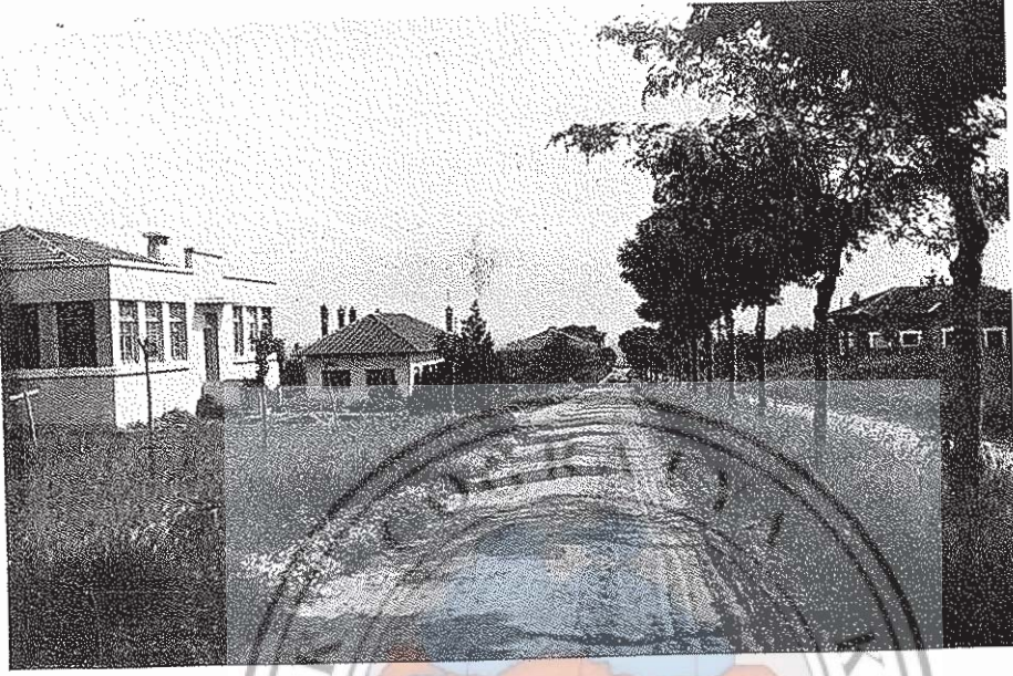
1 — Karacabey harasından bir görünüş