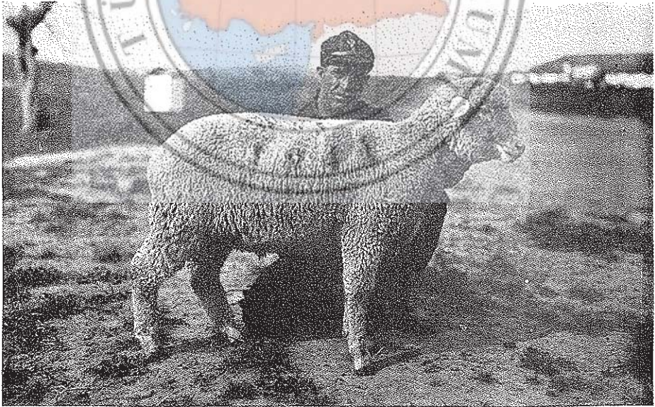
4 — Bir yarımkan merinos koçu