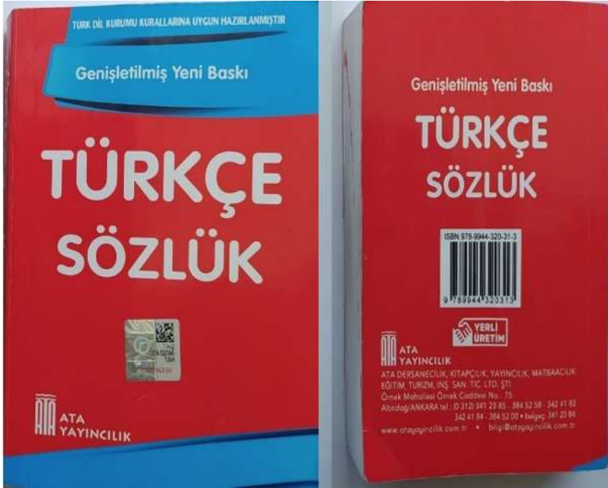
Şekil 2. İncelenen Sözlüğün Dış Kapak Görselleri

Dolayısıyla sağlamlık ve kullanılabilirlik açısından hedef kitle yaş grubuna uygun olduğu görülmektedir.