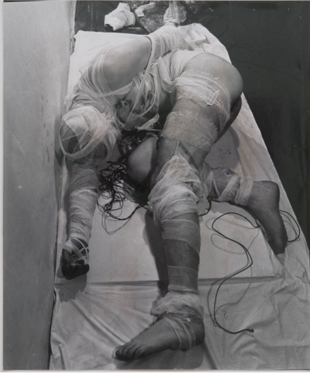
Görsel 1. Rudolf Schwarzkogler - 3. Aktion (3. Aksiyon), 1965, performans (Schwarzkogler, 1965).

dinde var olan "Her bitiş yeni bir başlangıçtır." inancı düşünülebilir. Semavi dinlerde ölümden sonra başka bir yaşamın devamı ya da Asya temelli bazı dinlerde reenkarnasyon ile ruhun yeryüzünde başka bir formda yeniden canlanması, Nitsch'in çalışmalarının alt metnini destekler niteliktedir (Görsel 2).