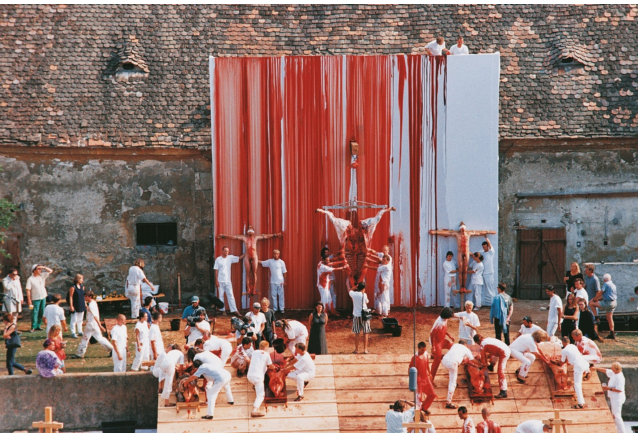
Görsel 2. Hermann Nitsch, Mysterian Theater (Gizem Tiyatrosu), 1998, performans (Nitsch, 1998).

Birinci kuşak feminist sanatçılar, kadın sanatçıların ürünlerinin, nitelikleri, konumu ve değerlendirilmesi üzerinde durarak sergilerde eşit temsil üzerinde durmuşlardır. Kadın bedeninin temsiline, kadının doğurganlığına, ana tanrıça kültürüne, kadın bedeninin biyolojik özellikleri üzerinde yoğunlaşan vajinal imgelere odaklanmışlardır. İlk kuşak feminist sanatçılar arasında; Carolee Schneemann'ın 'Et Şenliği' (1964) performansı yarı pagan bir bedensel