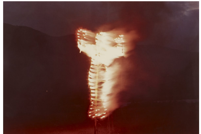
Görsel 4. Ana Mendiata, Silueta Works in Mexico (Meksika'da Silueta Çalışmaları), 1973-77, performans (Mendiata, 1973-77).

Ana Mendiata, Küba asıllı bir kadın sanatçıdır. Sanatçı, çalışmalarında toprak ile bağ kurar ve doğaya dönüş gibi metaforları kullanır. Ana Mendiata, Siluetta dizisinde kendi bedeninin izlerini çamura, kuma, buza, ateşe, çimlere ve toprağa bırakmaktadır. Doğanın gelip geçici döngüsünü referans alarak doğayı organik bir form olarak etüt etmek, bedenin yok olup giden, çürüyen, bozulan bir zemin içinde geçirdiği evreleri göstermek, oluş ve yok oluşun bu kaygan izlerini belge niteliğinde izleyiciye sunar. Ana Mendiata'nın yeryüzünden, yeryüzünün bir parçası olan topraktan ve diğer doğal unsurlardan beslenmesi hiç şüphesiz ki tesadüf değildir. Siluetta 'lar akıp giden, çürüyen geçici hâllerıyla yaşam ile ölüm arasındaki o kesintisiz bağı yansıtmayı hedefler. Bu sembolik dünyanın inşasında bir Küba dini olan 'Santeria' inancı da yer almaktadır. Santeria, Nijerya'dan Küba'ya gelen ilk köleler aracılığıyla temelleri atılmış pagan bir dindir. Doğa güçlerinin tanrılarla özdeşleştirildiği dinde kadın panteonunun güçlü olması, bazı tanrıların hermafrodit olması, bazı ritüelleri sadece kadınların elinde tutması, Ana Mendiata'nın feminist algısında önemli bir yer bulmuştur. Bu bağlamda Ana Mendiata, Santeria inancında simgesel öneme sahip kanı sıkça kullanır. Bu inanca göre kan, negatif bir anlam taşımaz, kan; hayatın, saflığın ve yaşamın içkin gücü olarak