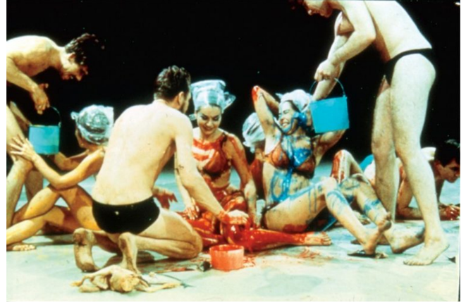
Görsel 3. Carolee Schneemann, Meat Joy (Et Şenliği), 1964, performans ve video sanatı (Schneemann, 1964).