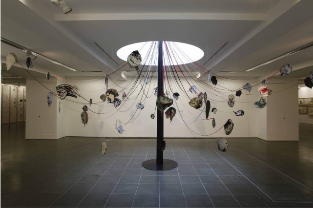
Görsel 7. Nancy Spero, Take No Prisoners (Tutsak Almayın) , 2009, Enstalasyon (Spero, 2009).

dışa doğru yaklaşık 200 bedensiz kafanın kimisinin ağız kısımları açık, kimi kan kusarken kimi de çığlık atan ifadelerle doludur. Spero'nun " Tutsak almayın " isimli çalışması, pagan ritüellerinin bahar ayinlerini çağrıştırmaktadır (Kılıç, 2022, s. 94) (Görsel 7).