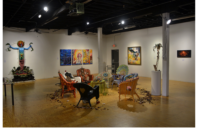
Görsel 9. Modern Paganlar, Antik Diyarlar (Modern Pagans/Ancient Realms) Sergisi , 2016, Enstalasyon (Modern Paganlar Antik Diyarlar Sergisi, 2016).

doğaya tapan dinlerinin yeniden canlanmasıyla ilişkilerini araştırmıştır. Bu sergi, putperest geçmişin alemlerinden gelen kavrayışlardan yararlanarak, günümüzde var olan çok tanrılı inanışların ruhsal meydan okumalarına karşı bir dizi sanatsal yanıt sunar (Graham Mckay, 2016, s. 2) (Görsel 9).