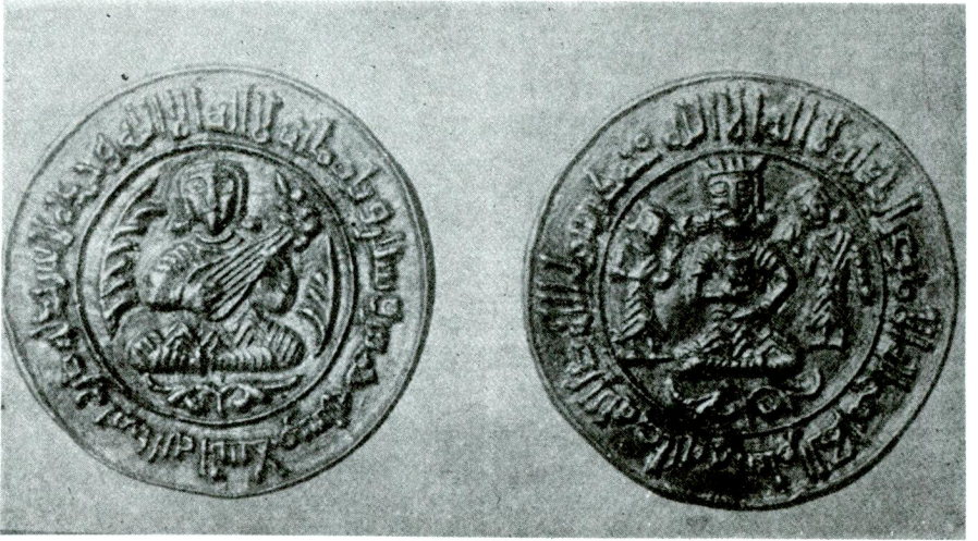
Suphi Paşa'nın Berlin Müzesine sattığı El-Muktedir'in eşsiz madalyası.