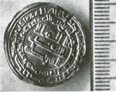
Ebuseraya'nın Küfe'de 199 senesinde basılan dirhemi.