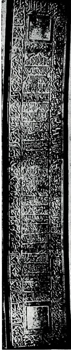
Res. 7 — Miranşah'ın mezarı üzerindeki sanduka kitabesi