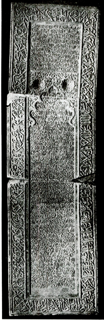
Res. 1 — Timur'un mezar taşı