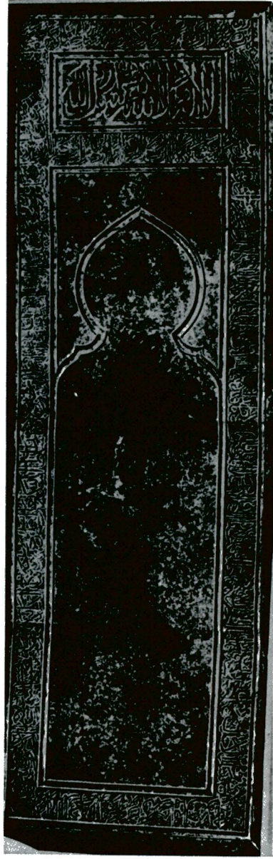
Res. 4 — Şahrüh'un mezarı üzerindeki taş