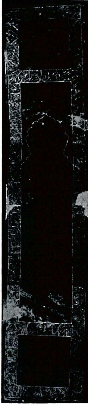
Res. 2 — Timur'un mezarı üzerindeki nefrit sanduka kitahesi