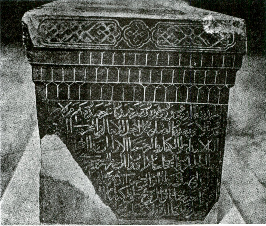
Res. 3 — Timur'un mezarı üzerindeki nefrit sanduka