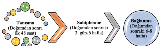
Şekil 1. Bağlanma Süreci

Bağlanma Evresi: Doğumdan sonraki altı-sekiz haftayı kapsayan süre bağlanma evresidir. Ebeveynler ve bebekleri arasında karşılıklı ilişki ve uyum belirgindir. Anne/baba, bebeklerinin bakımında yeterli hale gelmiştir (5,6). Çoğu bağlanma kuramcısına göre bağlanma süreci, anne karnında başlayıp yaşamın ilk iki yılında şekillenir ve süt çocukluğunun bitimiyle güvenli ya da güvensiz olarak bir kez belirlendikten sonra yaşam boyunca süreklilik gösterir (7).