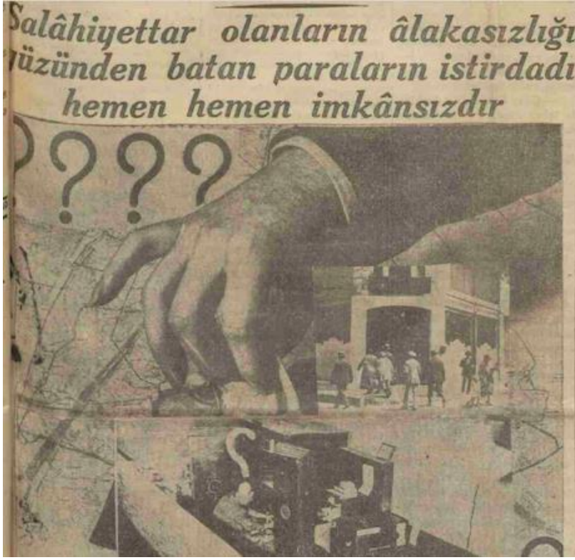
Ek 4: “Esnaf Bankasının Parasını Dağıtan El Kimin?” Başlıklı Haber

Kaynak: Haber. (1934a, 18 Nisan). Milletın malı deniz..., deyip yemişler!.