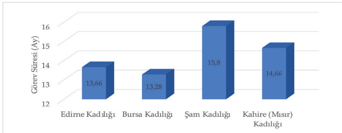
Şekil 3: Bilâd-ı Erbaa Mevalilerinin Görev Süreleri