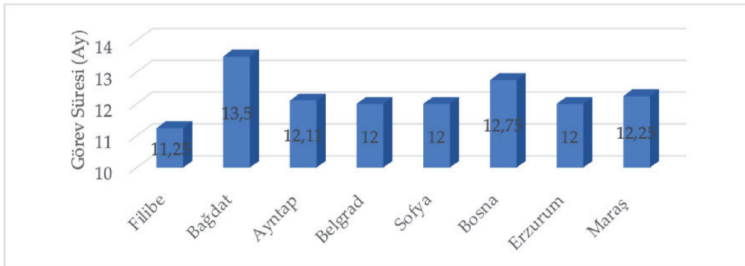
Şekil 1: Devriye Mevalilerinin Görev Süreleri

Mevleviyet derecesinin ilk basamağı olan devriye mevalilerinin hizmet süreleri değerlendirildiğinde şu şekilde bir tablo ortaya çıkmaktadır: 74 müderrisin 61'inin görev süresi -mevleviyet kadılarının normal süresi olarak belirtilen- 39 12 ay olarak gerçekleşmiştir. Bunun dışında padişah iradesi ile uzatma alan yedi kadı bulunmaktadır. Bunların görev süresi 2, 3 ve 4 ay şeklinde uzatılmıştır. Sürmeneli İbrahim Efendi'nin görev süresi oldukça istisnai bir uygulamayla 12 ay uzatılmış ve görev süresini 24 ayda tamamlamıştır. 40 12 aydan kısa süre görev yapan kadılardan Filibe kadısı İbrahimzade Mustafa Efendi 6 ay, Bağdat kadısı Kıbrısî es-Seyyid Hasan Efendi 3 ay ve Maraş Kadısı Geredeli Ali Galib Efendi 10 ay görev yaptıktan sonra vefat etmişlerdir. Tüm bu atamalar birlikte değerlendirildiğinde devriye mevalilerinin ortalama görev süresi 12,23 ay olarak tespit edilmiştir. 41 Aşağıdaki grafikte görüldüğü üzere mevleviyet kadılıkları arasında görev süresi açısından anlamlı farklılık bulunmamaktadır.