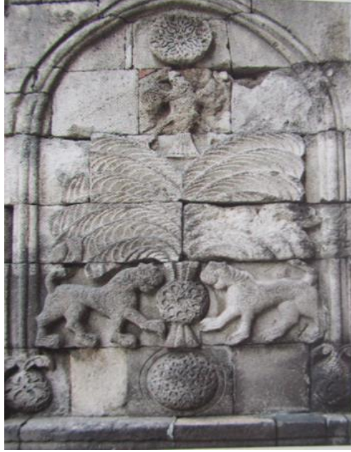
Görsel 1. Erzurum Yakutiye Medresesi Kapısı (1310)