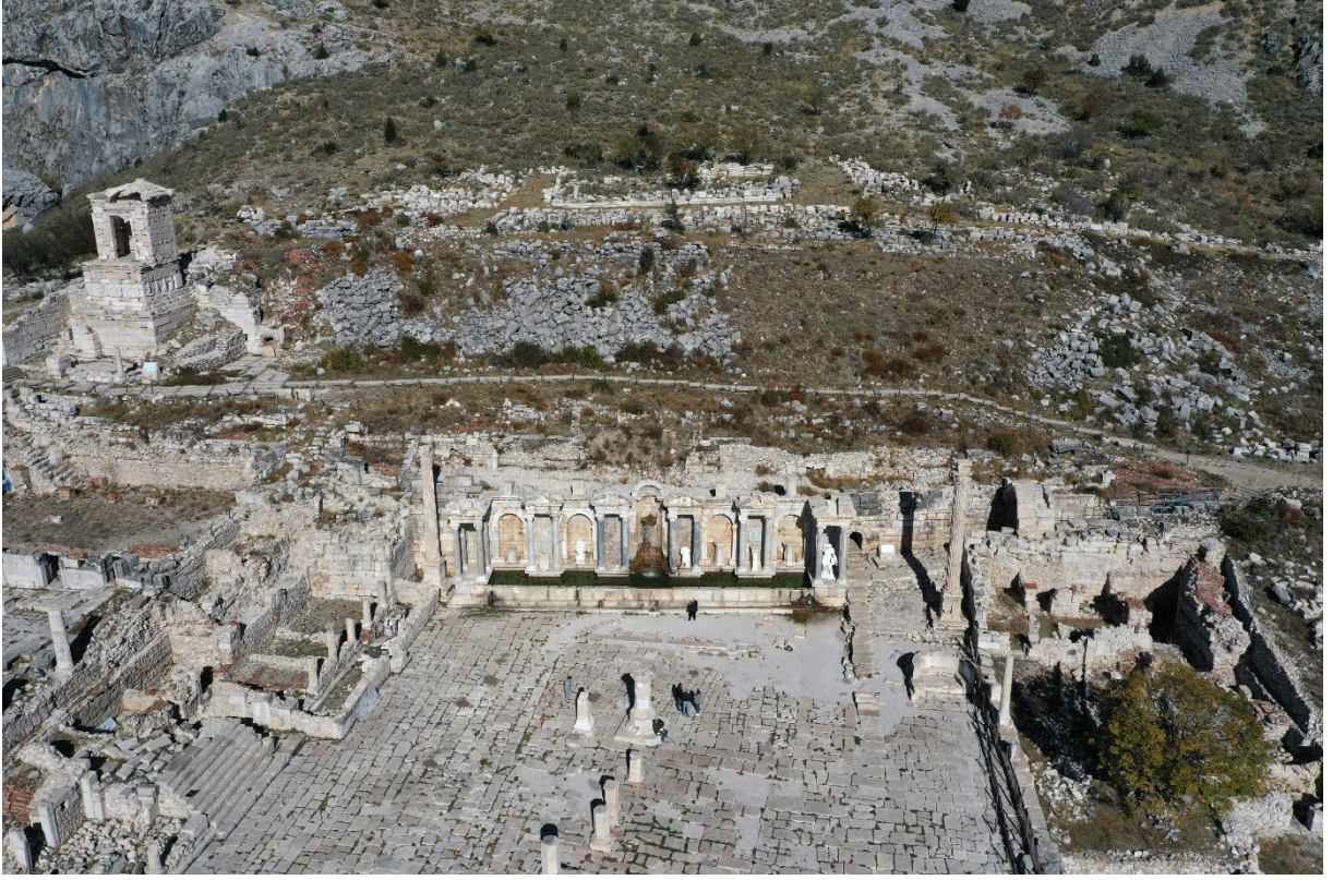
Şekil 3: Burdur Sagalassos Antik Kenti

Sagalassos'da Agora, Kaya Mabedi, günümüzde hala akan Antoninler Çeşmesi, pazar binası, Kent Konağı, Kütüphane, Apollo Klarios Tapınağı, Heroon, gymnasium, roma hamamı, antik tiyatro gibi pek çok yapı bulunmaktadır (Talloen vd., 2019).