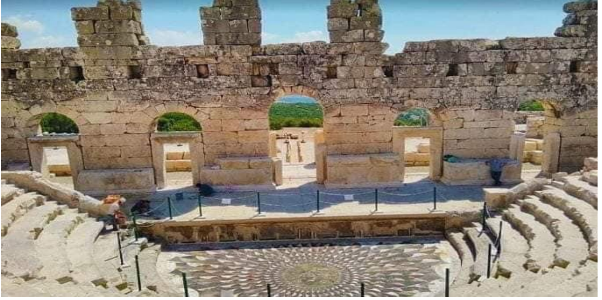
Şekil 4: Burdur Kibyra Antik Kenti