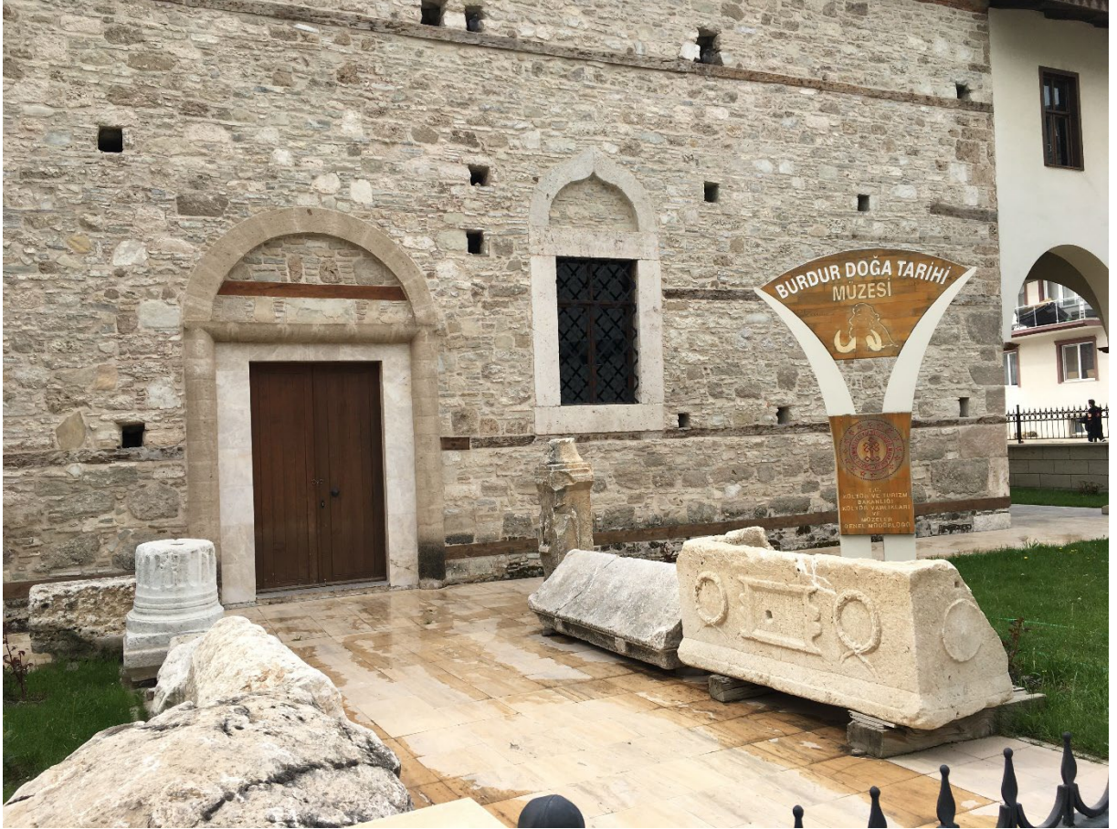
Şekil 2: Burdur Doğa Tarihi Müzesi

içerisinde 2.5 milyon yıl önceki Burdur’da yaşayan kara ve deniz canlıları, Elmacık Ormurgalı fosiller, birçok canlıdan geriye kalan fosil ya da iskelet parçaları olmak üzere 170 eser sergilenmektedir (Kültür ve Turizm Bakanlığı, 2023b). Burdur ili içerisinde 2022 yılı itibariyle 324 adet “Arkeolojik Sit Alanı ve 2 tane “Arkeolojik - Doğal Sit” alanı bulunmaktadır.