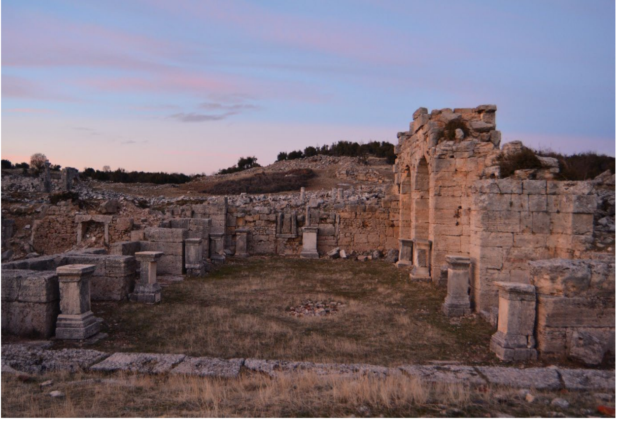
Şekil 5: Burdur Kremna Antik Kenti