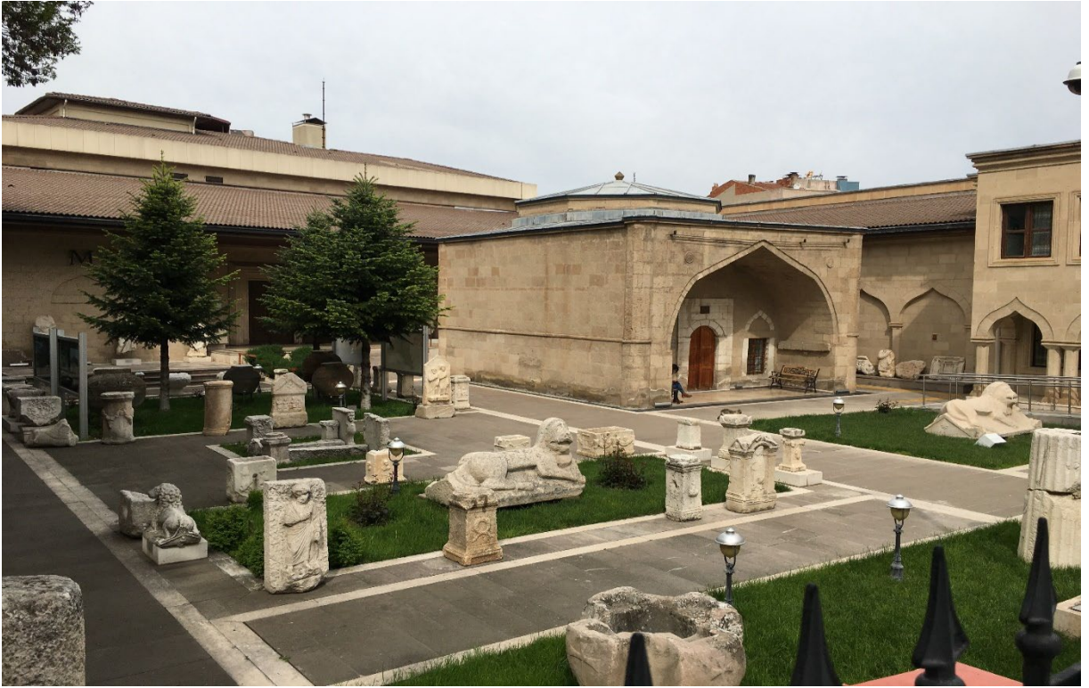
Şekil 1: Burdur Arkeoloji Müzesi

bulunmaktadır (Kültür Varlıkları ve Müzeler Genel Müdürlüğü, 2022a). Pirkulzade kütüphane binasıyla aynı görünüme sahip olarak inşa edilmiştir. Burdur Müzesi giriş kat seksiyonunda Sagalassos, Kibyra, Kremna gibi önemli antik kentlerden gelen eserler sergilenmektedir. Müzenin üst kat seksiyonunda ise, Hacılar Höyük, Kuruçay Höyük, Höyücek Höyük, Yarım Höyük ile Tunç Çağı seramikler, Uylupınar Nekropol buluntuları, Attika kapları, Helenistik ve Roma kapları, kandiller cam, metal ve bronz eserler sergilenmektedir (T.C. Kültür ve Turizm Bakanlığı, 2023a). Küçük bir alana sahip olan Burdur Müzesi taşınabilir kültür varlıklarının fazla olmasıyla ön plana çıkmaktadır. Burdur müzesi içerisinde Helenistik, Roma, Bizans, Selçuklu ve Osmanlı dönemlerine ait mezar steli, lahit, vaftiz havuzu, boyalı/boyasız kaplar, sikkeler süs ve üretim eşyaları, tanrı/tanrıça heykelleri, Neolitik ve Erken Kalkolitik çağlara ait buluntular yer almaktadır (Sop vd. 2019).