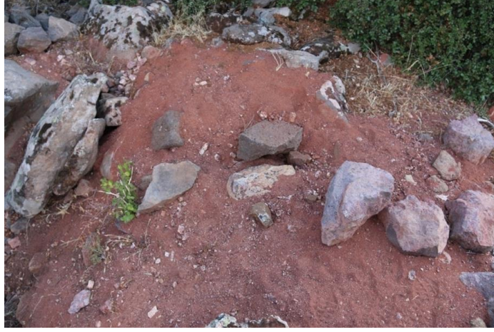
Görsel 10: Büyükikiz Kalesi demir külçelerin tespit edildiği kaçak kazı alanı (İ. Üngör, 2021)

Aşırı korozyona uğramış olan bu külçelerden aldığımız parça analiz ettirilmiş ve demir olduğu anlaşılmıştır. Kale üzerinde hemen her yerin kaçak kazıcılar tarafından kazıldığı, parçalandığı ve birçok eserin götürüldüğü anlaşılmaktadır.