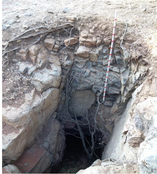
Görsel 11: Büyükikiz Kalesi demir külçelerin tespit edildiği kaçak kazı alanı (İ. Üngör, 2021)