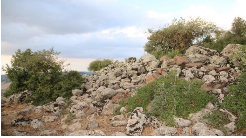
Görsel 8: Büyükikiz Kalesi mimari kalıntılar