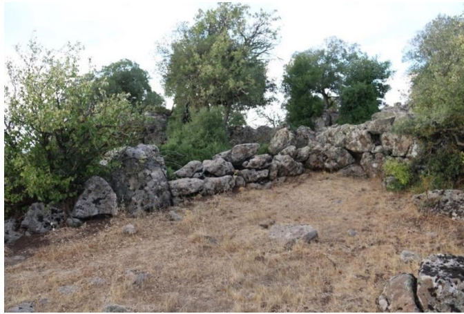
Görsel 4: Büyükikiz Kalesi mimari kalıntılar (İ. Üngör, 2021)

Kalede 2021 yılında yaptığımız incelemelerde derin bir kaçak kazı çukuru tespit edilmiştir. Bölgenin en kurak ayı olan Eylül ayında yaptığımız incelemede, bu çukurun içinde suyun olduğu anlaşılmıştır. Bu nedenle kalenin faal olduğu dönemde de su sıkıntısının olmadığı anlaşılmaktadır. Büyükikiz tepesinin üzerindeki düzlük alanda kurulan kale, kabaca doğu-batı doğrultusunda oldukça geniş bir alana yayılmaktadır. Kalenin mimari yapısında, tepenin doğal yapısında bol miktarda bulunan bazalt taşların kullanıldığı anlaşılmıştır.