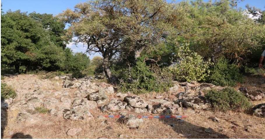
Görsel 6: Büyükikiz Kalesi mimari kalıntıları (İ. Üngör, 2021)