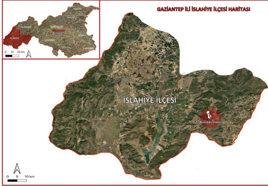
Harita 1: Büyükikiz Kalesi'ni gösteren harita (İ. Üngör Arşivi, 2023)

gibi ayırmaktadır (Alkım, 1960'a; Ünal ve Girginer 2007, ss. 37). Amanoslar ayrıca Kilikya'nın doğu sınırını da belirlemektedir (Ruge, 1921).