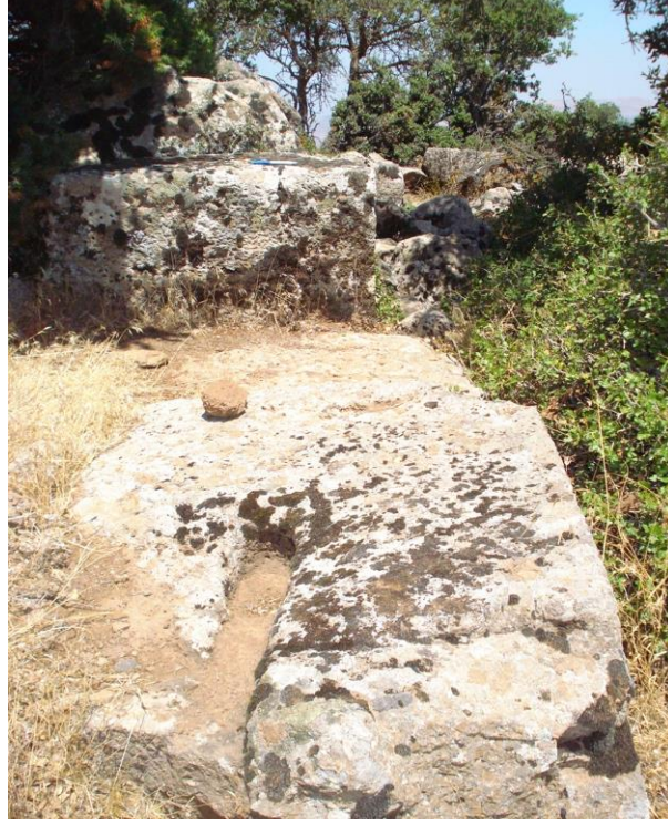
Görsel 5: Büyükikiz Kalesi mimari kalıntıları

Kale içerisinde iri bazalt taşlarla örülmüş, düzgün bir sırada bulunan, çok sayıda dikdörtgen planlı oda kalıntısı bulunmaktadır. Kuzeyi oldukça sarp olan kalenin güneyi ve güneydoğusu daha az engebelidir. Bu yönü çevreleyen bir sur duvarı tespit edilmiştir. Kalenin giriş kapısı da güneyde bulunmaktadır. Bu kapıya bir koridorla ulaşılmaktadır.