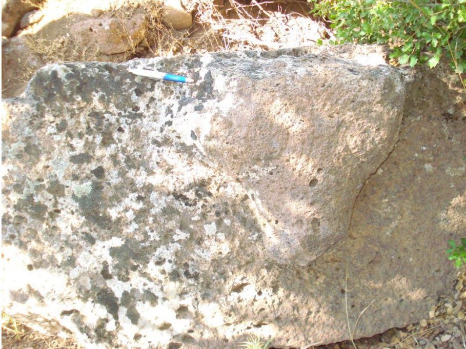
Görsel 7: Büyükikiz Kalesi köçbaşlı mimari yapı taşı (İ. Üngör 2022)