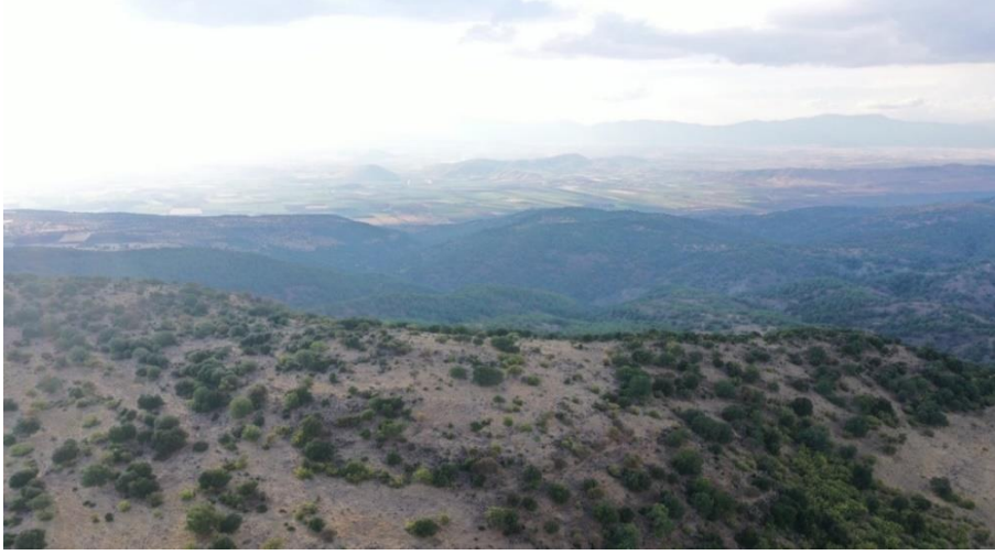
Görsel 1: Büyükikiz Kalesi hava fotoğrafı

Kuzeye döndüğünde Kahramanmaraş Ahır Dağları görülebilirken batıda ise Amanos Dağları görülmektedir. Bu kale İslahiye Ovası'na ise tam hakim bir konumdadır (Üngör 2014: 189).