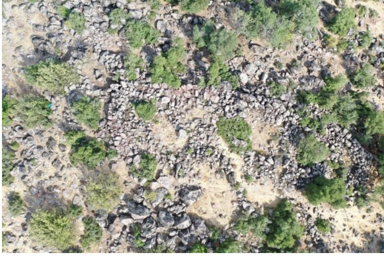
Görsel 3: Büyükikiz Kalesi hava fotoğrafı

Kalede 2021 yılında yaptığımız incelemelerde derin bir kaçak kazı çukuru tespit edilmiştir. Bölgenin en kurak ayı olan Eylül ayında yaptığımız incelemede, bu çukurun içinde suyun olduğu anlaşılmıştır. Bu nedenle kalenin faal olduğu dönemde de su sıkıntısının olmadığı anlaşılmaktadır. Büyükikiz tepesinin üzerindeki düzlük alanda kurulan kale, kabaca doğu-batı doğrultusunda oldukça geniş bir alana yayılmaktadır. Kalenin mimari yapısında, tepenin doğal yapısında bol miktarda bulunan bazalt taşların kullanıldığı anlaşılmıştır.