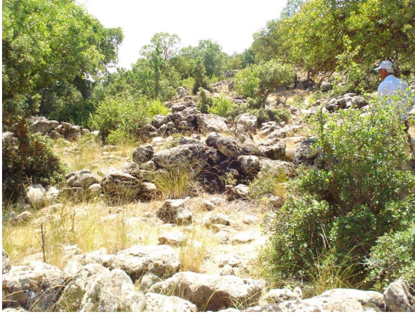
Görsel 9: Büyükikiz Kalesi mimari kalıntılar (İ. Üngör, 2021)

Yine kalenin içinde benzerine Tilmen Höyük'te rastladığımız üzüm suyu çıkarmak için kullanılmış olabileceğini tahmin ettiğimiz kırık bir taş da tespit edilmiştir. Kalede 2021 yılında yaptığımız yüzey araştırmasında kaçak kazı ile ortaya çıkarılmış binlerce demir külçenin olduğu tespit edilmiştir.