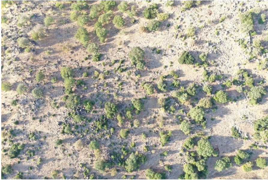
Görsel 2: Büyükikiz Kalesi hava fotoğrafı (İ. Üngör, 2021)