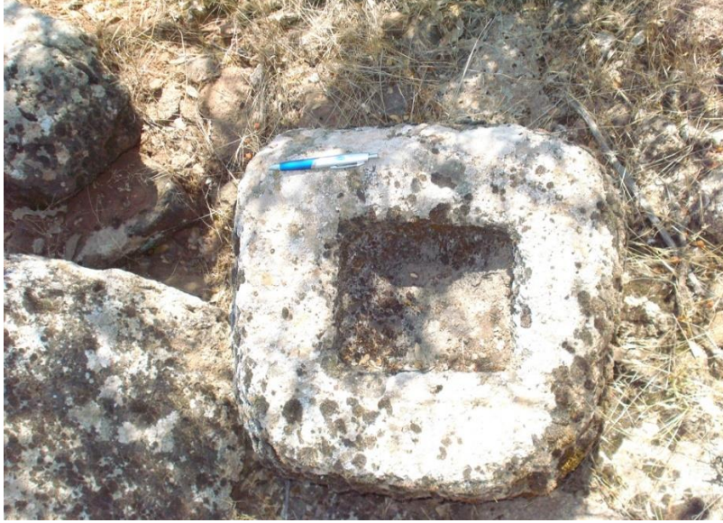
Görsel 12: Büyükikiz Kalesi mimari unsur (İ. Üngör 2022)