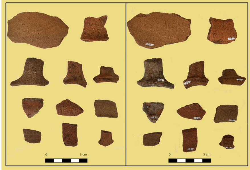
Görsel 14: Büyükikiz Kalesi seramikleri (İ. Üngör, 2023)