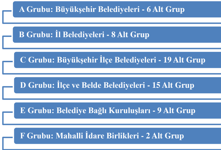
Şekil 2. Belediye ve Bağlı Kuruluşları ile Mahalli İdare Birlikleri Tasnif Cetveli

(Çevre, Şehircilik ve İklim Değişikliği Bakanlığı, 2007)'de belirlenen ilke ve standartlar çerçevesinde ve belediye meclisi kararıyla belirlenen norm kadro doğrultusunda belediye ve bağlı kuruluşları ile mahalli idareler altı ana gruba ayrılmıştır. Türkiye İstatistik Kurumu'nun 2021 yılı adrese dayalı nüfus sayımı uyarınca bu gruplar nüfusa göre farklı sayılarda alt gruplara ayrılmış olup Şekil 2'de tasnif cetveli olarak görülmektedir.