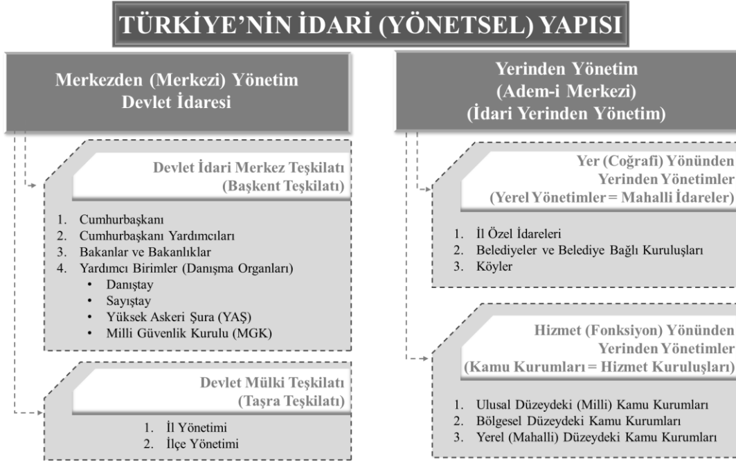
Şekil 1. Türkiye'nin İdari ve Yönetsel Yapısı

idari yapılanmasını merkezden yönetim ile yerinden yönetimden oluşan birbirini tamamlayan iki temel (Mecek ve Atmaca, 2020) ilke düzenlemektedir (Sadioğlu, 2012). Yönetim biliminin tarihsel bir kavramı (Keleş, 2009) ve küresel anlamda modern kamu yönetiminin unsurlarından biri olan (Eryılmaz, 2012) yerel yönetimler, demokrasinin toplumsal yaşama etkilerinin doğrudan görülebildiği ve toplumu oluşturan bireylerin anayasal haklar bakımından kendi özgür iradeleri ile karar verme yetkilerinin olduğu birincil kuruluşlar arasındadır (Görmez, 1997). Türkiye'nin idari ve yönetsel yapısı özet olarak Şekil 1'de yer almaktadır.