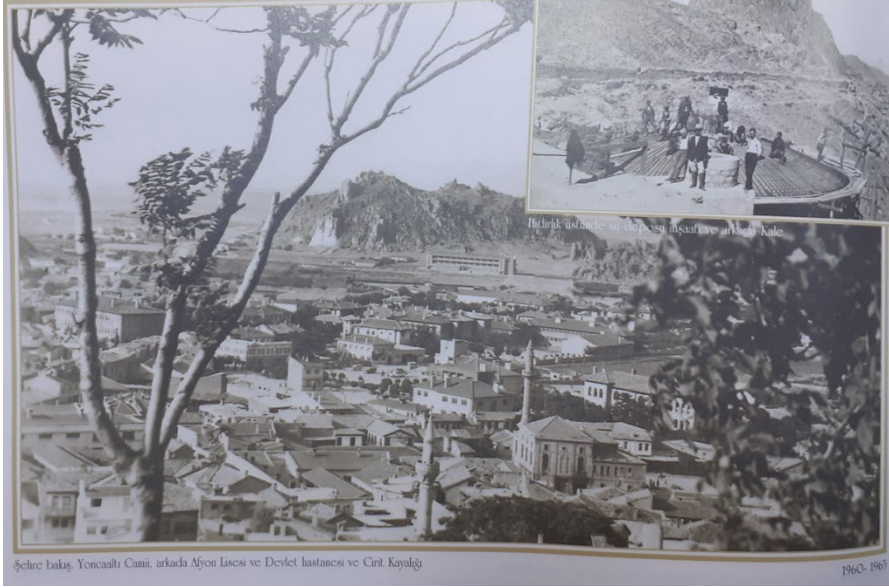
Özpınar, Hasan. Bir Zamanlar Afyonkarahisar , 132.