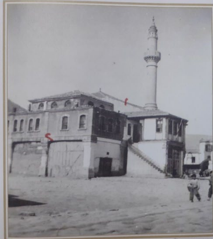
Yoncaaltı Camii ve meydan

Özpunar, Hasan. Bir Zamanlar Afyonkarahisar , 56.