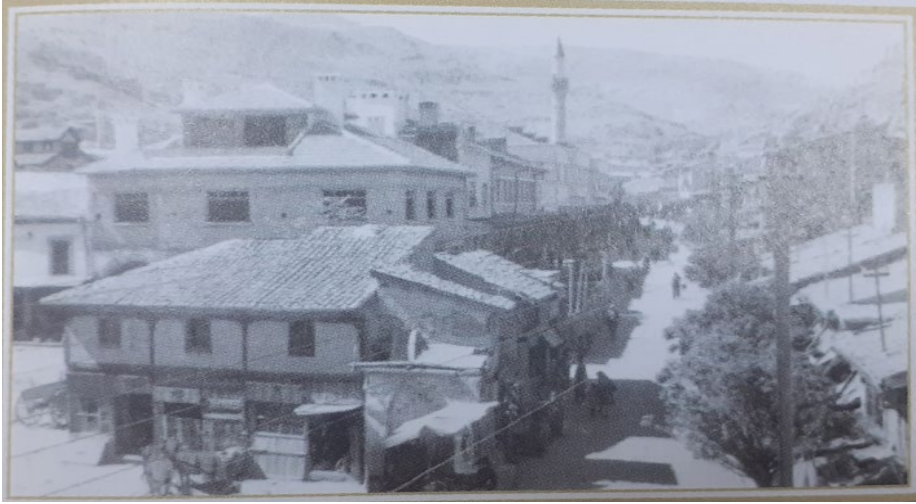
Yoncaaltı Camii önü, Tuzpazarı Caddesi'nin görünümü. Özpınar, Hasan. Bir Zamanlar Afyonkarahisar , 253.