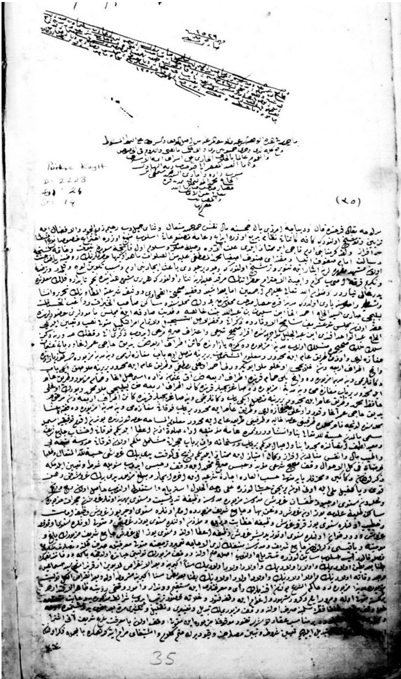
EK-1: Leblebici Sarı es-Seyyid el-Hâc Ahmed Ağa Vakfiyesi (Ankara VGM. Arşivi).