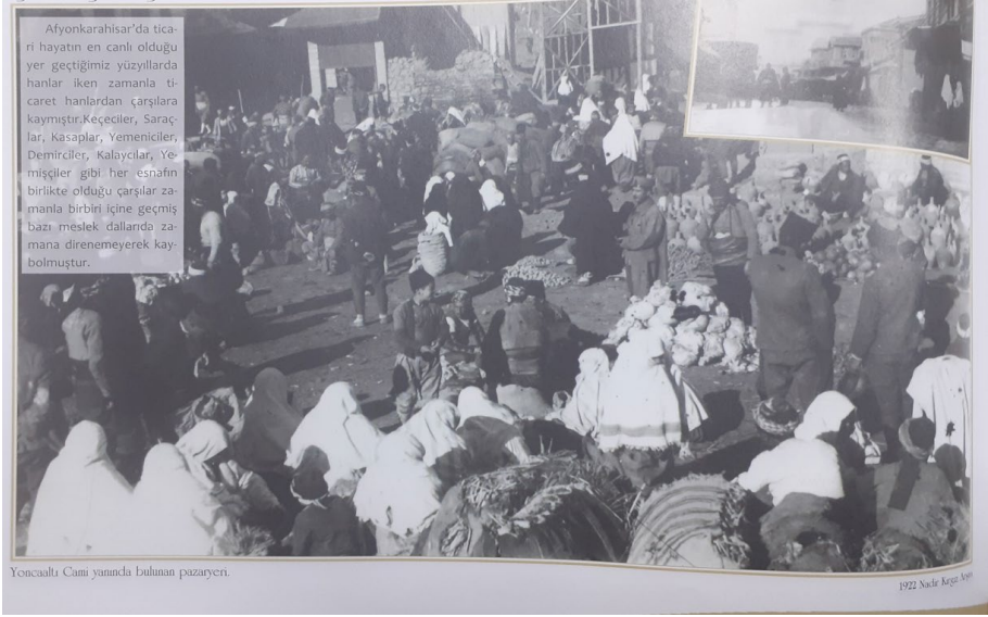
Özpınar, Hasan. Bir Zamanlar Afyonkarahisar , 238.