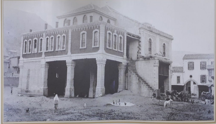
Yoncaaltı Camii yeni halıyla yapılırken. Dış cephe süslemelerinin üzeri sonradan sıva ile kapatılmıştır.