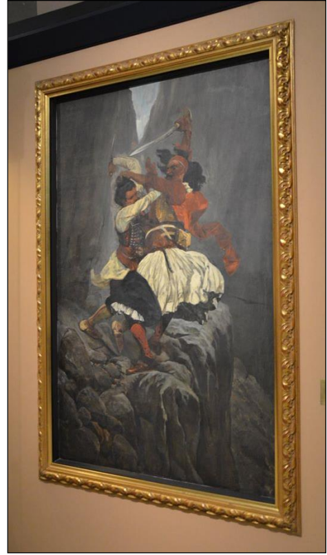
Görsel 1. Yunanistan'ın Atina şehrinde bulunan War Museum, koleksiyonunda Balkan Savaşları'na dair önemli nesne ve belgeler bulundurmaktadır. Sağdaki görsel müzenin sanat koleksiyonunda yer alan ve bir Türk askeri ile Yunan askerinin el kavgasını betimleyen çalışmadır. (A Hand Fight Between a Warrior From Souli and A Turk – by Robert Woodwille).

Aynı şekilde Batının kışkırtmalarıyla hareket eden azınlık yayınlarına da müdahale edilmiştir. İlgili gazeteler ve mecmualar engellenmiş, hatta İstanbul Hükümeti taraftarı yayınların kitlelere ulaşmasına mani olunmuştur. Haber ajanslarına da titizlikle yaklaşıırken, bu yolda muhalif bilgilerin yarattığı kirliliği sona erdirmek için 1920