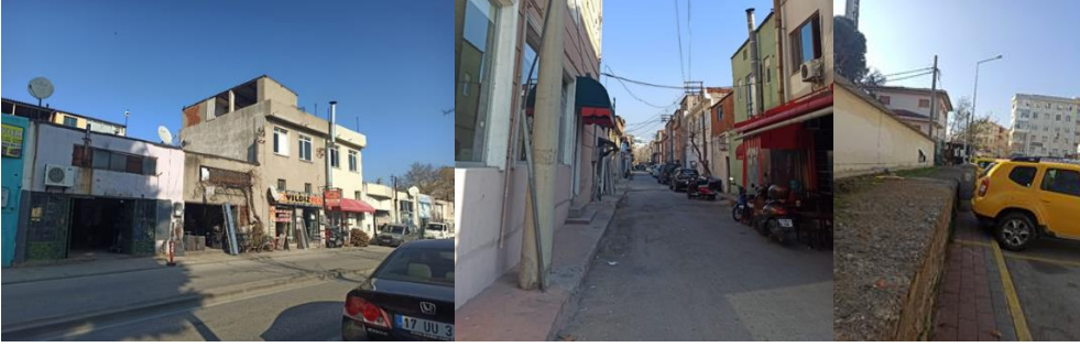
Şekil 16. Çanakkale Cuma Pazarı'nın çevresinden görüntüler (2022)

işgali ve çevrenin karışık görünümü hem çocukları hem de kadınları psikolojik olarak yormakta ve rahatsız etmektedir (Şekil 16).