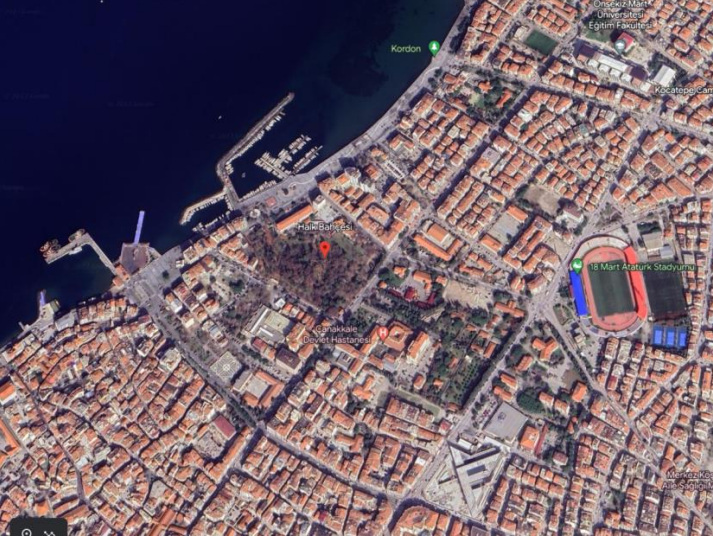
Şekil 5. Kent merkezi, liman, Halk Bahçesi, Devlet Hastanesi ve Kordon (Goggle Earth, 2023).

Çalışma alanı olarak seçilen ikinci bölge, kent merkezinde en büyük yeşil leke pozisyonundaki Halk Bahçesidir. Bu alan, kentli tarafından özellikle yaz aylarında sağladığı gölge ve serinliği ile tercih edilmektedir(Şekil 5). Sahilde dikkat çekici obje olan, temsili Truva Atı'nın ve Çanakkale Valiliği'nin arkasında, Kayserili Ahmet Paşa ve İnönü Caddesi'nin kesişim noktasında olup, 4 ana girişi bulunmaktadır.