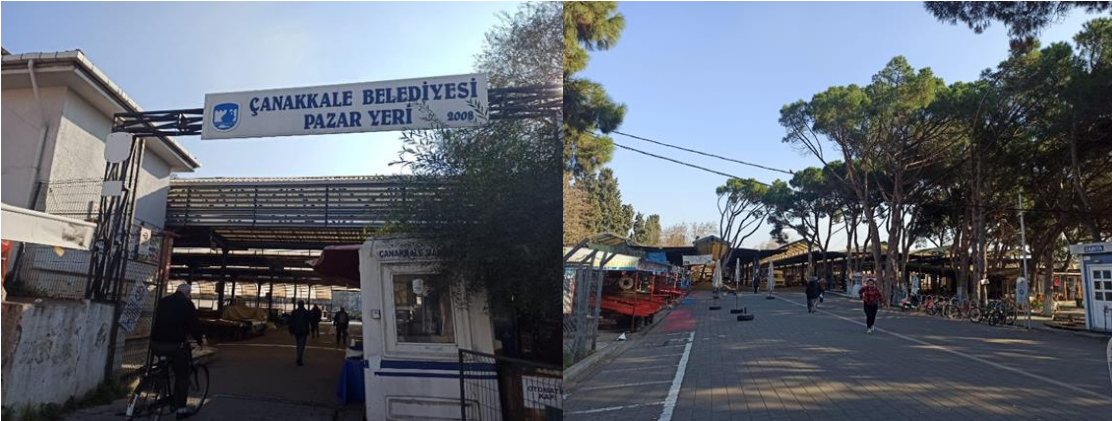
Şekil 15. Çanakkale Cuma Pazarı'nın farklı girişlerinden görüntü (2022)

Pazar alanına yeterince hakim olmayan kadınlar ürün satış standlarının yerlerini kolaylıkla bulamaktadırlar. Pazar içinde herhangi bir yönlendirme veya levha, tanıtım yer almamaktadır. Ayrıca otopark alanı çok azdır ve çok katlı bir otopark yapılmalıdır. Çok katlı otopark yapılabilecek kadar geniş alanlar vardır. Araçların pazar kapılarının hemen yanında park etmesi ve geliş gidişlerin ortada dar, yüksek bir refüj ile ayrılması elinde ağır paket taşıyan kadınlar, özellikle çocukları ile gelenler ve yaşlılar için büyük sorun oluşturmaktadır.