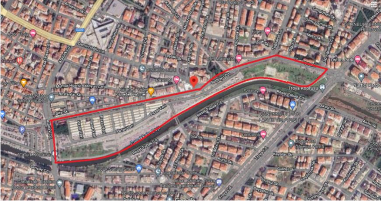
Şekil 14. Namık kemal Mahallesi (Goggle Earth 2023'den yararlanılarak)

İl'in farklı yerlerinden kullanıcıların ihtiyaçlarını karşıladığı Cuma pazarı(CUMPA) bu mahallededir ve kentin tarihine adını yazdırmıştır. Kadınların evin ekonomisi ve ihtiyaçlarını daha çok takip etmesi nedeni ile kentte farklı günlerde de pazar kurulmasına karşın, kadınlar Cuma günlerini ürün çeşitliliğinin daha fazla olması, köylerden ve farklı yerlerden satıcıların gelmesi nedenleri ile tercih etmektedirler ve çok kalabalıktır.