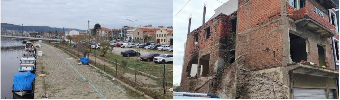
Şekil 10. Sarıçay bölgesinden görünüm (2022)

alandır (Şekil 10). Bu bölgede konumlanan Nalbantlar Caddesi ve Nalbantlar Sokak terkedilmiş harabe binalarıyla şehir güvenliği ve kadınların kullanımı açısından sağlıklı değildir.