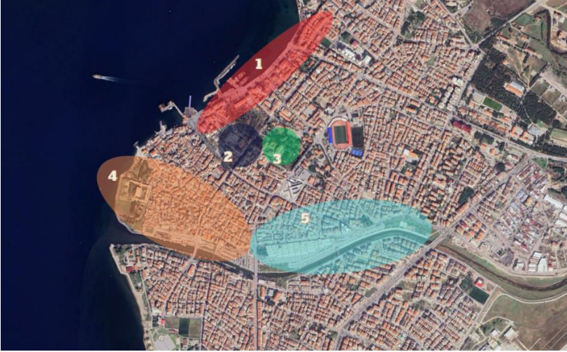
Şekil 2. Çanakkale kent merkezi ve çalışma alanları: 1- Eski Kordon, 2- Halk Bahçesi bölgesi, 3- Hastane bölgesi 4- Fevzipaşa Mahallesi, 5- Namık Kemal Mahallesi (Goggle Earth 2023' den yararlanılarak)

Çalışma yönteminde Çanakkale kent merkezinde en yoğun kullanılan 5 bölge örnek alan olarak seçilmiştir. Bu alanlar yerinde mekânsal olarak incelenerek hazırlanan bilgi formu ile analizleri yapılmıştır. Bilgi formu çalışmanın farklı alanlara uygulanması ve karşılaştırılma olanağı sağlamaktadır.