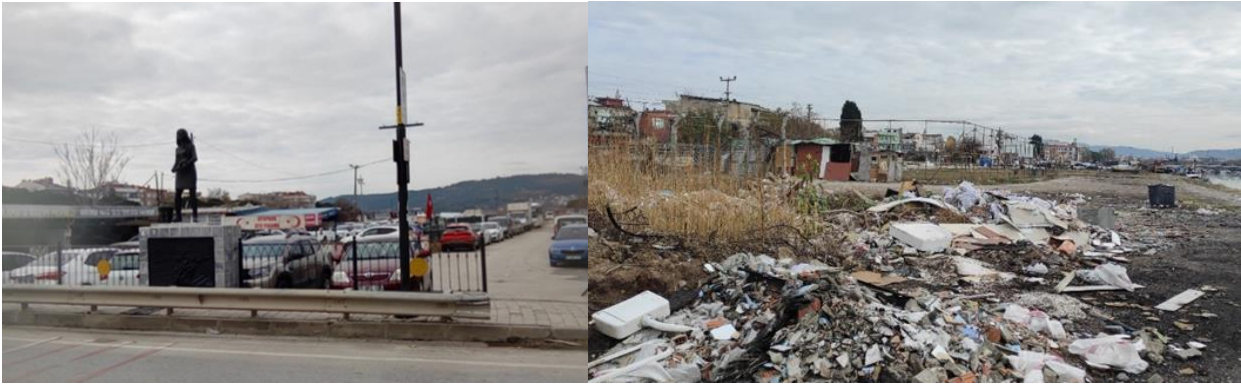
Şekil 11. İnönü köprüsünün iki tarafından görüntü (2022).

İnönü köprüsü ve İnönü Caddesi üzerine yerleştirilen heykeller ve estetik unsurlarla, modern bir kent görünümü yaratılmaya çalışılsa da İnönü köprüsünden Fevzi Paşa Mahallesi'ne doğru olan bölüm uzun yıllar bakımsız kalmanın, kaderine terk edilmenin izlerini yansıtmaktadır (Şekil 11).