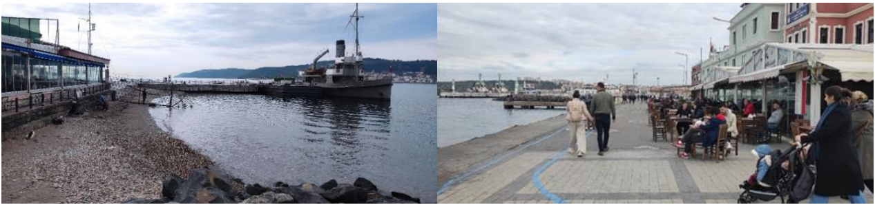
Şekil 13. Çimenlik Kalesi'nin deniz kıyısı, Nusret Mayın Gemisi ve kafeler (2022)

Balıkxane Sokak ise Çimenlik Kalesi'nden paslı demir parmaklıklarla ayrılmaktadır. Gümrük Bölgesi olarak bilinen alanda sahil güvenliğinin kullandığı iskele, balıkçıların yoğun kullandığı bir alandır ve dört tarafında da korkuluk bulunmamaktadır. Güvenlik önlemlerinin iyi olmadığı bölgede ayrıca işletmeler kordonu da işgal etmektedir. Ayrıca bu bölgede kent mobilyalarının ve çöp kutularının eksikliği de dikkat çekmektedir (Şekil 13). Kadınların ücret ödemededen boğaz kıyısında dinlenebilecekleri oturma elemanları çok sınırlıdır.