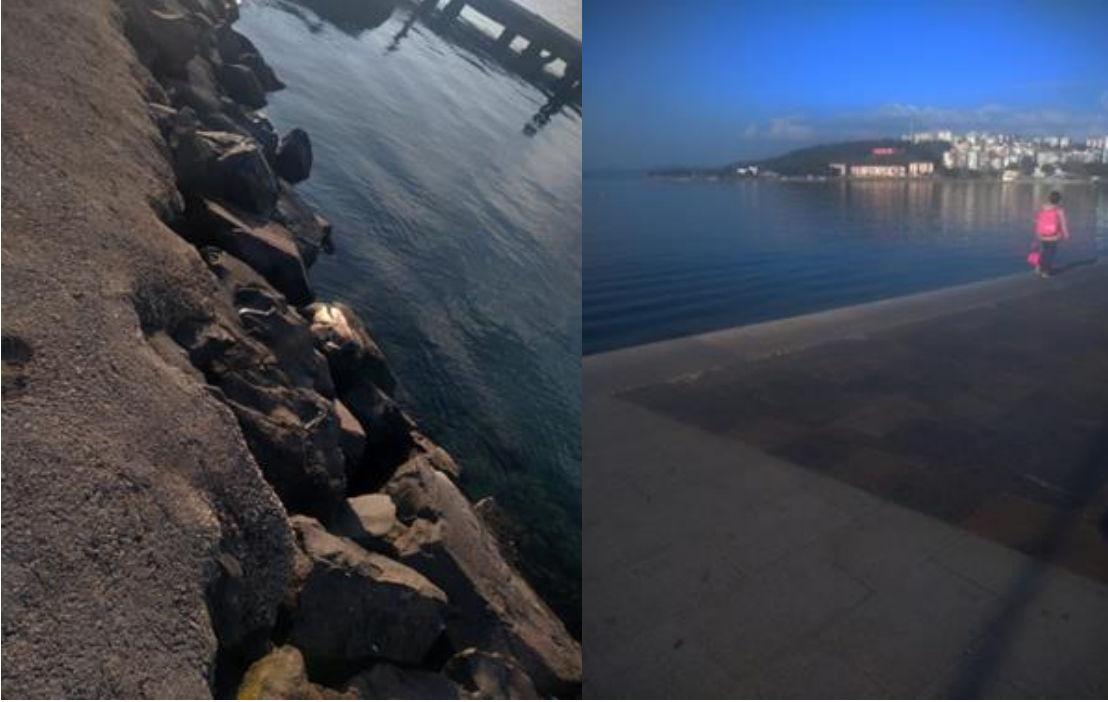
Şekil 3. Çanakkale Eski Kordonun deniz kıyısından görüntüleri (2022)

Kordon uzun bir alan olmasına karşın sadece aktif kullanılan bir çeşme bulunmaktadır ve yetersizdir. Anneler için en önemlisi çocukların ellerinin sürekli kirlenmesi ve hijyen sağlanmasıdır. Alanda heykel, tanıtımlar, donatılar, oyun ekipmanları, oturma üniteleri vardır ancak yeterli çöp kutusu yoktur. Kordonun zemin kaplamalarında takılıp düşmeye neden olabilecek bozuk bölümler vardır (Şekil 4). Kadınlar gün içinde bir çok sorumluluğu yerine getirmek durumunda kalabildiği için acele hareket edebiliyorlar. Özellikle ileri yaş dönemindeki tüm kişiler için takılıp düşmek çok risklidir. Bu durum yaşlı ebeveynine eşlik eden kadın ve anneler için daha da önemlidir.