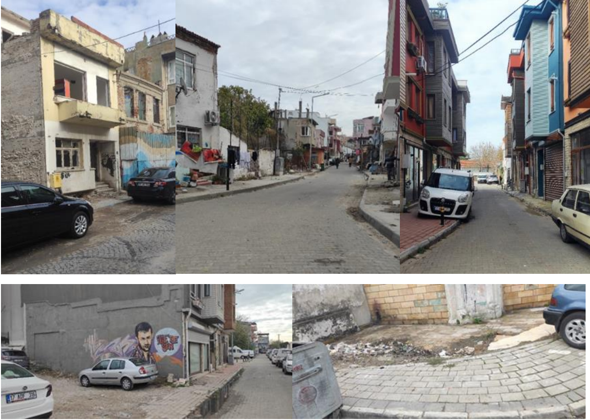
Şekil 12. Fevzipaşa Mahallesi'ne ait sokaklardan görünüşler (2022).

Balıkxane Sokak ise Çimenlik Kalesi'nden paslı demir parmaklıklarla ayrılmaktadır. Gümrük Bölgesi olarak bilinen alanda sahil güvenliğinin kullandığı iskele, balıkçıların yoğun kullandığı bir alandır ve dört tarafında da korkuluk bulunmamaktadır. Güvenlik önlemlerinin iyi olmadığı bölgede ayrıca işletmeler kordonu da işgal etmektedir. Ayrıca bu bölgede kent mobilyalarının ve çöp kutularının eksikliği de dikkat çekmektedir (Şekil 13). Kadınların ücret ödemededen boğaz kıyısında dinlenebilecekleri oturma elemanları çok sınırlıdır.