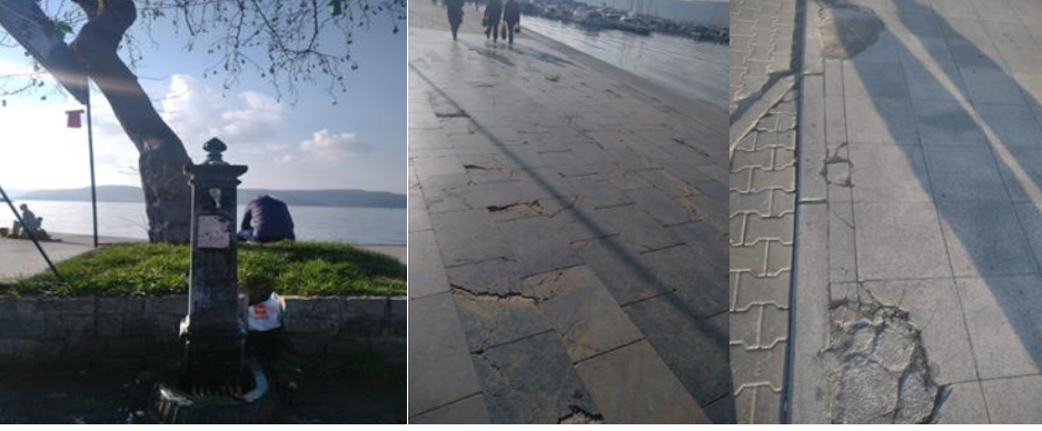
Şekil 4. Kordondaki donatılardan bazı görüntüler (2022)

Çalışma alanı olarak seçilen ikinci bölge, kent merkezinde en büyük yeşil leke pozisyonundaki Halk Bahçesidir. Bu alan, kentli tarafından özellikle yaz aylarında sağladığı gölge ve serinliği ile tercih edilmektedir(Şekil 5). Sahilde dikkat çekici obje olan, temsili Truva Atı'nın ve Çanakkale Valiliği'nin arkasında, Kayserili Ahmet Paşa ve İnönü Caddesi'nin kesişim noktasında olup, 4 ana girişi bulunmaktadır.