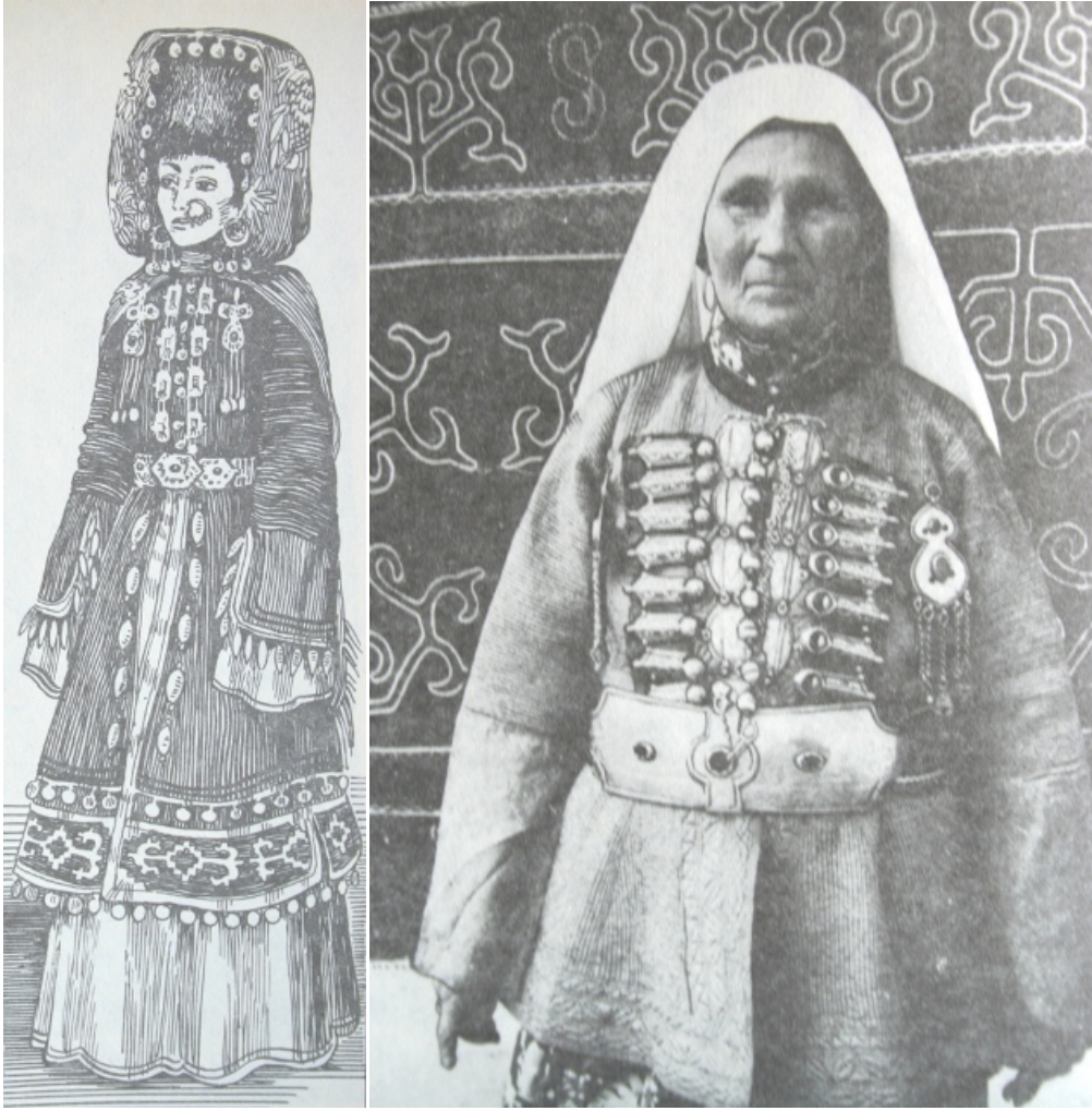
Resim 8: Astrahan Nogayı ve Stavropol Terekli Mektep'ten bir Nogay