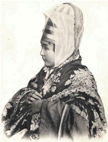
Resim 11: Kuban Nogayı