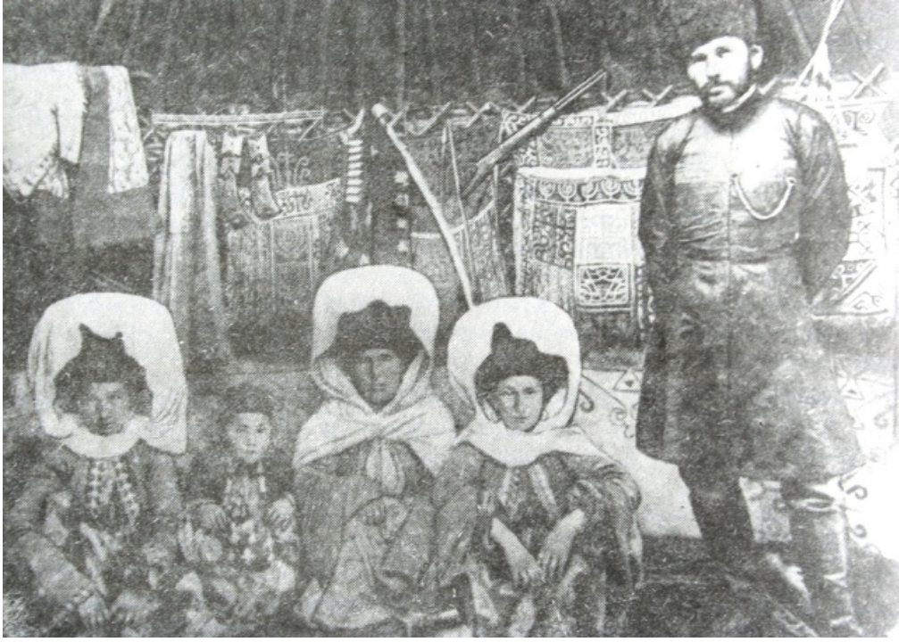
Resim 5: Nogay ailesi