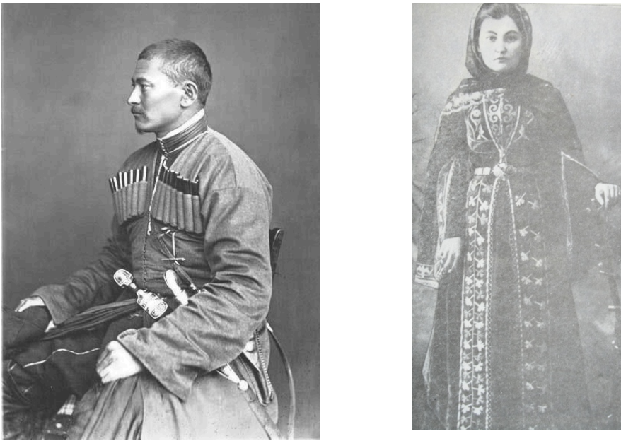
Resim 9: Kafkas kıyafetleri içinde Kuban Nogayları