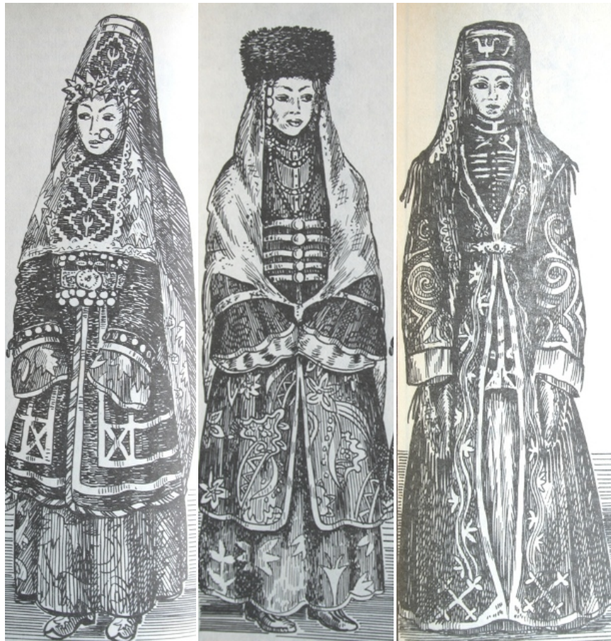
Resim 2: Yurt Nogayı Karagaş Nogayı