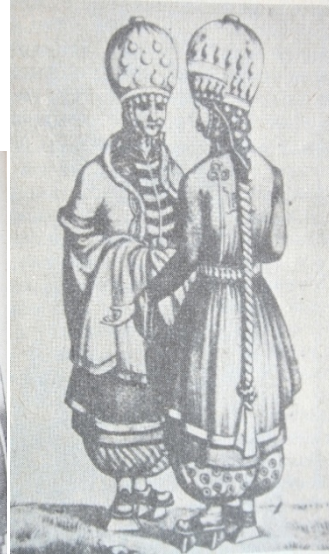
Resim 3: Karadeniz Kuzeyi Nogayları