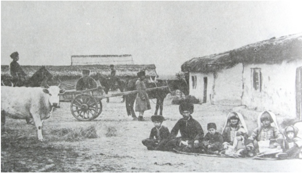
Resim 4: Bozkır Nogayları