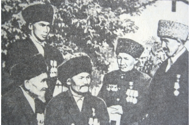
Resim 12: Nogay Erkekleri