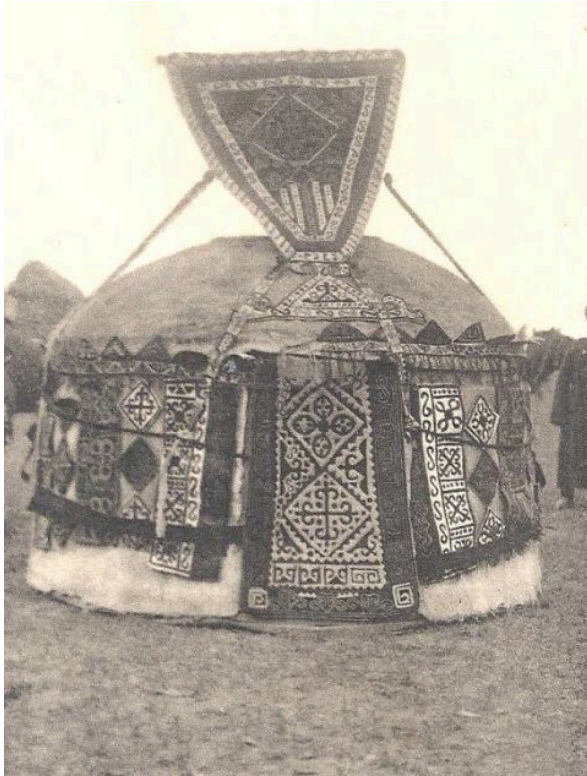
Resim 6: Dağıstan'da Kara Nogay çadırı