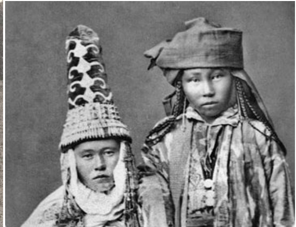
Resim 7: Kara Nogaylar