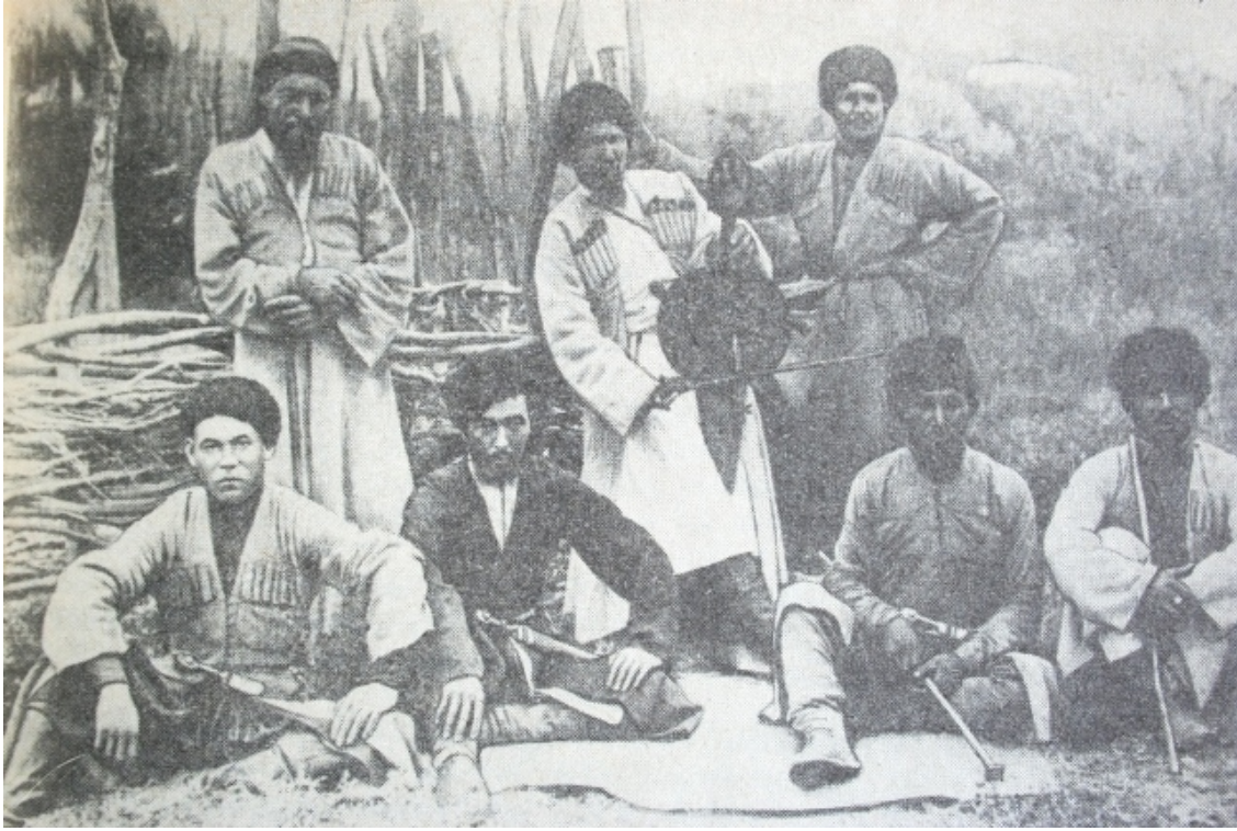
Resim 10: Kafkas kıyafetleri içinde Kuban Nogayları