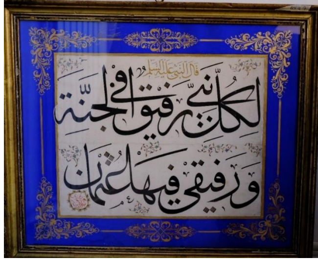
Resim 6: Bursa İnebey Kütüphanesi Mahmud Celâleddin İmzalı 7 Envanter No’lu Celi Sülüs Hat Levha (Güney Zincir, 2022)

Eserde Arapça: “Kâle’n-nebiyyü aleyhi’s-selâm Li-küllü nebiyyin refikûn fi’l-cenneti ve refikî fi’hâ Osman” ibareleri yer alır. Türkçesi: “Hazreti peygamber dedi ki: Her peygamberin cennette bir refikî (yoldaş, arkadaş) vardır. Benim oradaki refikim Osman’dır” (Resim 6).