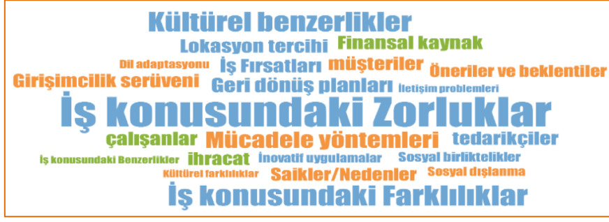
Şekil 3: Katılımcı ifadelerindeki kodların sıklığına ilişkin kod bulutu

Tablo 3’de literatürden elde edilenler bilgiler ve katılımcılardan elde edilen verilerden yola çıkılarak ana tema ve kategoriler oluşturulmuştur. Çalışma kapsamında 3 ana tema ve 15 alt tema belirlenmiştir. İş piyasasına ana temasına ilişkin 116 kodlama, kültürel adaptasyon ana temasına ilişkin 78 kodlama, girişimcilik serüveni ana temasına ilişkin ise 74 kodlama, geri dönüş planına ilişkin 22 kodlama ve öneri ve tavsiyelere ilişkin ise 19 kodlama yapılmıştır.