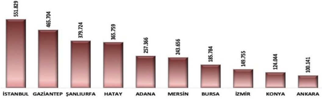
Şekil 1: Geçici koruma kapsamındaki Suriyelilerin illere göre dağılımı