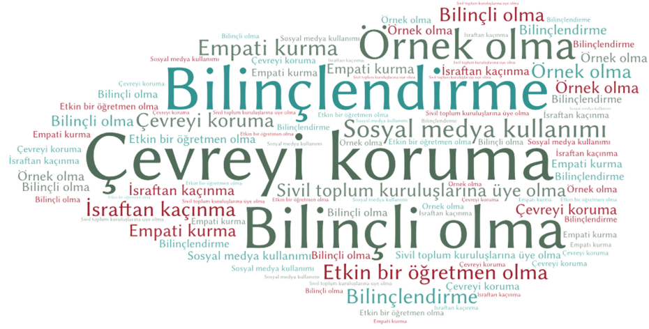
Şekil 6. Sorunların Çözümüne Yönelik Eylemler Temasında Yer Alan Kodların Yoğunluğu.

olumlu değerler oluşmasını engellediğini belirtmiştir. Ayrıca öğretmen adayları, insanların yaşayış tarzının çevre kirliliğine, doğal kaynakların tahribine ve israfa neden olduğunu ve doğal kaynakların aşırı tüketiminin de sürdürülebilirliği engellediği için günümüz dünya sorunlarının oluşumuna neden olduklarını ifade etmişlerdir. Uymaz'ın (2021) yaptığı çalışmada, öğretmen adaylarının günümüz dünya sorunlarının oluşumunu bencilik, doğal kaynakların bilinçsizce tüketilmesi, doğal çevrenin tahrip edilmesi gibi insan kaynaklı faaliyetlere bağladığı sonucuna ulaşılmıştır. Mevcut çalışmada da sosyal bilgiler öğretmen adaylarının günümüz dünya sorunlarının oluşmasında bilinçsizliği başat faktör olarak görmelerinin yanında insanların yaşayış tarzlarının ve doğal kaynakların bilinçsizce kullanılmasının da etkili olduğunu düşündükleri sonucuna ulaşılmıştır.