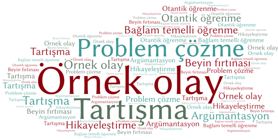
Şekil 5. Öncelikli Tercih Edilen Öğretim Yöntemleri Temasında Yer Alan Kodların Yoğunluğu.