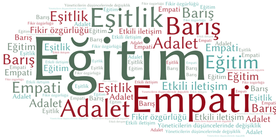
Şekil 4. Günümüz Dünya Sorunlarının Çözüm Yolu Temasında Yer Alan Kodların Yoğunluğu.

Araştırmanın ikinci alt amacı, sosyal bilgiler öğretmen adaylarının günümüz dünya sorunlarının oluşma nedenlerine ilişkin görüşlerine yöneliktir. Öğretmen adayları, günümüz dünya sorunlarının oluşmasında en önemli unsurun insan olduğunu vurgulamışlardır. Sosyal bilgiler öğretmen adaylarının günümüz dünya sorunlarının oluşmasında bilinçsizliği, insanların yaşayış tarzını ve doğal kaynakların aşırı tüketimini öne çıkan sebepler olarak gördüğü anlaşılmaktadır. Öğretmen adayları bunları açıklarken bilinçsizliğin farklı sorunların oluşumuna zemin hazırladığını ve insanlarda