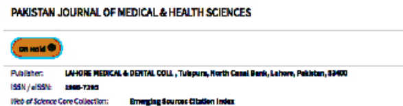
Şekil 2. Pakistan Journal of Medical & Health Sciences Dergisi'nin 31.01.2023 Tarihli Web of Science Görüntüsü