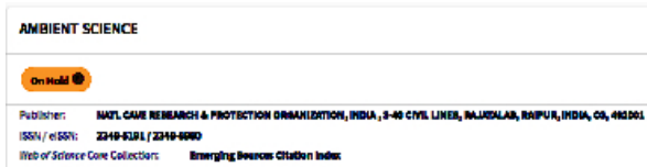
Şekil 1: Ambient Science Dergisi'nin 31.01.2023 Tarihli Web of Science Görüntüsü

Bu tip endekslerde yer alan şaibeli dergilerin, önce ilgili endekslerde incelemeye alındığı ve endeksteki konumlarının askıya alındığı görülmektedir. Bu sürecin sonucunda dergilerin endeksten ihraçları veya yayın hayatlarına son vermesi söz konusudur. Bu kapsamda bu dergiler yağmacı dergi listelerine hemen girmemekte, ancak belirli bir süre sonra hak ettikleri yerleri bulmaktadır. Burada birkaç dergi ile ilgili örnek vermenin faydalı olacağı kanısındayım. Örneğin, Hindistan'da yayınlanan "Ambient Science", Pakistan'da yayınlanan "Pakistan Journal of Medical & Health Sciences", "Journal of Pharmaceutical Negative Results" ve İtalya merkezli görünen "Progress in Nutrition" adlı dergiler "Web of Science" ta tarandıklarını kendi internet sitelerinden ilan etmektedirler. Ancak "Web of Science" ta tarama yapıldığında Şekil-1, Şekil-2 ve Şekil-3'teki gibi farklı bir sonuç ile karşılaşmakta, bu dergilerin endeksteki durumunun askıya alındığı ve incelemeye alındıkları "On Hold" ibaresinden anlaşılmaktadır. Burada sadece birkaç örnek verildiği ve ESCI, SSCI ve SCI'daki konumu askıya alınan dergilerin sadece bunlarla sınırlı olmadığı belirtmelidir. İlk iki derginin ESCI'da üçüncü derginin ise SCI Expanded içinde yer aldığı görülmektedir.