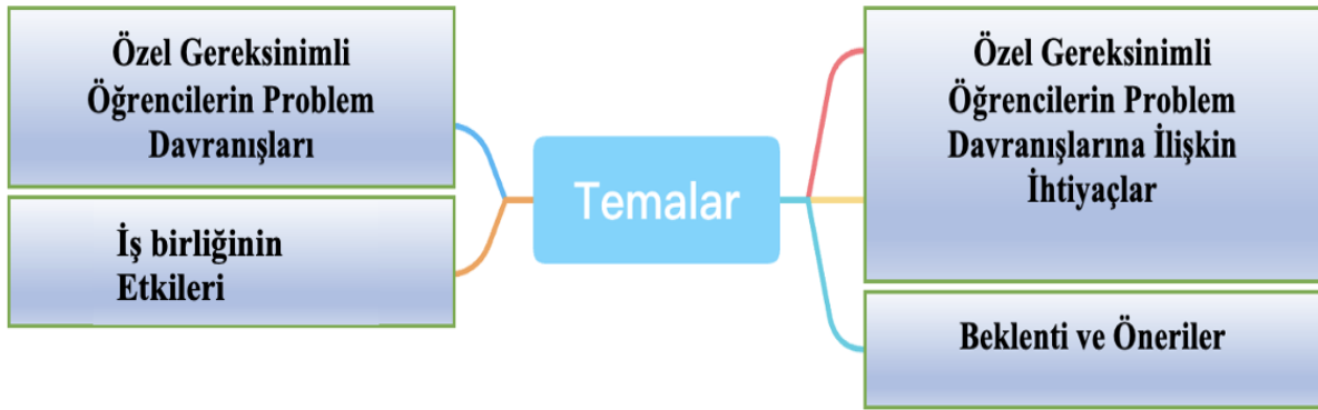
Şekil 1. Öğretmenlerin Kaynaştırma/Bütünleştirme Uygulamaları Yapılan İlkokul Sınıflarındaki Özel Gereksinimli Öğrencilerin Problem Davranışlarına Müdahalede İş Birliğine İlişkin Görüşleri

Verilerin analizi sonunda araştırmaya katılan öğretmenlerin görüşleri dört ana tema altında toplanmıştır. Öğretmenlerin kaynaştırma/bütünleştirme uygulamaları yapılan ilkökul sınıflarındaki özel gereksinimli öğrencilerin problem davranışlarına müdahalede iş birliğine ilişkin görüş ve önerileri Şekil 1’de görülmektedir.