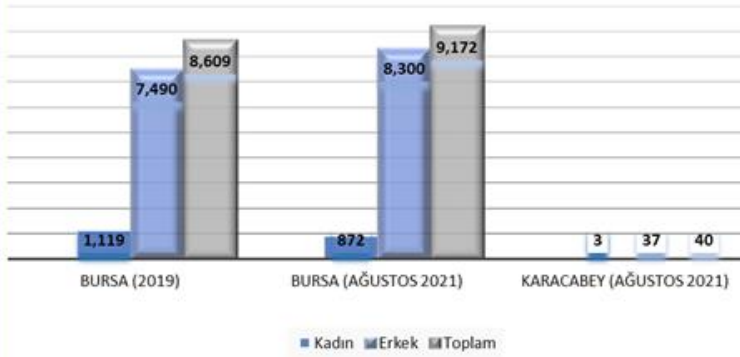
Grafik 2: Bursa İli (ve Karacabey ilçesi) Cinsiyete göre yabancılara verilen çalışma izni sayıları, 2019 ve 2021

Kaynak: Çalışma ve Sosyal Güvenlik Bakanlığı, Yabancıların Çalışma İzinleri, 2019; Bursa İl Müdürlüğü Sosyal Güvenlik Kurumu, 10 Ağustos 2021.