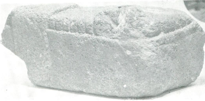
← Res. 2