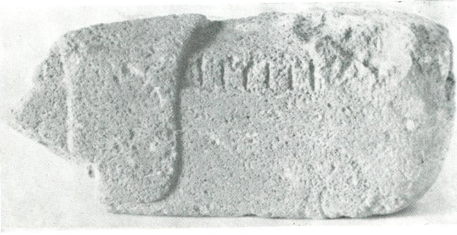
← Res. 1