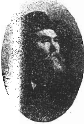
Ahmed Midhat Efendi [ TDEA, I, 68 ]