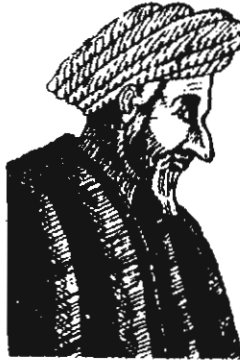
Hasan-ı Sabbâh [ Hayat Ansik., III, 1496 ]