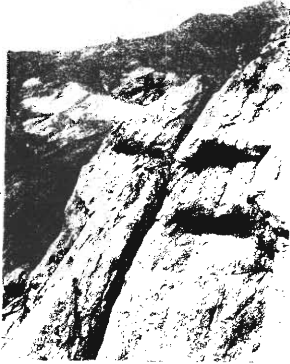
Alamüt kayalığının kuzeybatı tarafı [ BSOS, V (1928-30) ]