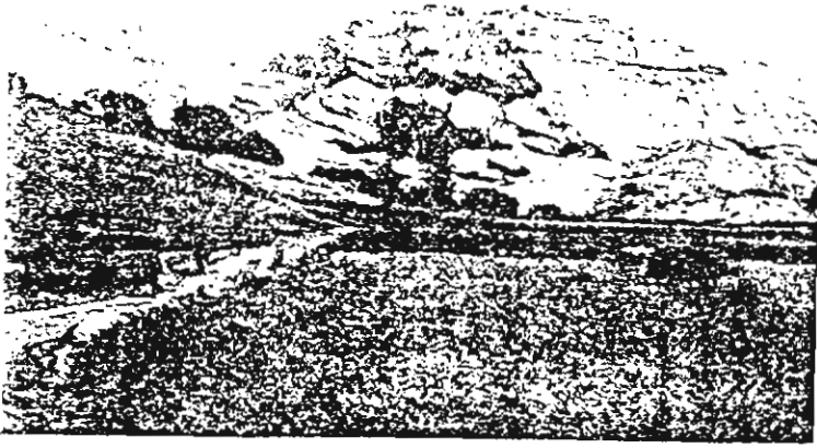
Alamüt kâvaliğinin güneyden görünüşü [ BSOS, V (1928-30) ]