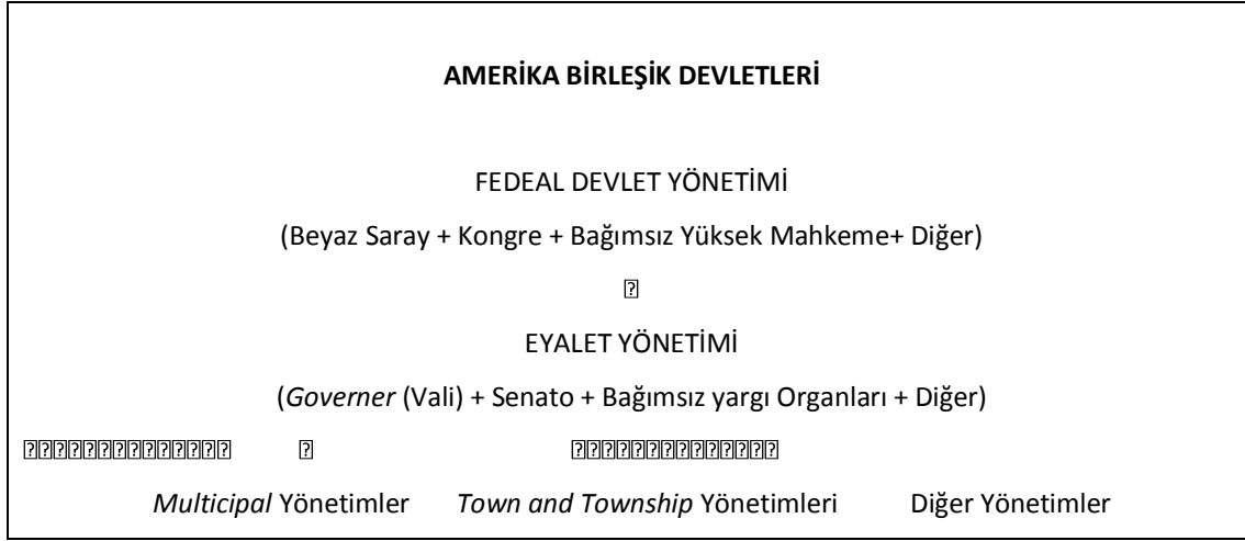
Şema 1. Şematik Olarak ABD Devlet Teşkilatı