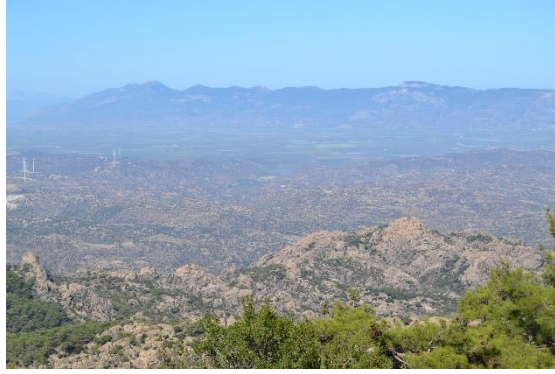
Resim 8. Latros'un Eteklerinden Büyük Menderes Ovası

da karşımıza Latros'un kuzeyindeki ovalık alandan geçen Maiandros [Büyük Menderes] Nehri problemi çıkmakla birlikte bu zamanda birlikler için, en azından belli noktalarda, bu nehrin geçilmesi imkânsız değildir. Bir müddet sonra Bizans ve Tangrıpermes ve yanındaki beylerle gerçekleşen savaş hakkında Komnena, "Türklerden kaçabilenler, Maiandros [Menderes] Irmağı'nı geçtiler." bilgisini vererek bunu doğrulamaktadır.