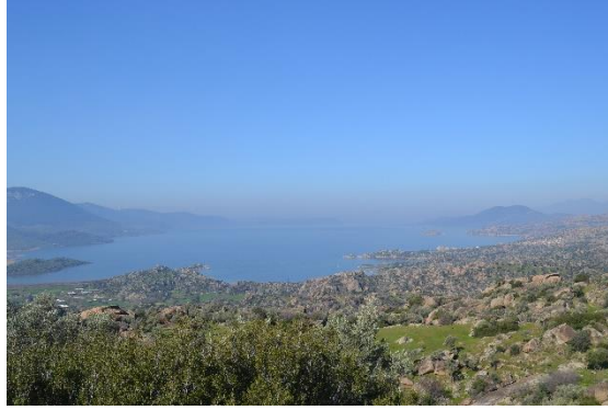
Resim 2. Latros Dağları'ndan Herakleia Gölü

Ulaşımı oldukça zor olan bu lavralar ve manastırlar, halk arasında günümüzde Latros'ta, “Arap Avlusu” olarak adlandırılan mevkide kurulmuştur. Herakleia Gölü'nden Latros Dağları'ndaki bu yaşam alanına/yapılara bakıldığında bunların görülmesi, eğer coğrafya bilinmiyor ise bulunması neredeyse imkânsızdır.