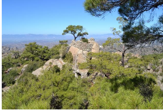
Resim 3. Aziz Stylos Manastırı