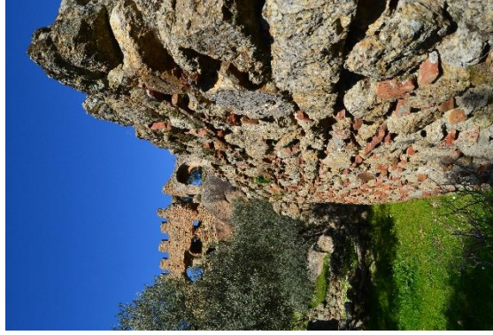
Resim 6. Kellibara Manastırı'nı Koruyan Sur Duvarı