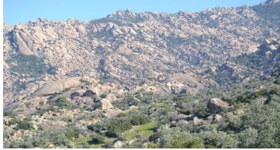
Resim 1. Latros Dağları Genel Görünüm

Türkiye'nin batı kıyısında yer alan ve Antik Miletos [Balat] kentinin hinterlandını oluşturan Latros [Beşparmak] Dağları, Antik Çağ'daki adı "Herakleia" olan Bafa Gölü'nün doğu kıyılarından dik bir şekilde yükselerek yaklaşık 1.400 m.'ye kadar ulaşmaktadır. Antik Çağ'da "Latmos" olarak bilinen bu bölge, Doğu Roma döneminde "Latros" olarak adlandırılmıştır. 38