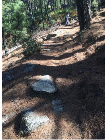
Resim 7. Latros'u Kuzey'den Güney'e Bağlayan Yol

Aleksiad'ın vermiş olduğu bu bilgi net şekilde hem Çaka hem Tangrıpermes hem de adları verilmeyen Türkmen beyleri ve onlara bağlı Türklerin karada ve denizde ciddi faaliyetler gösterdiklerini kanıtlamaktadır. Bu faaliyetlerinde Türkler sadece karadaki kaleleri ele geçirmemişler; aynı zamanda muhtemelen Adalar'da dâhil yereldeki unsurları da kullanarak donanma inşa ettirmişler ve var olan donanmalarını da güçlendirmişlerdir. 69 Böylece Ege Denizi'nde, Adalarda ve kıyılarında hiç şüphesiz daha güçlü bir konuma gelmişlerdir. Bu çerçevede Türk akıncılarının ilk başta karadaki faaliyetleri, çevreyi tanımak ve keşfetmek açısından önemli olup Ephesos'a yakın olan Latros'un hedef haline gelmesi de mümkündür. Nitekim Latros'a sadece güneyden değil kuzeyden de ulaşan bir yol mevcuttur ve bu detay kesinlikle atlanmaması gereken bir detaydır.