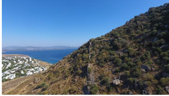
Resim 10. Aspat Kalesi Sur Duvarı

Nüfuzlu bir kişi olduğu anlaşılan ve Kos ve Leros adalarının dinî yönetimini üstlenen Skenourios tarafından yanındaki keşişlerle birlikte misafir edilen Christodoulos'a, Strabilos'ta bir manastır verilmesi bizzat Skenourios tarafından teklif edilmiş ancak Christodoulos, her an Strabilos'a da ulaşabilecek Türk saldırısı korkusu dolayısıyla bu teklife sıcak bakmamıştır. 81 Bunun üzerine Skenourios, Strabilos'a oldukça yakın ve kendi mülkleri de olan Kos Adası'na gitmesi, dolaşması ve inceleme yapması için Christodoulos'a ısrarcı olmuştur. Korkusunda oldukça haklı olan Christodoulos ve yanındakiler, bölgede Türk tehdidinin giderek büyümesi nedeniyle 82 Skenourios tarafından teknelerle Kos Adası'na geçirilmiştir. 83