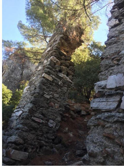
Resim 4. Stylos Manastırını Çevreleyen Sur Duvarı

Bu bilgilerden de anlaşılacağı üzere Christodoulos, Kudüs’ün Türkler tarafından ele geçirilmesinden sonra dinî önemi olan, kendisini güvende hissedebileceği ve istediği münzevi hayatı Türklerden oldukça uzakta yaşayabileceği Latros’a gelmiştir. Onun Latros’a gelmesinde, hiç şüphesiz Sina ve Raithou’dan kaçan azizlerin bu bölgeye yerleşmesi, kendisinin deyimiyle onlara olan sevgisi 59 , Aziz Stylos’un hayatı ve bölgenin dinî önemi etkili olmuştur. Kendi iradesiyle bölgeye yerleşen Christodoulos, Latros’a geldikten sonra Aziz Stylos’un ardından Latros’un en ünlü din adamı olmuştur. 60