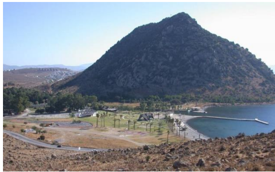
Resim 9. Strabilos (Aspat) Genel Görünüm