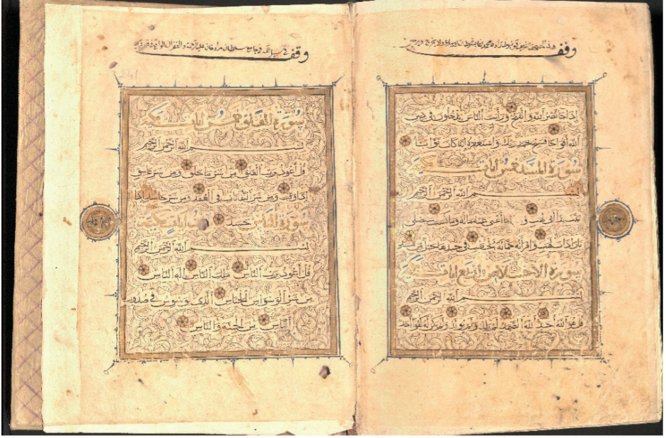
Resim 5: Kur'an, Memlük dönemi, ts, DİB 6342, y. 240b-241a.

DİB 6342 numaralı Kur'an-ı Kerim'de serlevha, zahriye ve son sayfalar dışında süsleme neredeyse yoktur. 16. yüzyıla kadar mushaflarda kenar cetveli standart bir uygulama olmadığı için bu mushafta da yazı alanı çevrelenmemiştir. 21 Süre başı tezhibi ve mushaf gülleri içermemektedir. Fakat her sûrenin başındaki bilgiler büyük boyutlu olarak altınla yazılmış ve kenarları siyah mürekkeple tahrirlenmiştir. Duraklar da altı dilimli nokta formundadır.