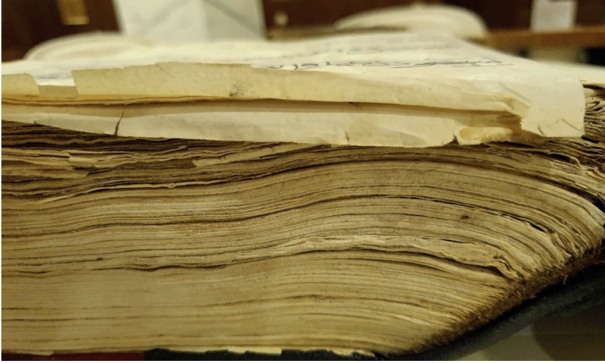
Resim 13: Kur'ân-ı Kerîm, Memlük dönemi, ts, Diyanet İşleri Başkanlığı Yazma Eserler Kütüphanesi, DİB 6565.

Eserin orijinal sayfaları krem renkli aharlı kâğıt üzerine 5 satır düzeninde muhakkak hatla yazılmıştır. Günümüze ulaşmış haliyle y. 1a'da Enbiyâ sûresi 17. âyetiyle başlayan eser y. 495a'da Nâs sûresiyle son bulmaktadır. Fakat mushaf muntazam bir sıraya sahip değildir. Eser dağıldıktan sonra yapılan restorasyonda yapraklar yanlış yerleştirilmiştir. Örneğin Enbiyâ sûresi 17. âyetiyle başlayan mushafta bu sûrenin başı hatalı olarak 69b yaprağına alınmıştır. Yeniden ciltlenmiş eserde üç ayrı kalem tespit edilmiştir (Tablo 1). Orijinal eserin hattatının ismi 495b'de bulunan ketebe kaydından öğrenilmektedir. Kayıtta şu ibarelere yer verilmiştir: