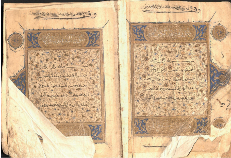
Resim 4: Kur'ân, Memlük dönemi, ts, DİB 6342, y. 2b-3a.

Serlevha tezhibi üç bölümlü sade bir tasarıma sahiptir. Alt ve üst yatay dikdörtgen alanlar sûrelerin isimleri, iniş yerleri ve âyet sayılarının yazıldığı kitâbe bölümü; orta alan ise âyetlerin yazıldığı ana bölümdür. Orta alanın zemini siyah renkli dikey çizgilerle taranmıştır. Yazı satırının dışında kalan yerler (beynessütur) altın ve lacivert renkli sarmal rûmîlerin oluşturduğu helezonik tasarımla süslenmiştir. Alt ve üst paftalarda yazılı alan dış çerçeveye bitişik ikişer kavisli çizgi arasına alınmıştır. Altın zeminli bu alan üzerine beyaz mürekkeple sûre hakkında bilgiler yazılmıştır. Lacivert zeminli geri kalan yerler altın renkli rûmîlerle süslenmiştir. Sayfa kenarlarına üç adet serlevha gülü yerleştirilmiştir. Alt ve üstteki madalyon biçimli küçük boyutlu güllerin altın zeminli iç kısımları lacivert rûmîlerle, ortadaki cetvele bitişik iri gülün lacivert zeminiyse altın rûmîlerle bezenmiştir. Serlevhada zencerek uygulanmamış, bordür sadece altınla boyanmıştır. Bordür lacivert renkli tığlarla çevrelenmiştir (Resim 4).