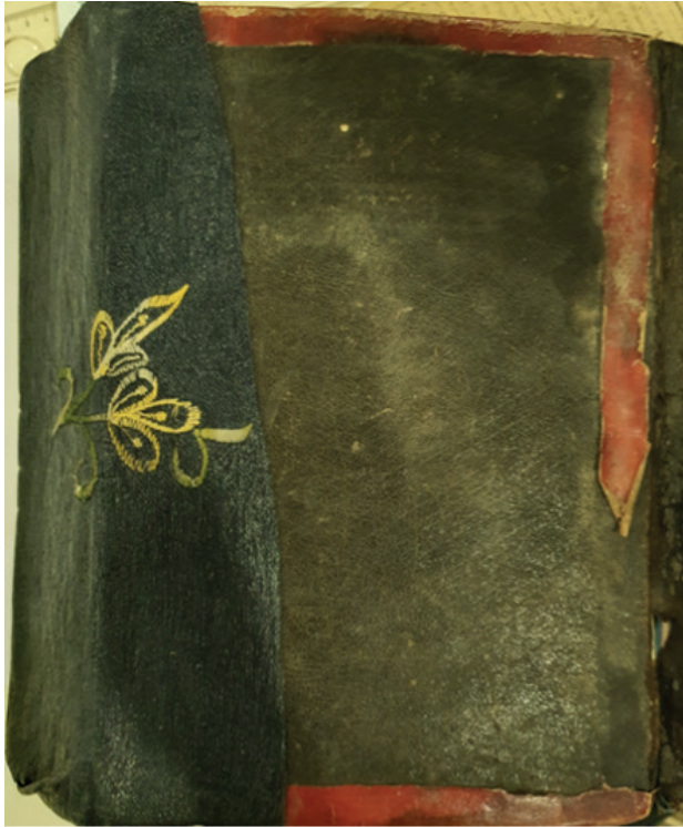
Resim 12: Kur'an-ı Kerim cildi, Memlük dönemi, ts, Diyanet İşleri Başkanlığı Yazma Eserler Kütüphanesi, DİB 6565.

Diyanet İşleri Başkanlığı Merkez Kütüphanesi'nde 749 numaralı mushaf, 320 x 230 mm ölçülerinde toplam 495 varaktır. Eserin kondisyonu iyi değildir. Orijinal cilt günümüze ulaşmamış, ön kapak ve sırt kısmı bez ciltle kaplanmıştır (Resim 12, 13). Eserin muhtelif yerlerinde kopukluklar, rutubet lekeleri mevcuttur. Cildin dağılmasından dolayı mushafın sayfaları tekrar bir araya getirilmiştir. Mushafın orijinal sayfalarında eksiklikler mevcut olup kimi sayfalar tekrar yazılmıştır.