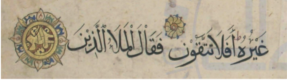
Resim 11: Kur'an-ı Kerim, Memlük dönemi, ts, DİB 749, y. 5a.