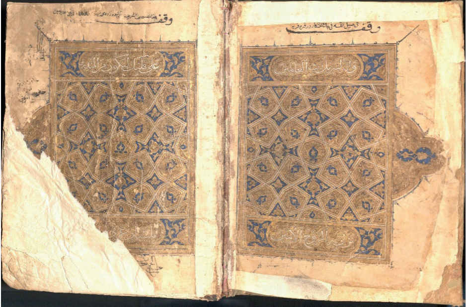
Resim 3: Kur'ân-ı Kerîm, Memlûk dönemi, ts, DİB 6342, y. 1b-2a.

Eser çift sayfa zahriye ile çift sayfa serlevhaya sahiptir. 1b-2a'da zahriye ile 2b-3a'da serlevha yer almaktadır. Zahriye tezhibi üç bölümden oluşmaktadır. Yazıların bulunduğu alt ve üst paftaların tasarımı serlevha ile aynıdır. İki kavisli çizgi arasına alınmış altın zeminli kitâbe kısımlarına sağ üstten başlamak üzere üstübeç mürekkebiyle Şuarâ sûresi 192-195 âyetleri yazılmıştır (y. 1b-2a). Orta alandaysa birbirini kesen çizgilerden oluşan girift bir geometrik tasarım uygulanmıştır. Çizgilerin aralarında oluşan şekillerin bir bölümü altın zeminli geri kalanı lacivert zeminlidir. Altın zeminler lacivert; lacivert zeminler altın rûmîlerle süslenerek kontrast sağlanmıştır. Sayfa ortasına yatay olarak yerleştirilen altın ve lacivert zeminli gül motifinde de aynı tasarım uygulanmıştır (Resim 3).