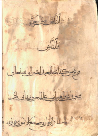
Resim 14: Kur'ân-ı Kerîm, Memlûk dönemi, ts, Diyanet İşleri Başkanlığı Yazma Eserler Kütüphanesi, DİB 6565, y. 495b.

Ketebe kaydı hattat dışında kesin bir bilgi içermemektedir. Buna göre eser Kânibay ünvanlı bir hattat tarafından yazılmıştır. Tarih verilmeyen kayıta hattatın Emevi Camii ile olan ilgisi de yazının silik olmasından dolayı anlaşılmamaktadır. Eserin yeniden düzenlenmesiyle ilave edilen sayfalarda yazım hataları yapıldığı tespit edilmiştir. Örneğin Y. 53b'de yazılan satırın üstü çizilmiş altına düzeltilmiş hali yazılmıştır. Ayrıca y. 70b'de Enbiya sûresi'nin dördüncü âyetinin başlangıcı hatalı biçimde emir kipiyle “قل” yazılmıştır.