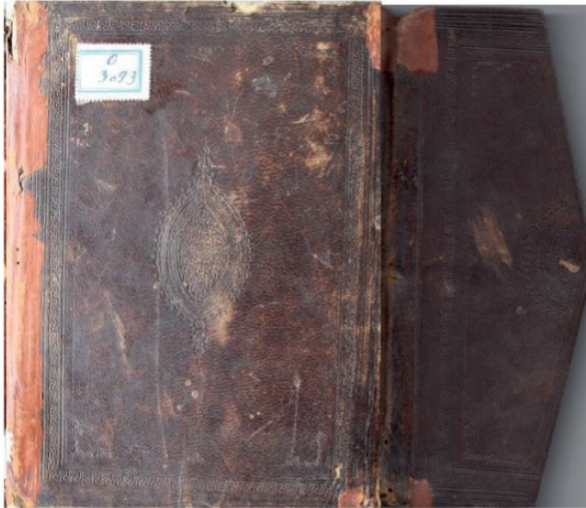
Resim 7: Kur'an cildi, 15. yy., Kastamonu İl Halk Kütüphanesi, KİHK 3093, (Küçük, 2018, s. 146).