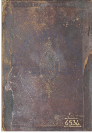
Resim 6: Kur'an cildi, Memlük dönemi, ts, Diyanet İşleri Başkanlığı Yazma Eserler Kütüphanesi, DİB 749.

birleşerek uzanır. Aynı zincir motifinin cildin kenar bordüründe de uygulandığı görülmektedir. İç kısımlarının girift örgü, zincir veya çeşitli yıldız motifleriyle doldurulduğu koyu kahverengi veya kestane renkli sade tasarımlı ciltlere Selçuklu, İlhanlı ve Memlük coğrafyasında 13. yüzyıldan 15. yüzyıl sonuna kadar rastlanmaktadır (Resim 6, 7, 8). 22