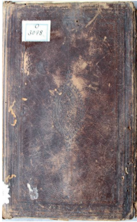
Resim 8: Kur'ân-ı Kerîm cildi, 15. yy., Kastamonu İl Halk Kütüphanesi, KİHK 3078, (Küçük, 2018, s. 143)

Kur'ân-ı Kerîm krem renkli aharlı kâğıt üzerine siyah mürekkep ile muhakkak hatla ve 5 satır düzeninde yazılmıştır. Sûre başları ve zahriye sayfasındaki yazılar ise sülüs hatla ve altın mürekkeple yazılmıştır. Durak işaretlerinde kırmızı ve mavi mürekkep kullanılmıştır. Sanatçıya dair bir kayıt bulunmamasına karşın yazının niteliğinden mushafın yetkin bir ustanın elinden çıktığı anlaşılmaktadır.