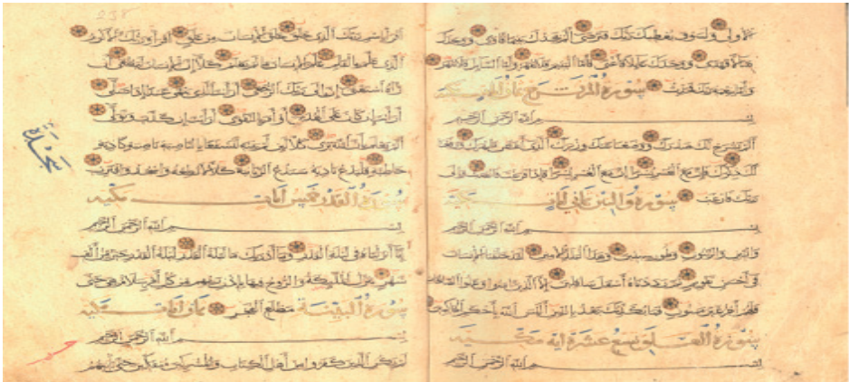
Resim 2: Kur'ân-ı Kerîm, Memlûk dönemi, ts, DİB 6342, y. 237b-238a.

Eserde filigransız nohudi renk aharlı kâğıt kullanılmıştır. Dönemin geleneğine bağlı kalınarak reyhânî hatla siyah mürekkeple yazılmıştır. Serlevha ve zahriye sayfasındaki alt ve üst kartuşların içerisindeki yazılarda ise sülüs hat tercih edilmiştir. Beyaz renk mürekkeple yazılan bu satırlardaki harflerin kenarları siyah mürekkeple tahrirlenmiştir. Sûre başları da sülüs hatla yazılmış fakat buralarda altın mürekkep kullanılmıştır. Mushafın farklı yerlerindeki tecvitle ilgili bilgilendirmeler kelimenin hemen altına kırmızı mürekkeple yazılmıştır. Ayrıca tecvîd remzlerinin tamamı yine kırmızı mürekkeple gösterilmiştir. Secde âyetlerinin olduğu satırın kenarına sülüs hatla mavi mürekkeple “secde” kelimesi yazılmıştır (Resim 2).