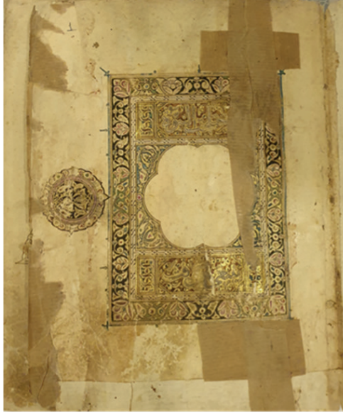
Resim 9: Kur'ân, Memlük dönemi, ts, DİB 749, y. 1b.

Eserin y. 2a'deki ilk sûre başı tezhiplenmiştir. Yazı alanı üçe ayrılmış olan yatay dikdörtgenin orta kısmı kırmızı, diğer iki alan ise yeşil renkle boyanmıştır. Bu alanlara sülüs hatla cüz numarası, sûre ismi ve âyet sayısı yazılmıştır. Sülüs hattın çevresi altınla bezenmiş ve kalan boşluklar rûmî motifleriyle doldurulmuştur (Resim 10). Y. 21a'daki Nûr sûresi ile y. 45b'deki Furkan sûresinin başı çevrelenmemiştir. Altın renkli muhakkak hatla sûre bilgileri yazılmış ve harflerin kenarları siyah mürekkeple tahrirlenmiştir. Beyzi ve daire formunda tasarlanan güllerin iç kısımları altınla bezenmiş, dışı ise farklı renkli damla motifleriyle çevrelenmiştir. Hizb güllerinin numaraları altın zemin üzerine kûfi hatla yazılmıştır. Âyet duraklarında çarkıfelek motifi tercih edilmiştir (Resim 11).