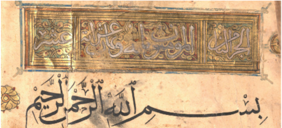
Resim 10: Kur'an-ı Kerim, Memlük dönemi, ts, DİB 749, y. 2a.

Eserin y. 2a'deki ilk sûre başı tezhiplenmiştir. Yazı alanı üçe ayrılmış olan yatay dikdörtgenin orta kısmı kırmızı, diğer iki alan ise yeşil renkle boyanmıştır. Bu alanlara sülüs hatla cüz numarası, sûre ismi ve âyet sayısı yazılmıştır. Sülüs hattın çevresi altınla bezenmiş ve kalan boşluklar rûmî motifleriyle doldurulmuştur (Resim 10). Y. 21a'daki Nûr sûresi ile y. 45b'deki Furkan sûresinin başı çevrelenmemiştir. Altın renkli muhakkak hatla sûre bilgileri yazılmış ve harflerin kenarları siyah mürekkeple tahrirlenmiştir. Beyzi ve daire formunda tasarlanan güllerin iç kısımları altınla bezenmiş, dışı ise farklı renkli damla motifleriyle çevrelenmiştir. Hizb güllerinin numaraları altın zemin üzerine kûfi hatla yazılmıştır. Âyet duraklarında çarkıfelek motifi tercih edilmiştir (Resim 11).