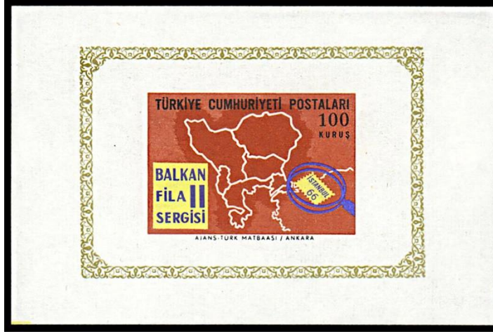
Görsel 4. Balkan Haritası kompozisyonu 75x50 mm, (Pulhane, 1966b)

Görsel 5'te 03.09.1966'da tedavüle çıkartılan ve Balkanfila II konulu çalışmayı oluşturan 1,85 ETL bedelli bir ilk gün zarfı ile ilk gün damgasına yer verilmiştir. İlgili tarihte dolaşıma çıkartılan ilk gün zarfı Kamer Pul Evi tarafından hazırlanmıştır. Ayrıca 1953-1980 yılları arasında, PTT haricinde birçok firma tarafından da ilk gün zarfları hazırlanmıştır (Fotokart, 1966; Pulhane, 1966a).