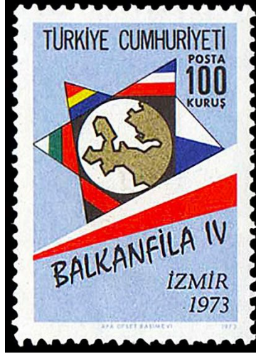
Görsel 8. Balkanfila IV Tanıtım Pulu 26x36 mm, (Pulhane, 1973b)

altına Balkanfila IV ibaresi, sağ alt kısma kalan alana İzmir 1973 tümcesi, alt kısımdaki marj alanına ise pulun künyesi konumlandırılmıştır.