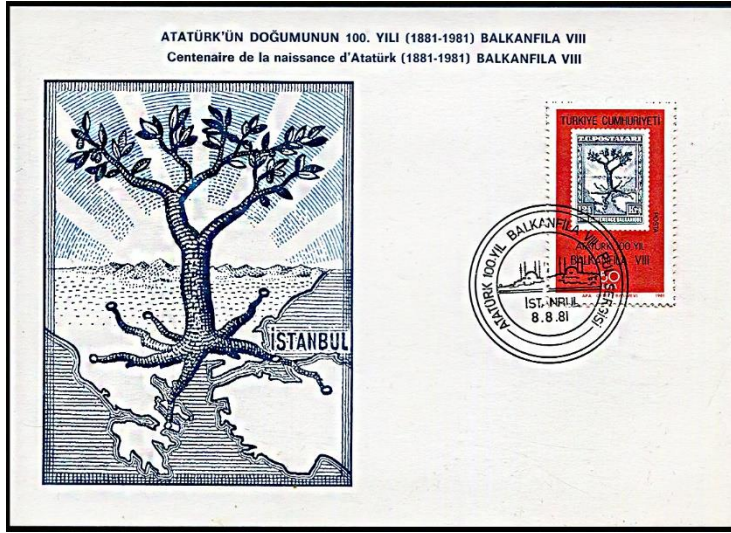
Görsel 13. Balkanfila VIII Pul Sergisi Konulu Maksimum Kartlar 148x105 mm, (Pulhane, 1981b)