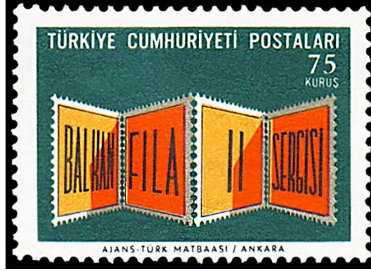
Görsel 3. Pul Paravani Temalı Tasarım 36x26 mm, (Pulhane, 1966a)

Görsel 4'te 03.09.1966'da tedavüle çıkartılan ve BALKANFİLA II Balkan Ülkeleri Pul Sergisi konulu çalışmayı oluşturan tek değerli dantelsiz pullu anma bloku serisindeki pula yer verilmiştir. Baskı sayısı 150.000 olan pullar ofset baskı yöntemiyle dört renkli olarak bastırılmıştır (Pulhane, 1966b). Yatay bir kompozisyona sahip olan bu tasarımda altın orana Balkan Haritası kompozisyonu konumlandırılmıştır. Vişneçürüğü rengindeki bir zemin üzerine beyaz renkli bir boya ile çizilen Balkan haritası, koyulaştırılan bir renk tonu ile belirgin hale getirilmiştir. Türkiye'nin haritadaki görünürlüğü için üzerinde İstanbul 66 yazılı sarı renkli bir pul şablonu kullanılmış ve mavi çerçevesiyle yakınlaştırmaya çalışılmıştır. Renkli alanın üst kısmına büyük harflerle Türkiye Cumhuriyeti Postaları ifadesi, hemen altındaki satırın sağına ise pulun değer ibaresi yerleştirilmiştir. Organizasyonun vurgusunu arttırmak için sol alt kısımdaki sarı zemin üzerine Balkanfila II Sergisi ifadesi işlenmiştir. Pulun künyesini gösteren metin ise alt kısımda kalan marj alanına konumlandırılmış ve tasarımın çevresi açık sarı renkli bir çerçeve yardımıyla belirginleştirilmiştir.