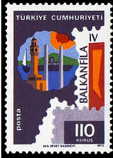
Görsel 6. Balkanfila IV İzmir 26x36 mm, (Pulhane, 1973a)

Görsel 6'da 26.09.1973'te tedavüle çıkartılan ve BALKANFİLA IV Balkan Ülkeleri Pul Sergisi-İzmir 1973 konulu çalışmayı oluşturan 2 serilik anma pullarından birine yer verilmiştir. Baskı sayısı 400.000 olan pullar 50'li tabakalar halinde bastırılmıştır. Ofset baskı yöntemi kullanılarak baskıya çıkartılan pulların grafik tasarımını Sümer Mumcu yapmıştır (Pulhane, 1973a). Dikey bir formata sahip olan bu tasarımda dairesel bir pencere motifi kullanılmıştır. Mor zemin üzerine yerleştirilen açıklığa denizde seyreden bir gemi, İzmir Saat Kulesi ve güneş motifi eklenmiştir. İllüstratif öğelerin etkin olarak kullanıldığı bu tasarımın üst kısmına büyük harflerle Türkiye Cumhuriyeti ifadesi, hemen sağına aşağıdan yukarıya doğru dikey bir biçimde Balkanfila IV tümcesi, sağ alt kısma pulun değeri, sol alt kısma posta ibaresi, alt kısımdaki marj alanına ise pulun künyesi konumlandırılmıştır.