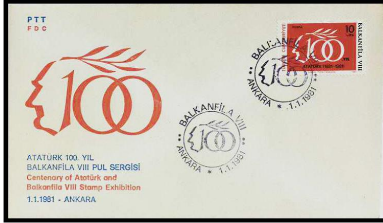
Görsel 12. Balkanfila VIII Pul Sergisi Konulu İlk Gün Zarfı ile İlk Gün Damgası, (Pulhane, 1981b)

Görsel 12’de 1981’de tedavüle çıkartılan ve Atatürk'ün Doğumunun 100. Yılı-Balkanfila VIII Pul Sergisi konulu çalışmayı oluşturan 105,00 ETL bedelli bir ilk gün zarfı ile ilk gün damgasına yer verilmiştir. İlgili tarihte dolaşıma çıkartılan zarflarda PTT logosunu kullanılmaya başlanmıştır (Pulhane, 1981b).