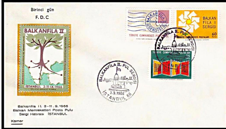
Görsel 5. Balkanfila II Konulu İlk Gün Zarfı ile İlk Gün Damgası, (Fotokart, 1966)

Görsel 5'te 03.09.1966'da tedavüle çıkartılan ve Balkanfila II konulu çalışmayı oluşturan 1,85 ETL bedelli bir ilk gün zarfı ile ilk gün damgasına yer verilmiştir. İlgili tarihte dolaşıma çıkartılan ilk gün zarfı Kamer Pul Evi tarafından hazırlanmıştır. Ayrıca 1953-1980 yılları arasında, PTT haricinde birçok firma tarafından da ilk gün zarfları hazırlanmıştır (Fotokart, 1966; Pulhane, 1966a).