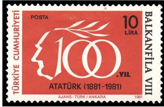
Görsel 10. Balkanfila VIII Tanıtım Pulu 41x26 mm, (Pulhane, 1981a)

Görsel 11’de 01.01.1981’de tedavüle çıkartılan ve Atatürk’ün Doğumunun 100. Yılı- Balkanfila VIII Pul Sergisi konulu çalışmayı oluşturan 2’li anma blokuna yer verilmiştir. Baskı sayısı 500.000 olan bu pul, 2 puldan oluşan bir seri halinde bastırılmıştır. Ofset baskı yöntemi kullanılarak baskıya çıkartılan bu pulun grafik tasarımcısı açıklanmamıştır (Pulhane, 1981b). Yatay bir formata sahip olan bu tasarımda altın orana Yurtta Sulh Cihanda Sulh ifadesi yerleştirilmiştir. Soldaki pulda Atatürk’ün sağ profilden bir betimlemesi doğrudan kullanılmış iken sağdaki pulda ise kökleriyle İstanbul’u Balkan ülkelerinin başkentlerine bağlayan bir zeytin ağacı motifi kullanılmıştır.