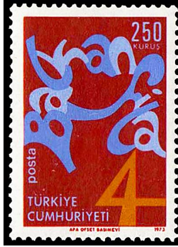
Görsel 7. Balkanfila 4 26x36 mm, (Pulhane, 1973a)

Görsel 7’de 26.09.1973’te tedavüle ıkartılan ve BALKANFİLA IV Balkan Ülkeleri Pul Sergisi-İzmir 1973 konulu alıřmayı oluřturan 2 serilik anma pullarından diđerine yer verilmiřtir. Dikey bir formata sahip olan bu tasarımda Balkanfila ifadesi dairesel olarak tasarımın üst kısmındaki \frac{3}{4} ’lük alana gelecek biçimde yerleřtirilmiřtir. Bordo zemin üzerine yerleřtirilen Balkanfila ifadesindeki her bir harf yine ardıřık olarak koyu ve aık mavi renk tonuna boyanmıřtır. Sembollere yer verilmeyen bu tasarımın sađ üst kısmına pulun deđerini, sol alt kısımda kalan \frac{1}{2} ‘lik alana ařađıdan yukarıya dođru dikey bir biçimde posta ifadesi, sol alt kısma büyük harflerle Türkiye Cumhuriyeti ibaresi, sađ alt kısma ise dođrudan 4 rakamı yerleřtirilmiřtir. Ayrıca alt kısımdaki marj alanına kırmızı renklerle pulun künyesi ve yıl ifadesi yazılmıřtır.