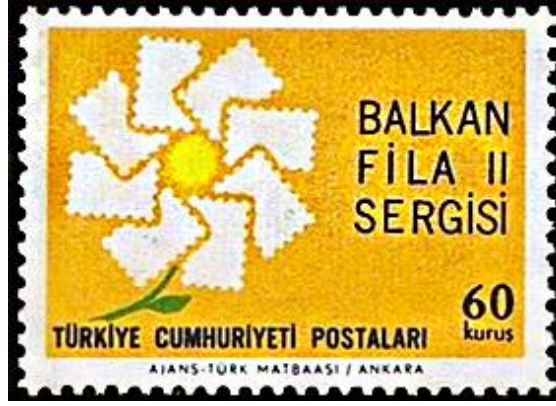
Görsel 2. Pul Çiçeği Kompozisyonu 36x26 mm, (Pulhane, 1966a)

değer ifadesi yerleştirilmiştir. Pulun künyesini gösteren metin ise alt kısımda kalan marj alanına konumlandırılmıştır.