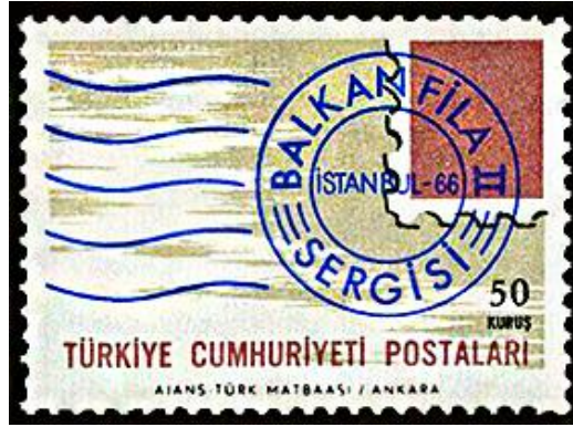
Görsel 1. Damgalı Pul Kompozisyonu 36x26 mm, (Pulhane, 1966a)

Görsel 1’de 03.09.1966’da tedavüle çıkartılan ve BALKANFİLA II Balkan Ülkeleri Pul Sergisi konulu çalışmayı oluşturan 3 serilik anma pullarından birine yer verilmiştir. Baskı sayısı 200.000 olan pullar 50’li tabakalar halinde; 1.000.000 adet 0,50 kuruş , 500.000 adet 0,60 kuruş ve 200.000 adet 0,75 kuruş olacak biçimde bastırılmıştır. Ofset baskı yöntemi kullanılarak baskıya çıkartılan pulların grafik tasarımcıları ise Bader Kocamanoğlu, Burhan Özak ve Turhan Damlacı’dır (Pulhane, 1966a). Yatay bir formata sahip olan bu tasarımda damgalı pul kompozisyonu tema olarak kullanılmıştır. Haki zemin üzerine yerleştirilen vişneçürüğü renkli pul şablonunun iptali, flam uygulamasıyla sağlanmıştır. İptal damgası olarak kullanılan baskının daire halkasına Balkanfila II Sergisi , içerisine ise İstanbul-66 ifadeleri yerleştirilmiştir. İllüstratif öğelerin etkin olarak kullanıldığı bu tasarımın alt kısmına büyük harflerle Türkiye Cumhuriyeti Postaları ifadesi, hemen üstündeki satırın sağına pulun değer ibaresi, degradeli bir biçimde hâki renk tonundan beyaz renk tonuna dönüşen alt kısımdaki marj alanına ise pulun künyesi konumlandırılmıştır.