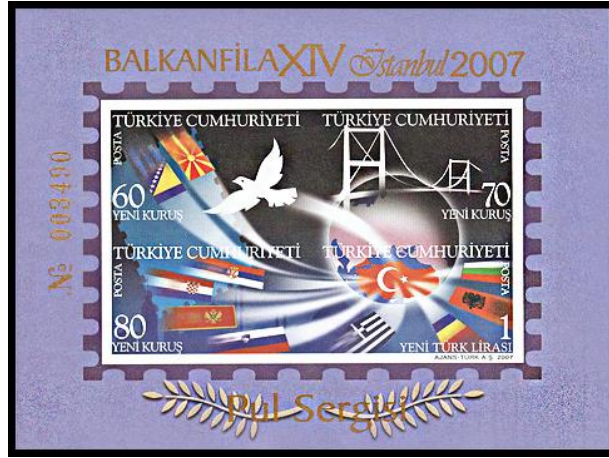
Görsel 15. Balkanfila XIV Pul Sergisi Seri Numaralı Dantelsiz Anma Bloku 116x86 mm, (Pulhane, 2007)

Görsel 16’da 28.10.2007’da tedavüle çıkartılan ve BALKANFİLA XIV Pul Sergisi konulu çalışmayı oluşturan 3,35 YTL bedelli bir ilk gün zarfı ile ilk gün damgasına yer verilmiştir (Pulhane, 2007). Yatay bir formata sahip olan bu tasarımın sağ üst kısmına Balkanfila XIV Pul Sergisi anısına bastırılan dantelli anma bloku, soluna ise kırmızı renk tonuyla belirginleştirilen Balkan haritası ve gagasında zeytin dalı taşıyan bir güvercin betimlemesi yerleştirilmiştir.