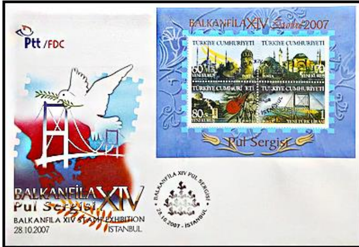
Görsel 16. Balkanfila XIV Pul Sergisi Konulu İlk Gün Zarfı ile İlk Gün Damgası 210x140 mm, (Pulhane, 2007)

Görsel 16’da 28.10.2007’da tedavüle çıkartılan ve BALKANFİLA XIV Pul Sergisi konulu çalışmayı oluşturan 3,35 YTL bedelli bir ilk gün zarfı ile ilk gün damgasına yer verilmiştir (Pulhane, 2007). Yatay bir formata sahip olan bu tasarımın sağ üst kısmına Balkanfila XIV Pul Sergisi anısına bastırılan dantelli anma bloku, soluna ise kırmızı renk tonuyla belirginleştirilen Balkan haritası ve gagasında zeytin dalı taşıyan bir güvercin betimlemesi yerleştirilmiştir.