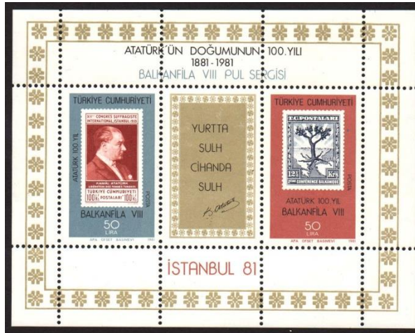
Görsel 11. Balkanfila VIII Pul Sergisi 104x81 mm, (Pulhane, 1981b)

Görsel 11’de 01.01.1981’de tedavüle çıkartılan ve Atatürk’ün Doğumunun 100. Yılı- Balkanfila VIII Pul Sergisi konulu çalışmayı oluşturan 2’li anma blokuna yer verilmiştir. Baskı sayısı 500.000 olan bu pul, 2 puldan oluşan bir seri halinde bastırılmıştır. Ofset baskı yöntemi kullanılarak baskıya çıkartılan bu pulun grafik tasarımcısı açıklanmamıştır (Pulhane, 1981b). Yatay bir formata sahip olan bu tasarımda altın orana Yurtta Sulh Cihanda Sulh ifadesi yerleştirilmiştir. Soldaki pulda Atatürk’ün sağ profilden bir betimlemesi doğrudan kullanılmış iken sağdaki pulda ise kökleriyle İstanbul’u Balkan ülkelerinin başkentlerine bağlayan bir zeytin ağacı motifi kullanılmıştır.