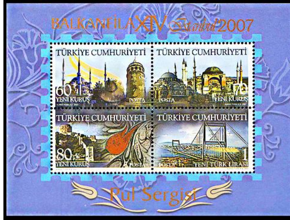
Görsel 14. Balkanfila XIV Pul Sergisi Anma Bloku 116x86 mm, (Pulhane, 2007)

pulda Rumeli Hisarı ve lale motifi , 1,00 YTL bedelli pulda ise Boğaziçi Köprüsü 'nün görsel olarak kullanıldığı görülmektedir.