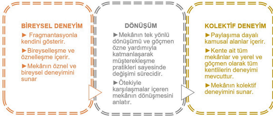
Görsel 6. Yeni-göçmenin mekân pratiğinin açılımı: bireyselden kolektife mekân deneyiminin dönüşümü

Jacques Ranciere’den aktaran Stavrides, “deneyimleri” ve “entelektüel maceraları”, tercüme etme biçimlerinin keşfedilmesinin ve böylelikle de bireysel güzergâhlar arasında kesişimler yaratılmasının her daim gerekli olduğunu ve göçmenlerin, birer müşterek olarak toplumsal mutfaklara, ancak bu tür tercüme üzerinde çalışıldığında, katılabildiğini belirtir (Ranciere, 2009: 11; Stavrides, 2018: 53). Rosi Braidotti’nin, aktif ve sürekli, kontrol altındaki sürat olarak tanımladığı göçebe güzergâh atfından hareketle (1994: 86), bireysel güzergâhların hızlı bir oluş içinde iç içe geçtiği bir aşda göçmenin varlığı deneyimi ve macerayı zenginleştirir. Döngüsel tanışıklıklarla ilerleyen bu kesişimlerde göçmen kültürleri, kolektif olarak işlenen yeni bir tarlaya verimli şekilde ekilebilecek önemli müşterekleşme tohumlarını kendi içlerinde barındırır (Stavrides, 2018: 53). Kamusal alanlarda, belirli sosyal alanlarda, paylaşımlı yaşam alanlarında veya çok kullanıcı konut alanlarında göçmen bireyin müşterekleşmeye olan katkısı önemli hale gelir. Yeni-göçmen, yerleşik bir düzende hayatını sürdüren bireye kıyasla mekân deneyimini dönüştürme gücüne sahip bir özne olarak karşımıza çıkar. Görsel 6’da yeni-göçmenin bireyselden kolektife mekân deneyiminin dönüşümü detaylı olarak açıklanmıştır: