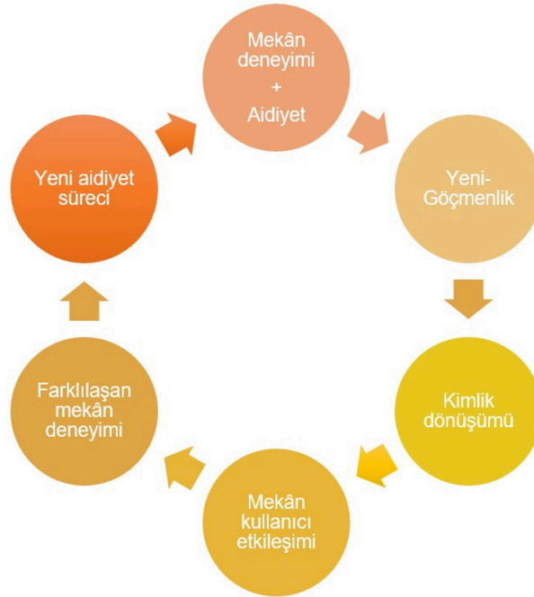
Görsel 5. Yeni göçmenin mekân aidiyeti dönüşümü şeması

Bu yaklaşımla, göçmenlik zamansal olarak bir ara durumu ve mekânsal olarak sürekli oluş halini ifade eder. Modern göçmenin durmaktan çok hareket halindeki varoluşunun zaman içindeki varlığını da kavranılması ve sabitlenmesi zor bir hale getirir. Bu bireylerin zaman içindeki deneyimi ise oluş ve yok oluş ekseninde sürekli bir döngü halini almıştır. Sabitliğe tezat şekilde göçmenin bulunduğu yerle ilişkisi akışkan, devinimsel ve dinamiktir. Sınırsız ve ufuksuzdur, aynı zamanda bir varış noktası içermediğinden andaki varlığı önceleyen bir yapısı vardır. Bu yapı kaçınılmaz olarak hem zamanı hem de eylemi gerçekleştiren kesin bir şekilde ortaya koyar fakat hiçbirinin kesin bir tanımını yapabilmeyi mümkün kalmaz. Bu göçebe düşüncenin ve göçmenliğin zaman-mekânla ilişkisinin paradoksudur denebilir. Her an tanık olunabilir fakat sınırlanamaz, deneyimlenebilir fakat belirli bir mekâna hapsedilemez. Zamanla oluşur fakat şimdide başlayarak ilerleyen geniş bir zamanı içerdiğinden tam olarak zamanı kestirilemez.