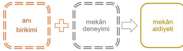
Görsel 3. Anı birikimi ve deneyim sürekliliği ile mekânda aidiyet olgusu

Pasajların güzergâhın üzerindeki geçit fizyolojisine benzer şekilde göçmenin mekândaki varoluşu zaman içinde sabitlenerek bir eve dönüşebilir. Flanörün kendisini Paris pasajlarında evinde hissetmesine benzer şekilde de bu güzergâhın kendisinde (var oluşunda) aidiyetten söz etmek mümkün hale gelir. Bir güzergâhta -fakat özellikle varış noktasının reddine dayanan bir yol olarak güzergâhta- aidiyet sürekli kurulan bir kurgudur. Flanörün kentte göçmenlerin deneyimine benzer şekilde yol aldığını, adım üzerine adım atarak aidiyetini, kimliğini ve hafızasını oluşturduğunu anlamak gerekir. Modern göçmenin, yeni-göçmenin evi de flanörün evi gibi, henüz oluşurken yok olur fakat her zaman -somut olarak algılanmasa da- varlığını sürdürür. Yeni-göçmenler geleneksel göçebelere benzer şekilde, belirli süre anılarına ev sahipliği yapmış olan geride bırakılan evlerine ait anıları belleklerinde tutar fakat tam da bu hafızadaki ev ile oluşmakta olan ev iç içe geçerek ve birbirlerini etkileyerek varlık bulur. Hafızanın ve deneyimin sürekliliği aidiyeti sürekli kurar (Görsel 3). Eve dair anlam hem geçmişte olanın "hafızadaki" evin, hem de şimdide olanın "oluşmakta olan" evin birlikteliğiyle ortaya çıkmaya başlar.