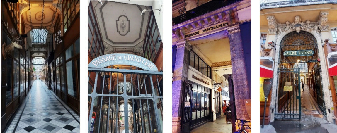
Görsel 2. Paris pasajlarının geçit kurgulu mekânsal düzeni

Pasajlar caddeyle iç mekân (interieur) arası bir şeydir. Physiologie'lerin bir becerisinden söz etmek gerekirse eğer, bu, tefrikanın değeri daha önce anlaşılacak olan becerisidir; yani bulvarı iç mekâna dönüştürme becerisidir. Cadde, Flâneur için konuta dönüşür; sokaktaki adam, dört duvarının arasında nasıl evinde olduğunu duyumsarsa, Flâneur de bina cepeleri arasında kendini evindeymiş gibi duyumsar. (Benjamin, 2002: 131)