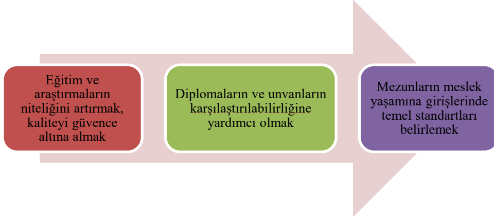
Őekil 1. Akreditasyonun Temel Amaçları

Akredite olmak bir kurum veya program için önemlidir. Çünkü akredite olmuş bir kurum veya programının verdiği eğitim hizmetlerinin akredite olmayan eşdeğer programlara göre daha sistematik ve izlenebilir süreçlere göre yürütüldüđü düşün¼l¼r. Bu durum kurum ya da programın kamuoyunda saygınlıđını artırır ve programın tercih edilmesine sebep olabilir. Örneđin YÖKAK tarafından tescillenmiş akreditasyon kuruluşları tarafından akredite edilmiş programların bilgileri YÖKAK tarafından izlenmekte ve program bilgileri Yükseköđretim Kurulu Başkanlıđına (YÖK) iletilmektedir. YÖK aracılıđı ile 2016 yılından itibaren akredite program bilgileri Yükseköđretim Kurumları Sınavı (YKS) Yükseköđretim Programları ve Kontenjanları Kılavuzunda yayımlanmaktadır. Buna ilaveten akreditasyonun kurum ve programlara pek çok yararı bulunmaktadır. Bunlar Őekil 2'deki gibi özetlenebilir (Sarp, 2014):