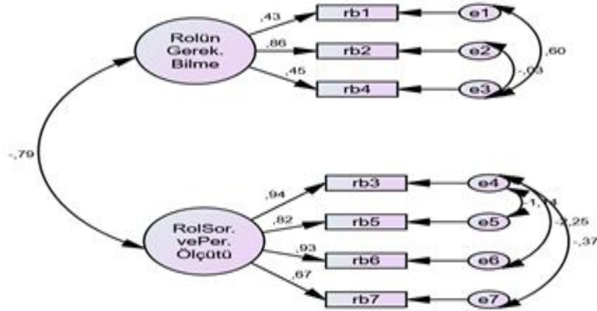
Şekil 2. Rol Belirsizliği Ölçeğine Ait Doğrulayıcı Faktör Analizi Sonuçları

Rol Belirsizliği Ölçeğine Ait Doğrulayıcı Faktör Analizi(DFA) Sonuçları ve Yol Haritasına aşağıda yer verilmiştir.