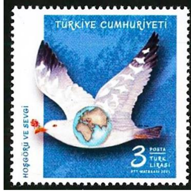
Şekil 7: Hoşgörü ve Sevgi, Nurgül Özkeser, 2021, 38 x 38 mm.

Posta ücretlerinin ödenmesi amacıyla fazla sayıda bastırılan pullardır (Filateli, 2016).