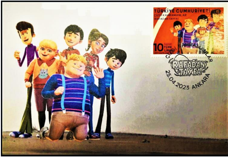
Şekil 13: Rafadan Tayfa Çizgi Film Karakterleri, 2023.

Üzerindeki pul baskısı ile aynı konuda tasarıma sahip olan damgalanmış kartlardır (Filateli, 2016; PTT, 2020a, s. 3; PTT Anonim Şirketi, 2014, s. 527).