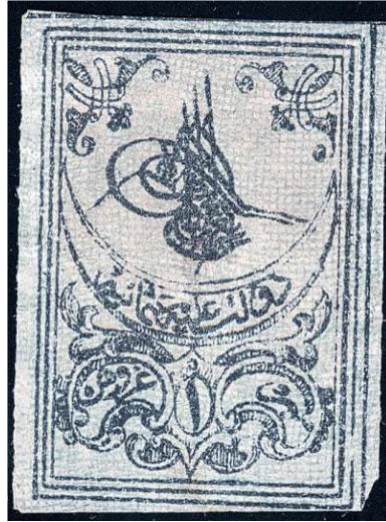
Şekil 3: İlk Osmanlı Pul Tuğralı Pul 2. Baskı 1 Kuruş.

Filateli konulu çalışmaların günümüzde daha işlevsel hale geldiğini söylemek mümkündür. Bunda özellikle dernek ve koleksiyonerler tarafından organize edilen sergilerin etkisi olduğu söylenebilir. Posta ve Telgraf Teşkilatı Anonim Şirketi'nin kontrolünde ilerletilen ulusal ve uluslararası sergiler ile filatelik tanıtımlar, emisyon programları, pul müzesi faaliyetleri ve Dünya Posta Birliği (UPU) İdari Konsey toplantısı ise daha çok filateli ile ilgili uygulamaların nihai hedefleri üzerinde belirleyici olmaktadır.