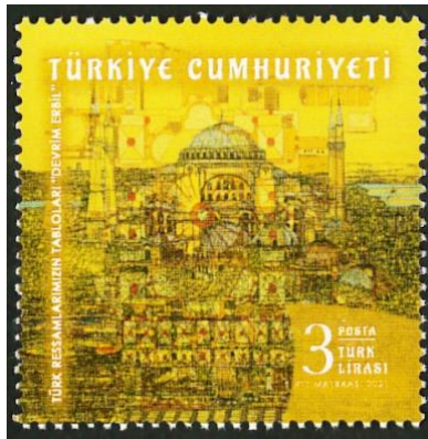
Şekil 4: Türk Ressamlarımızın Tabloları, Devrim Erbil, 2021, 38 x 38 mm.

Bir olayı, konuyu, kişiyi veya kişileri anmak amacıyla bastırılan pullardır (PTT, 2020a, s. 3).