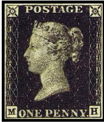
Şekil 2: Penny Black.

Kabine toplantısında şahit olduğu olayı anlatan Rowland Hill, posta hizmetlerinin göreceği zararı asgariye indirmek amacıyla yeni bir sistem önerisinde bulundu. Buna göre posta ücreti göndericisinden peşin tahsil edilecek ve ücretin alındığını gösteren küçük resimli bir kâğıt zarfa yapıştırılacaktı. Çünkü yeni sistem hem devlete peşin tahsil avantajı sağlıyor hem de mevcut hizmetin mutlak suretle yerine getirilme sorumluluğunu yükliyordu. Uzunca süre tartışılan öneri kabul edildi ve 6 Mayıs 1840 tarihinde uygulamaya konuldu. Buna göre biri siyah renkli 1 penny değerinde diğeri ise mavi renkli ve 2 penny değerinde olan ilk pullar İngiltere'de tedavüle çıkarıldı. Pulların üzerinde, Kraliçe Victoria'nın Hollandalı ressam Villiam Mulready'a çizdirdiği resmi yer almaktaydı. Pulların tasarım ve klişeleri ise Charles ve Frederic Heat adlarındaki baba-oğul iki hattat tarafından hazırlandı. 12x20 adetlik 240'lık, telsiz tabakalar halinde hazırlanan pullar Perkins Bacon ve Co. Firması tarafından basıldı. Ayrıca tedavüle çıkarılan ilk pulların üzerinde, hangi ülkeye ait olduğu bilgisine de yer verilmedi (Güven Bezaz, 2006, s. 291; Kuter, 2012, s. 15).