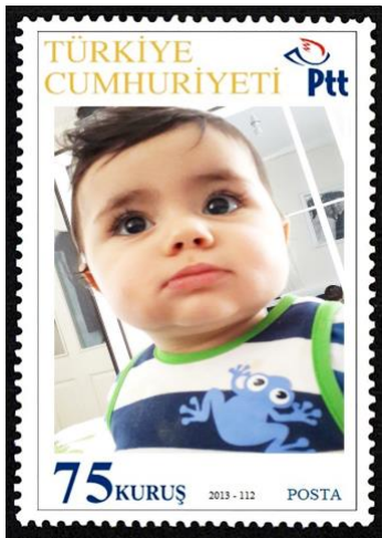
Şekil 14: Kişisel Pul Örneği

Türk filateli tarihinde yeni bir uygulama olan kişisel pul hizmeti PTT’nin 165. Kuruluş Yıldönümü kutlamaları kapsamında uygulamaya alınmıştır. Gerçek ve tüzel kişilerin önceden belirledikleri fotoğraf, tasarım, grafik, çizim vb. görselleri pul olarak bastırabilmelerine olanak sağlayan kişisel pul uygulaması ilk kez 25 Ekim 2005’te başlatılmıştır (Geçmişten Günümüze Posta, 2007, s. 384). Mevcut uygulamaya 2009’da doğrudan kişisel pul hizmeti, 2013’te kişiselleştirilmiş baskı ve zarflama uygulaması ve sonrasında ise kişisel pullu özel zarf hizmeti de dâhil edilmiştir (PTT Faaliyet Raporu, 2012, s. 100). Doğrudan kişisel pul hizmeti “Panel, fuar, kongre, sempozyum gibi ulusal ve uluslararası etkinlikler ile Şirketçe uygun görülecek işyerlerinde gerçek kişilerin sadece kendilerine ait kişisel pul taleplerini karşılamak amacıyla etkinlik yerinde basılıp teslim edilen pulları” ifade etmek için kullanılan bir kavramdır (PTT, 2020b, s. 4). Kişiselleştirilmiş baskı ve zarflama uygulaması ise bireysel müşterilerin, postaya verecekleri gönderileri, web ortamında tasarlayabilmelerine olanak tanıyan bir yeniliktir. Buna kapsamda 998 adet gönderinin üretimi gerçekleşmiş ve 2014 yılının Ocak ayında alıcılarına teslim edilmiştir (T.C. Posta ve Telgraf Teşkilatı A.Ş., 2013, s. 43).