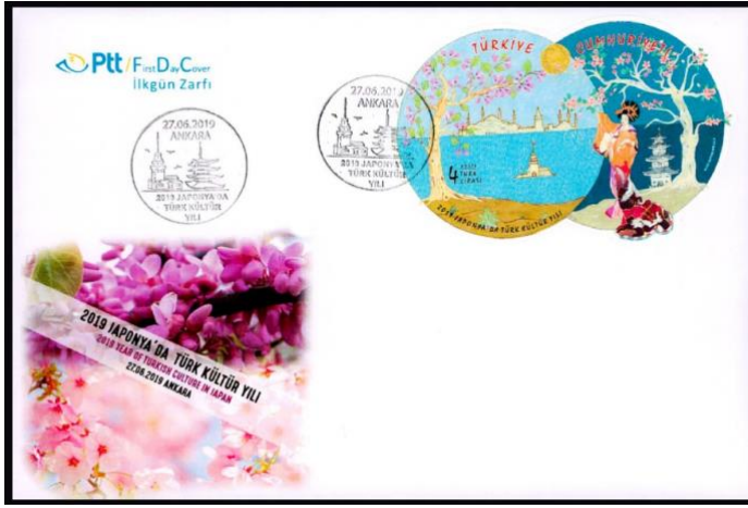
Şekil 8: 2019 Japonya'da Türk Kültür Yılı, Esengül Özer, 99 x 66 mm.