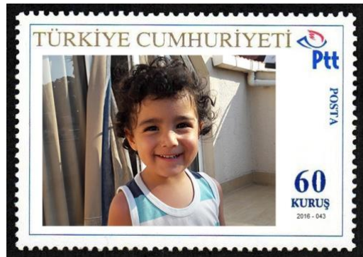
Şekil 15: Kişisel Pul Örneği