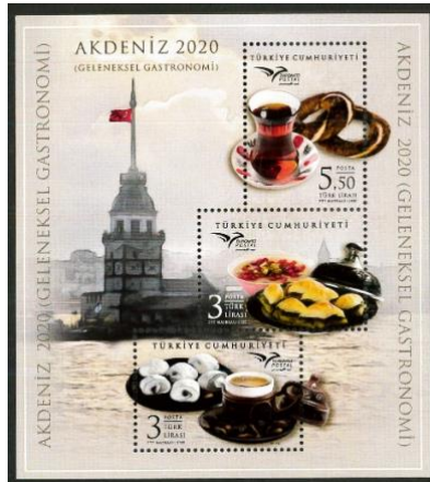
Şekil 5: Akdeniz 2020 Geleneksel Gastronomi, Hakan Doğu, 2020, 90 x 100 mm.

Ayrı bir pul türü olmayıp, posta ücretinin ödenmesinde kullanılan tabaka biçimindeki pullardır (PTT, 2020a, s. 3).