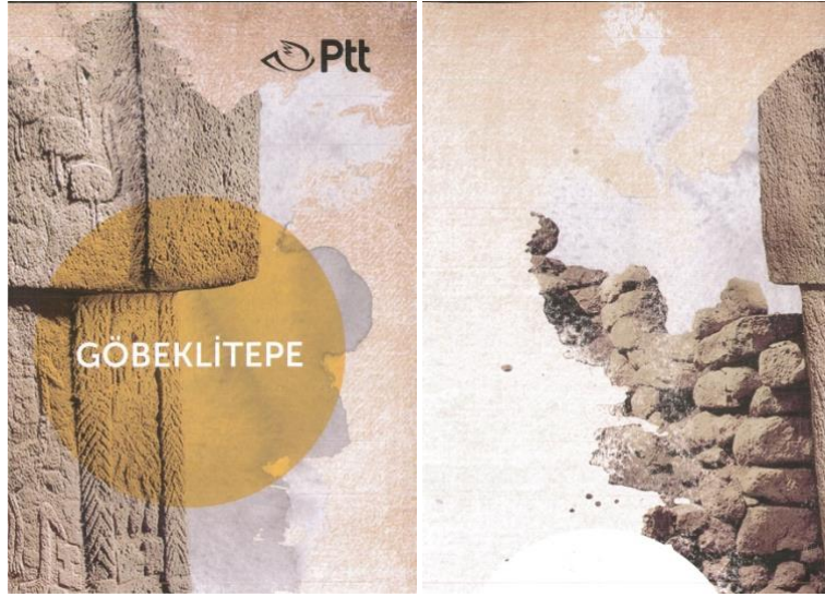
Şekil 10: Göbeklitepe 2019 Portföy.