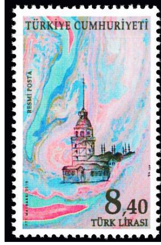
Şekil 6: Resimli Ebru, Atilla Can, 2019, 26 × 41 mm

Üzerinde “resmi” ibaresi bulunan ve yalnızca genel bütçede yer alan kurumlar ile katma ve özel bütçeli kurumların, belediyelerin ve bunlara bağlı idarelerin postaya verdikleri her türlü gönderilerin ücretlendirilmesinde kullanılan pullardır (Filateli, 2016).