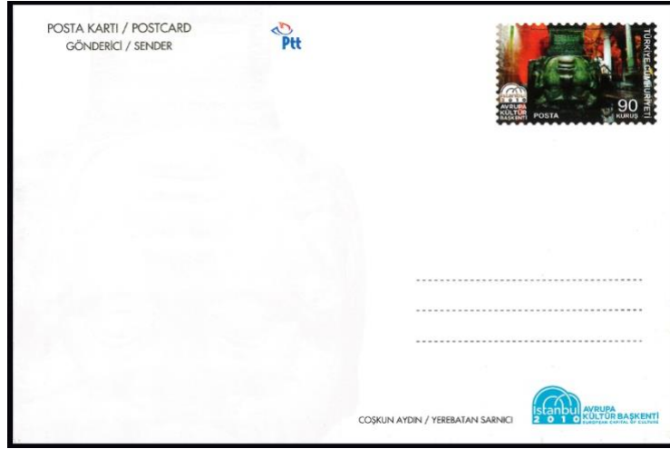
Şekil 11: İstanbul 2010 Avrupa Kültür Başkenti, 2010, Coşkun Aydın, 106 x 157 mm.

Üzerinde posta kartı ibaresi ile postadan alınacak ücreti gösteren bir adet pul baskısının yer aldığı resimli veya resimsiz kartlardır (Filateli, 2016).