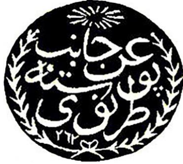
Şekil 1: Tırnova Posta Damgası 1846.

müdürleri tarafından kullanılan posta mühürlerinin birkaç istisna haricinde pul yerine tatbik edildiği de görülmekteydi (Geçmişten Günümüze Posta, 2007, s. 63; Güven Bezaz, 2006, s. 259). Posta mühürlerinin yanı sıra sadece posta hizmetlerinde geçerliliği bulunan posta damgaları da mevcuttu. Osmanlıda kullanılan posta damgalarının bir de noktalı, mustatil, müdevver ve müseddes gibi türleri bulunmaktaydı. Ayrıca mühürlerin üzerindeki Osmanlıca ifadeleri okuyamayan koleksiyonculardan önemli bir kısmının, gördükleri her bir posta damgasını posta mührü olarak değerlendirdiği bilinmekteydi (Güven Bezaz, 2006, s. 255-292).