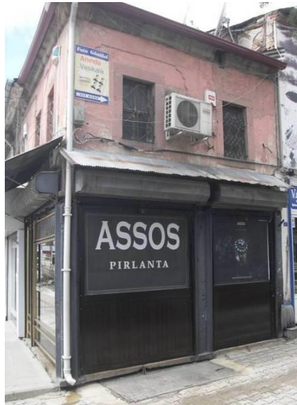
Fotoğraf 12. Dükkân (Assos Pırlanta) Doğu Cephesi (Ada 126 Parsel 15) [22]

Kitirler Mahallesi Atatürk Bulvarı üzerinde No 15'de yer alan ve Hacı İpek Hanı'na kuzey yönünde bitişik olması nedeniyle Ankara 1 Numaralı Kültür ve Tabiat Varlıkları Koruma Kurulu tarafından tescillenen dükkânın yapım tarihi hakkında bir veri bulunmamaktadır. Ancak plan tipolojisi, cephe özellikleri, malzeme ve malzeme kullanım tekniği gibi mimari özelliklerinden dükkânın 20. yüzyıl başında inşa edildiği düşünülebilir. Kuzey ve batı yönlerinde bitişik nizamda inşa edilen, köşe parselde yer alan ve özgün işlevi konut olan yapının alt katı günümüzde ticari amaçlı (kuyumcu) kullanılmaktadır. Alt katı yaklaşık 13 m 2 , tek hacimli bir satış mekânından; üst katı ise 24 m 2 büyüklüğünde depo olarak kullanılan bir mekândan oluşan dükkânın alt katı güvenlik nedeniyle kepenklidir. Alt katta camekân (vitrin) olarak kullanılan açıklıkların doğraması renkli eloksal alüminyum malzemedendir. Üst katın güney ve doğu cephesi taş söveli, dikdörtgen formlu, demir parmaklıklı, ikili gruplanmış pencereleri ve profille sonlanan çatı saçakları ile dükkân, 20. yüzyıl ilk çeyreğinde inşa edilmiş sivil konut örneklerinin cephe anlayışını yansıtmaktadır. Dükkânın çatısı doğu ve güney yönüne eğimli olup, üzeri oluklu levha ile kaplanmıştır (Fotoğraf 12).