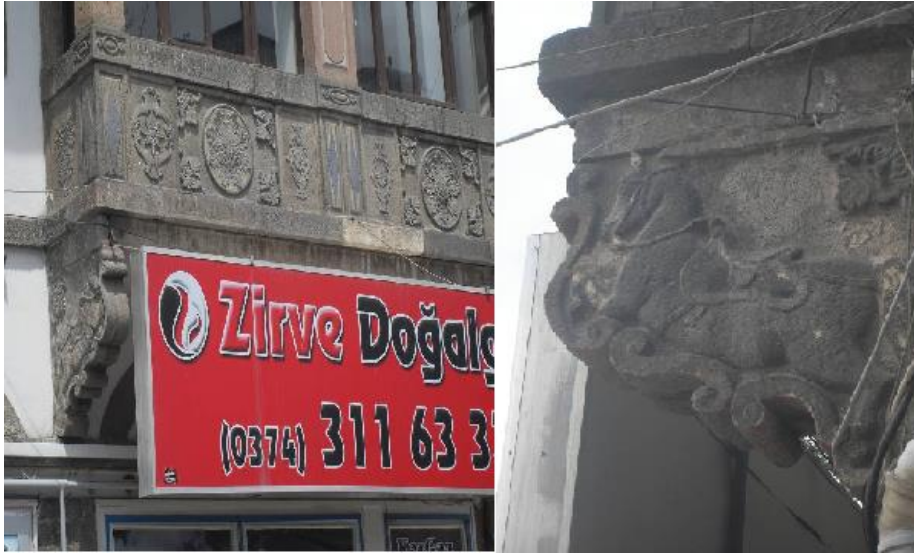
Fotoğraf 3. Vezirhan Güney Cephesi Çıkma Detayları (Ada 125 Parsel 3) [22]

Üst kat planı 19. yüzyıl konutlarının plan anlayışındaki gibi dış sofalı planlanmıştır. Güneydoğu yönünde alt kattaki pencerelerin ortasında yer alan ve pencerelerden daha alçak olan kapının her iki yanında birer pencere mevcuttur. Bu pencerelerin açıklıkları güney yönüne kıyasla daha küçüktür. Aynı yönde üst katta yer alan dar pencereler ise ikili gruplanmıştır. Hanın doğu cephesinde alt katta geniş açıklıklı kemerli kapının bir yanında üçlü gruplanmış demir parmaklıklı dar, kemerli pencereler, diğer yanında ise dikdörtgen formda küçük ve alçak bir pencere yer almaktadır. Ortası sabit kemerli kapı açıklığının sol ve sağ tek kanatlı ahşap kapıdır. Kapının iki yanında yarım daire kesitli taş sütunlar, sütun başları ve kapı kemerinin kilit taşında çiçek motif görülmektedir. Üst katta ise aynı biçim ve ölçüde dört adet pencere yer almaktadır. Yapının oldukça sade olan kuzey cephesinde alt katta ortada alt seviyeden başlayan, kemerli, taş söveli, demir kanatlı ve tek kanatlı küçük bir kapı, üst katta ise ortada kapının üzerine gelecek şekilde ikili gruplanmış iki adet pencere, sağında ve solunda birer adet pencere bulunmaktadır. Bu kapının depo olarak kullanılan alt katta kuzey yönündeki odalara mal aktarımı için açılmış olabileceği söylenebilir. Yapının güney, güneydoğu, doğu ve kuzey yönlerinde yer alan pencere ve kapılar (dükkân kapıları hariç) taş söveli, kilit taşlı ve tek kanatlıdır.