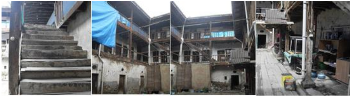
Fotoğraf 10. Kiliseli Tüccar Hanı Galeriye Açılan Odalar (Ada 128 Parsel 3) [22]

1944 tarihindeki depremden sonra ayakta kalan, ancak bakımsızlıktan özgün yapısını kaybetmek üzere olan yapılardan biri olan han günümüzde Gerede'ye çalışmaya gelen geçici işçiler tarafından kullanılmaktadır. Yapının cepheleri dışında günümüze kadar herhangi bir onarım geçirmediği bilinmektedir. Bu nedenle oldukça bakımsız görünen yapının ivedilikle ve aslına uygun onarılması önerilmektedir.