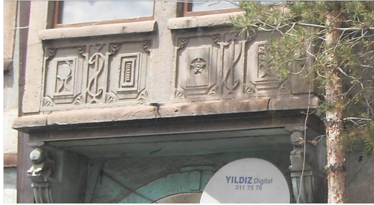
Fotoğraf 5. Deli Molla Hanı Çıkma Altı Süslemeleri (Ada 125 Parsel 4, 5, 6) [22]

Hanın üst kısmı, dış sofalı 19. yüzyıl konut planlarını hatırlatmaktadır. Kemerli pencereler tek kanatlı ve ahşaptır. Yapı yüzeyinde yer alan çeşitli tabela ve kablolar han ile kentsel dokunun niteliğini ve estetiğini bozmaktadır. Bundan başka, dükkân kullanımlarında gereksinim duyulan ocak, soba bacaları, TV çanakları gibi bazı ekler, yapı görüntüsünü olumsuz etkilemektedir. Yapının üzerinde görüntü kirliliği oluşturan eklentiler; yapının süslemeleri ve tüm detayları ile algılanmasını engellemektedir. Deli Molla Hanı'nın üst katına çıkılan merdivenden; ortasında bir göbeği bulunan ahşap tavanlı sofaya, sofadan da batı yönünde açılan geniş bir mekâna geçilmektedir. Hanın alt katında dükkân olarak kullanılan mekânlarda, cephede var olan her bir kemer gözünün beşik tonoz örtülü olduğu görülmektedir. Kemer genişliği ile sınırlandırılmış dükkânlarda yapılan tadilatlar, zaman içerisinde kemerlerin özgün formlarının değişmesine neden olmuştur. Han, üst kat ve cephe mimarisi, ufak değişikliklere rağmen günümüze özgün şekilde taşınması ile yapıldığı 19. yüzyıl şehir içi hanlarının genel mimari özelliklerini yansıtmaktadır.