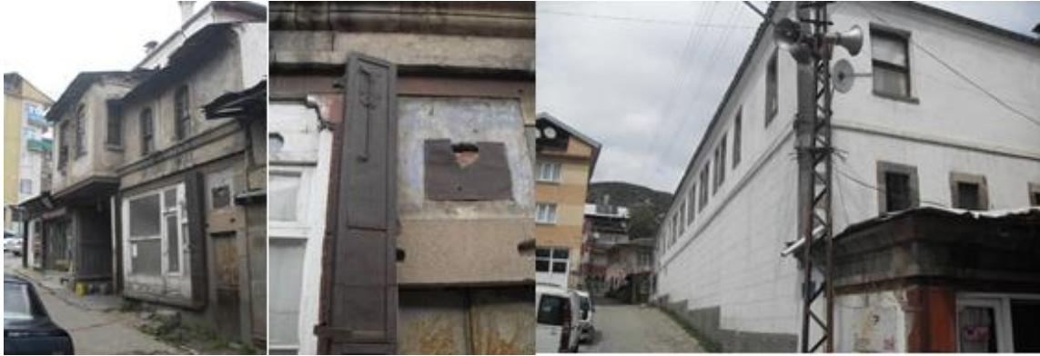
Fotoğraf 9. Kiliseli Tüccar Hanı Güney ve Batı Cepheleri (Ada 128 Parsel 3) [22]