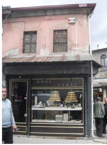
Fotoğraf 13. Dükkân (Assos Pırlanta) Güney Cephesi (Ada 126 Parsel 15) [22]