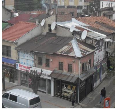
Fotoğraf 14. Dükkân (Assos Pırlanta, Ada 126 Parsel 15), (Erol Erdoğan ve Reyhan Gümüşçülük Ada 126 Parsel 16 ve 17) Güney Cephesi [22]