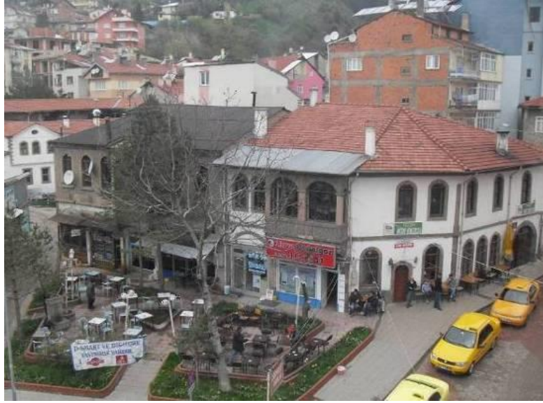
Fotoğraf 4. Deli Molla Hanı ve Vezirhan Genel Görünüm (Ada 125 Parsel 4, 5, 6) [22]