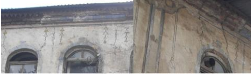
Fotoğraf 7. Hacı İpek Han Doğu Cephesi Süslemeler(Ada 127 Parsel 10) [22]

Hanın altında doğu-batı yönündeki geçitten geçilerek alt katta kuzey cephesinde yer alan bir kapıdan günümüzde kahvehane olarak kullanılan mekâna girilmektedir. Yapının alt kat odalarından biri olan kahvehanenin tavanı ahşap kaplanmış ve yağlıboya ile boyanmıştır. Kahvehanenin kuzeydoğu köşesinden açılan kapı ile alt katta günümüzde depo olarak kullanılan doğu odasına girilmektedir. Buradan hanın üst katına çıkış sağlayan ahşap bir merdiven bulunmaktadır. Yapının üst kat doğu tarafında sıralı odalar mevcuttur. Bu odaların handa konaklayan konuklar tarafından kullanıldıkları düşünülmektedir. Hanın bakımsızlığı, zaman içinde özgün formunun ve yapısının değişmesine yol açabilecek niteliktedir. Cephe yüzeyine konulan tabela, klima ve kablolar tarihi hanın ve kentsel dokunun niteliğini ve estetiğini bozmaktadır. Bunlardan başka dükkân kullanıcılarının gereksinim duyduğu bazı ekler de (ocak bacası ve soba bacaları) yapı görüntüsünü olumsuz etkilemektedir. Yapının üzerindeki görüntü kirliliği oluşturan eklentiler ve bakımsızlık nedeniyle yapının süslemeleri tüm detayları ile algılanamamaktadır.