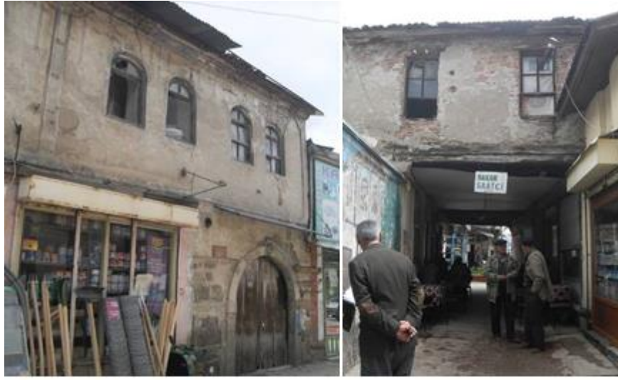
Fotoğraf 6. Hacı İpek Han Doğu Cephesi ve Batı Cephesindeki Geçit (Ada 127 Parsel 10) [22]