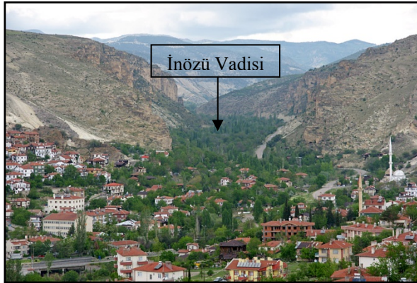
Şekil 3. İnözü Vadisi (Orijinal, 2001)

Bey pazarı'nda en fazla yağış Aralık ve Ocak ayında (56.1 mm ve 48.7 mm), en az yağış Ağustos ve Eylül ayındadır (13.6 mm ve 14.1 mm). Bey pazarı'nda hâkim rüzgârlar batı ve güneybatıdan, en hızlı esen rüzgar ise güneydoğudan 32.4 mm/saniye şiddetiyle esmektedir. Ortalama maksimum sıcaklık Temmuz ayında 31.2°C ve ortalama minimum sıcaklık Ocak ayında 18°C olarak ölçülmüştür. Yıllık ortalama nispi nem % 61.2'dir. Ortalama nispi nemin en yüksek olduğu aylar, Aralık ve Ocak ayları olup ortalama nispi nemin en düşük olduğu aylar, Temmuz ve Ağustosur (Anonim, 1999).