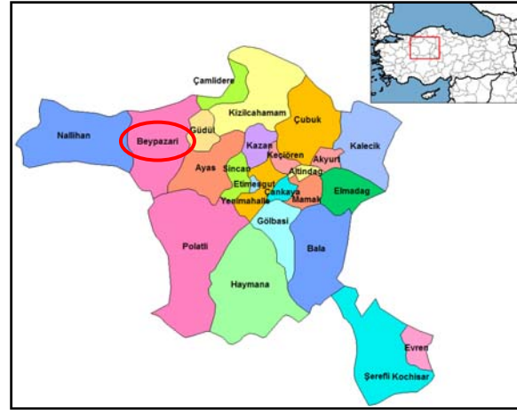
Şekil 1. Bey pazarı'nın Ankara İli içindeki konumu ve yakın çevresi (Anonim, 2008)

3000'i aşkın tarihi ahşap evlerden oluşan mahalleler varlıklarını sürdürmektedirler.