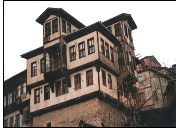
Şekil 5. Geleneksel Beypazarı konutu (Orijinal, 2001)

Beypazarı konutları, geleneksel Türk evi özelliklerine sahiptir. Evler iç, dış ve orta sofalıdır. Çoğunlukla evler 3 katlı olup, zemin katlar taş, üst katlar ahşap iskelet içinde, ahşap veya kerpiç dolgu sistemle yapılmıştır. Zemin kat planı diğer katlardan oldukça farklıdır ve farklı kullanım alanları vardır. Zemin kat servis amacıyla kullanılırken üst katlar yaşama mekânı olarak ayrılmıştır (Özmen, 1987) (Şekil 5).