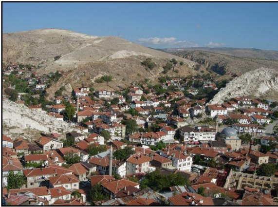
Şekil 4. Beypazarı tarihi kent dokusu (Orijinal, 2008)

Tarihi doku içinde yer alan dik kalker tepeler iki sıra halinde uzanmakta ve yerleşim bu tepelerin eteklerine kurulmuştur. Kalker tepeler nedeniyle yerleşim yer yer kesintiye uğramıştır. Yerleşimi rüzgâra karşı koruyan kuzeydeki bu tepeler ve çeşitli yükseklikler gösteren topografik yapı, görsel açıdan zengin kompozisyonlar oluşturmaktadır. Topografik özelliklerin meydana getirdiği organik düzende yerleşme biçimi gösteren bahçeli, avlulu ve bitişik evler ile sokakların bir araya gelmesiyle tarihi kent dokusu oluşmuştur (Şekil 4).