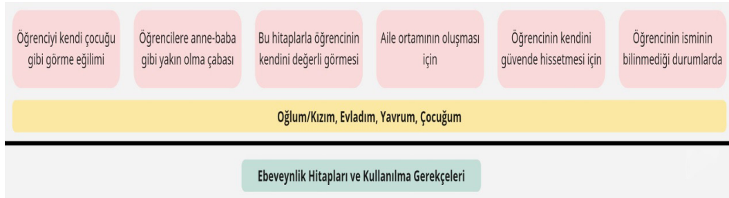
Şekil 2. Ebeveynlik Hitapları ve Kullanılma Gerekçeleri

Şekil 1’de araştırmaya katılan öğretmenlerin tercih ettikleri hitaplar frekanslarıyla birlikte verilmiştir. Şekil 2, Şekil 3 ve Şekil 4’de bu hitapların kümelendiği temalar ve kullanılma gerekçeleri paylaşılmıştır.