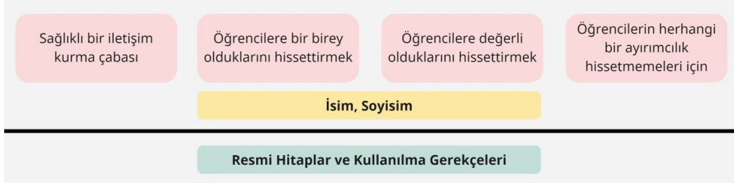
Şekil 3. Resmi Hitaplar ve Kullanılma Gerekçeleri

yaygın olarak ortaokul öğretmenlerinin tercih ettiği görülmektedir. Zira branş öğretmenlerinin birden fazla sınıftan dersine girmeleri bunda rol oynayabilir.