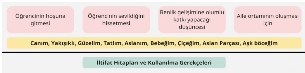
Şekil 4. İltifat Hitapları ve Kullanılma Gerekçeleri

Son olarak Şekil 4’de ise iltifat hitapları kapsamında, öğretmenlerin diğer hitaplardan daha seyrek ancak daha çeşitli olarak canım, yakışıklı, güzelim, tatlım, aslanım, bebeğim, çiçeğim, aslan parçası ve