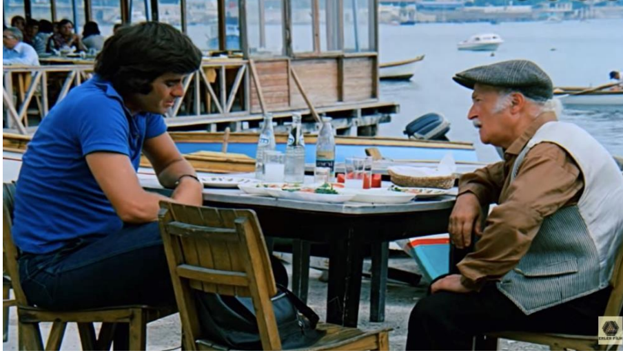
Şekil 18. Kader Bağlayınca 1976 Hasan'ın Kahvesi (Korlu, 1976)

1970'lerin ikinci yarısından itibaren Ertem Eğilmez ekolüne ait 'Arzu Film Güldürüleri' (Özgüç, 2005: 72) olarak nitelendirilen filmlerin pek çoğu Yeşilköy'deki Arnavut Hayrettin Bey Köşkü ile Gelenbevîzâde Said Bey Köşkü'nde çekilmiştir. Bunlardan, Tosun Paşa (1976), Süt Kardeşler (1976), Şaban Oğlu Şaban (1977), Neşeli Günler (1978), Cafer'in Çilesi (1978) Arnavut Hayrettin Bey Köşkü'nde çekilen filmlerdendir. 'Süt Kardeşler' filminin çekimleri esnasında köşkün ön cephesinde çekilen hatıra fotoğrafı (Şekil 19, solda) belge niteliğindedir.