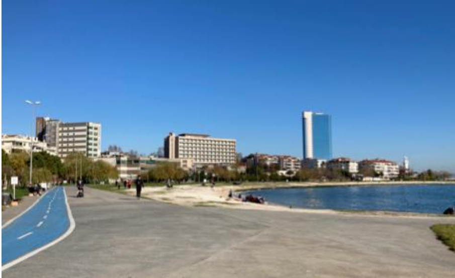
Şekil 14. Yeşilköy kıyı şeridi Ayastefanos Deniz Feneri sağda (Turangil, 2021)