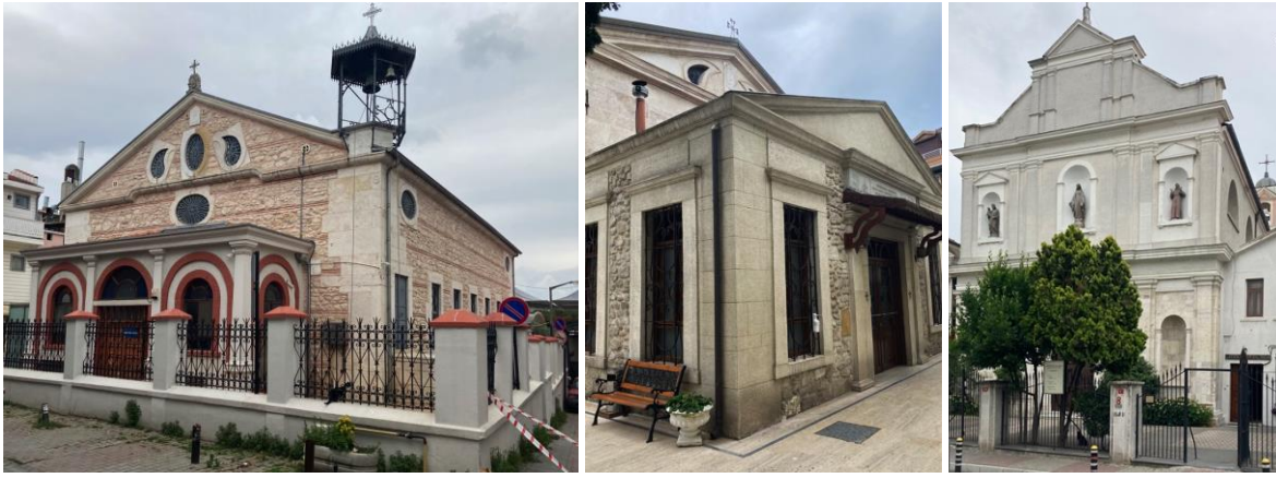
Şekil 4. Ayios Stefanos Rum Kilisesi (solda), Surp Stefanos Ermeni Kilisesi (ortada) ve Aziz İstefanos Latin Katolik Kilisesi (sağda) (Turangil, 2021)

Köyiçi bölgesinde Şekil 4’te görülen Ayios Stefanos Rum Kilisesi (1845), Surp Stefanos Ermeni Kilisesi (1843) ve Aziz İstefanos Latin Katolik Kilisesi (1865), ile Şekil 5’te görülen Abdülmecid Han Çeşmesi (1842), üçgen bir hat oluşturacak şekilde konumlanan bölgenin başlıca tarihî yapılarıdır. Yeşilköy’ün ilk Rum Ortodoks Kilisesi dördüncü yüzyılın ilk yarısında imparator Konstantinus tarafından ibadete açılmıştır (Tuğlacı, 1993: 106). Efsaneye adını veren Aziz Stefanos’un kemiklerinin kısa bir süreliğine muhafaza edildiği bölge olmasının anısına inşa edilen ahşap kilise, Yeşilköy’de bilinen en eski dinî yapıdır. Zaman içerisinde harap olan Ayios Stefanos Rum Kilisesi, 1845 yılında aynı yerde yeniden ihya edilmiştir.