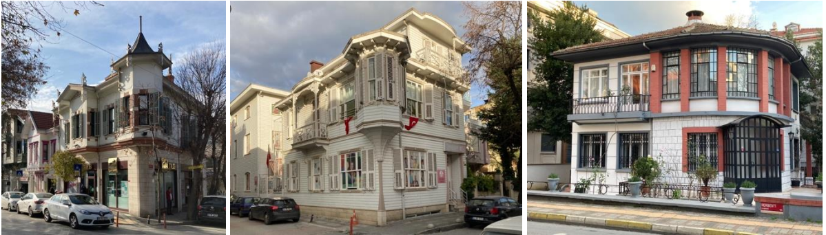
Şekil 12. İstasyon Caddesi'nde banka olarak işlev gören Viktoryan tarzda iki katlı ev (solda) İstanbul Caddesi'nde anaokulu olarak işlev gören ahşap ev (ortada) Serbesti Caddesi'nde yer alan modern mimarî ara dönem yapılarına nitelikli bir örnek (sağda) (Turangil, 2021)

Yeşilköy'de 1950'lerin villa tipi iki katlı yığma yapı örnekleri gibi bir dönem ifadesi olan nitelikli konutlar, zamanla yıkılıp yerlerine çok katlı apartmanlar inşa edilmiştir. Günümüzde artık tescilli kültür varlığı yapıları ile yanlarına inşa edilen lüks konutlar haricinde, ahşap-kâgir dönemden betonarme döneme geçişi ifade eden yapılar neredeyse hiç kalmamıştır. Geçiş dönemi yapılarından (Şekil 12, sağda) nitelikli, çeşitliliğin göstergesi örnekler maalesef günümüze ulaşamamıştır. Yeşilköy sakini Yasemin Hanım (Y. Silivri, kişisel görüşme, 9 Şubat 2021), 1950'lerde inşa edilen Avusturya mimarisini andıran sivri damlı, iki katlı kâgir evler hatırladığını ve bu konutların yıkılıp yerlerine çok katlı binalar yapıldığını aktarmaktadır.