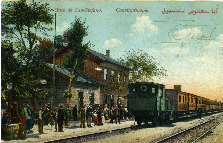
Şekil 7. Gare de San-Stefano Constantinople Aya Stafanos İstasyonu (Atatürk Kitaplığı, tb, krt.4608)

Ayastefanos Tren İstasyonu, 4 Ocak 1871 yılında açılışı gerçekleşen ve İstanbul-Edirne demiryoluna bağlı Yedikule-Küçükçekmece hattının bir parçasıdır (Şekil 7). Yapılışından itibaren işletmesi yabancı şirketlere verilmiş olan demiryolu hattı, 29 Mayıs 1910'dan itibaren Osmanlı idaresine geçmiştir. Bugün Marmaray hattı üzerinde varlığını korumaktadır ancak işlevsel değildir.