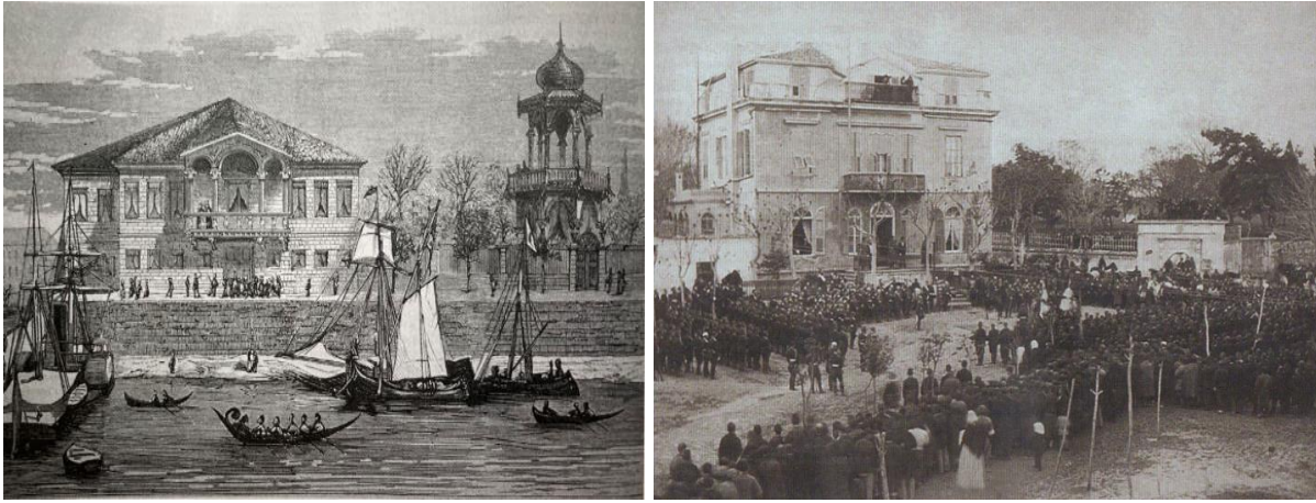
Şekil 8. Neriman Şah Yalısı'na ait bir gravür (solda) (Başgelen, 2008: 10) Dadyan Konağı 23 Mart 1878 Abdullah Biraderler (sağda) (Tuna, 2006: 106)

Yeşilköy hafızasında önemli yer tutan sivil mimarlık örneklerinden 3 Mart 1878'de Ruslarla yapılan Ayastefanos Antlaşması'nın imzalandığı Neriman Şah Yalısı ile 93 Harbinde Osmanlı Devleti ile Rus ordusu arasında gerçekleşen müzakere sürecinde Rus ordusu adına Grandük Nikola Nikolayeviç'e tahsis edilen Barutçubaşı (Dadyan) Konağı, günümüze ulaşamayan yapılardır (Şekil 8).