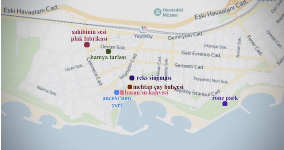
Şekil 20. Güncel Yeşilköy haritasında hafıza mekânlarının konumları (Yandex, 2021 haritası kullanılarak yazar tarafından üretilmiştir) (Kübra Turangil, 2021)

Yeşilköy'ün bir sayfiye yeri olmasından ötürü yazın faaliyet gösteren, deniz kenarında bulunan açık hava çay bahçeleri ve restoranlar rağbet gören mekânlardır. Bu mekânlardan Hasan'ın Kahvesi, Balıkçı Limanı'nda deniz üzerinde kazıklar çakılmış hâlde hizmet veren salaş bir mekândır. Demirci Çıkmazı Sokağı'nda bulunan Mehtap Çay Bahçesi ve Camlı Köşk Çay Bahçesi de yine anılarda yer eden önemli mekânlardandır. Mehtap Çay Bahçesi'nin yerinde bugün yine bir kafe hizmet vermektedir.