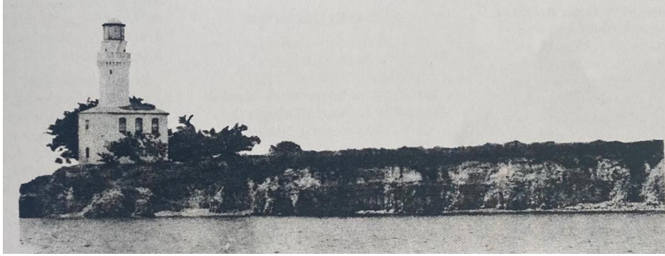
Şekil 6. 1900'lü yılların başında Ayastefanos Deniz Feneri'nin görüldüğü bir kartpostal (Başgelen, 2008:13)

Tarihî süreçte Ayastefanos'tan Yeşilköy'e, her dönem bölgenin simge yapısı olma özelliğini koruyan Ayastefanos Deniz Feneri, Sultan Abdülmecid tarafından 1856 yılında yaptırılmıştır. "15 deniz mili uzaklıktan görülebilen 10 saniyede bir çakar iki grulu ışığının yanı sıra, sisli havalarda 30 saniyede bir çaldığı ünlü sis düdüğü" mevcuttur (Tuna, 2006: 94) (Şekil 6).