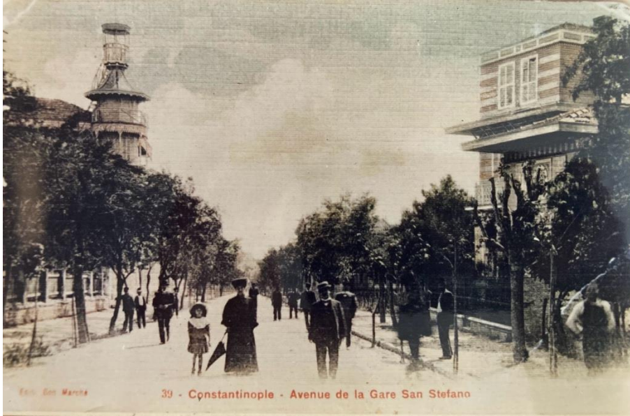
Şekil 3. Yeşilköy'de İstasyon Caddesi'ni gösteren bir kartpostal

yapısına borçludur. 17. yüzyılda küçük bir Rum balıkçı köyü olarak bilinen Ayastefanos'un, 19. yüzyıla gelindiğinde en parlak günlerini yaşamaya başlamasıyla nüfusunda artış ve demografik yapısında değişimler görülmeye başlanmıştır. Tuna'nın aktardığına göre (2006: 70), Ermenilerin Ayastefanos'a gelişleri 19. yüzyıl başlarına tekabül etmektedir. Azadlı ve Makrıköy Baruthanelerinin Dadyan'ların 7 yönetimine geçmesinin ardından bu tesislerde çalıştırılmak üzere Van, Bitlis ve civar illerden getirilen Ermeni işçiler Makrıköy ve Ayastefanos'a yerleşmişlerdir. Ayastefanos'un 19. yüzyılın ikinci yarısına dek mütevazı bir Rum balıkçı köyü olma vasfını koruduğu görülmektedir. Bunun en önemli nedeni İstanbul'dan bölgeye ulaşımın zorluğudur. Yandan çarklı Ayastefanos-Köprü (1853) hattı ve Yenikapı-Küçükçekmece (1871) tren seferlerinin hizmete başlaması ile ulaşım açısından rahata eren köy, 1870'li yıllar sonrasında gözde bir sayfiye mekânına dönüşmeye başlamıştır (Şekil 3). O dönemde Ayastefanos bilhassa Avrupa'dan gelen Levantenler ile Osmanlı Devlet kademelerinde önemli görevlerde bulunan kimselerce tercih edilmektedir. İstanbul merkezine sağlanan ulaşım kolaylığı ile köyde yaz sezonunda daha fazla olmakla birlikte nüfus artışı görülmektedir.