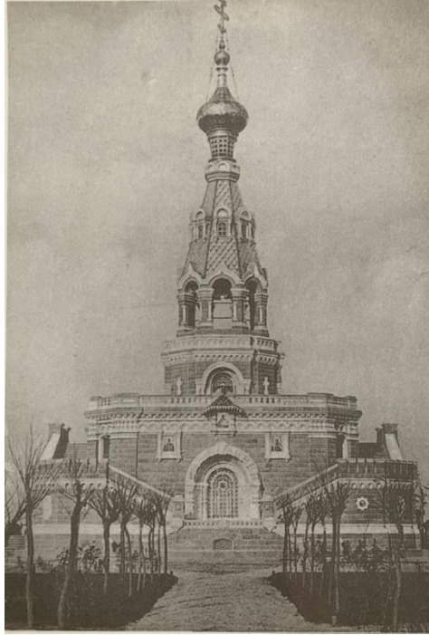
Şekil 2. Ayastefanos Rus Anıtı'na ait bir kartpostal (Bahattin Gürfırat arşivi, tb)

Ayastefanos Anıtı'nın yıkılışı Yeşilköy'ün hafızasında önemli bir yer tutmaktadır. "Ayastefanos Rus Anıtı olarak bilinen yapı aslen 93 Harbi'nin hatırası olarak inşa edilmiş bir mezar-kilisedir" (Denktaş, 2011: 37). 93 Harbi olarak da adlandırılan Osmanlı-Rus Savaşı'nda yaşamını yitiren Rus askerlerin anısına; Rus Devleti'nin Osmanlı İmparatorluğu'na bir yaptırım olarak inşa ettiği anıt, 18 Aralık 1898'de açılmıştır (Şekil 2). Yapıldığı ilk günden itibaren anıtın varlığı Osmanlı Devleti'nde rahatsızlık doğurmuştur. I. Dünya Harbi'nde, Osmanlı Devleti'nin ittifak devletleri yanında yer almasıyla birlikte Osmanlı-Rus ilişkileri bir kez daha gerilir. Bu dönemde çeşitli yayın organlarında yayımlanan makaleler ile anıtın yıkımının gerekliliği gündeme getirilir. Yazar Aka Gündüz'ün Ayios Stefanos'taki Rus Anıtı'nın artık kaldırılması zamanının geldiğine işaret eden makalesi bu yolda atılan ilk adım olmuş, bunu 'Tezahürat-ı Milliye Heyet-i Tertibiyesi'nin kuruluşu izlemiştir (Tuğlacı, 1993: 145). Ayastefanos Anıtı 14 Kasım 1914 günü dinamitle yıkılır. Türk sinema tarihinde kabul edilen ilk belgesel film, Ayastefanos Anıtı'nın yıkılışının kaydedildiği görüntülerdir. Margulies'in aktardığına göre (1994: 40), Ağâh Özgüç anıtın yıkıldığı 14 Kasım 1914'ü Türk sinemasının gerçek doğum tarihi olarak ifade eder. 'Ayastefanos'taki Rus Abidesinin Yıkılışı' adını taşıyan ve tarihî anısı olan bu film, 150 metre uzunluğunda bir belgeseldir.