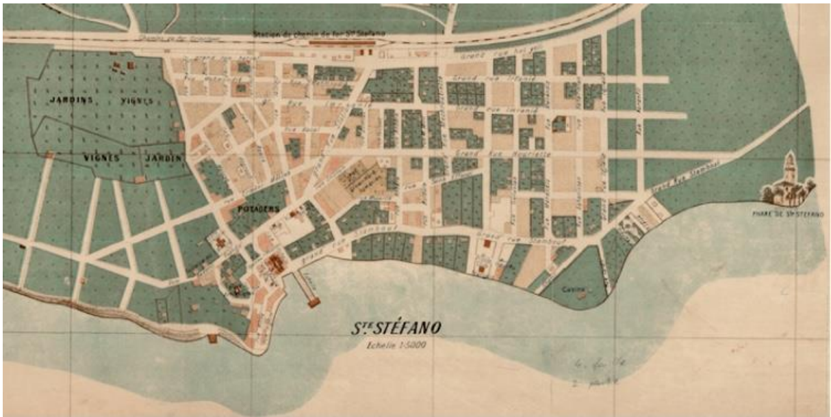
Şekil 1. 1:5000 Ölçekli Necip Bey haritası (Atatürk Kitaplığı, tb, hrt.432)

Yeşilköy, doğu yönünde İstanbul'un yakın dönemde oluşan semti Ataköy ile arasında konumlanan Yeşilyurt mahallesi, batı yönünde Florya-Şenlikköy mahallesi, güneyinde Marmara Denizi ve kuzey yönünde E-5 karayolu ile çerçevelemiştir. 1953 ile 2019 yılları arasında uluslararası sivil havacılıkta hizmet veren Atatürk Havalimanı 1 ile Havacılık Müzesi ve Yeşilköy Marina ilçe sınırları içerisindedir. Yeşilköy, 1970'li yıllara dek yoğun bir nüfusa sahip olmayan sayfiye bir sahil semti iken, İstanbul'un 1980 sonrasında yaşadığı hızlı yapılaşmayla eş zamanlı olarak ve yine aynı yıllara denk gelen sahil şeridinin doldurulmasıyla beraber tarihî silüetinden çok farklı bir görünüme bürünmüştür. 2020 yılı TÜİK verilerine göre nüfusu 24.814'tür (Türkiye İstatistik Kurumu, 2020). Şekil 1'deki Necip Bey haritasında (tb) Ayastefanos yerleşimi görülmektedir. Haritada yerleşim, Latin dilinde kullanılan karşılığı ile San Stefano olarak adlandırılmıştır.