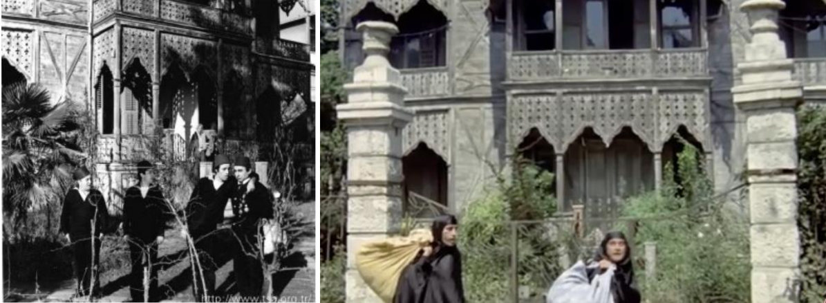
Şekil 19. Süt Kardeşler (sağda) (Taş, 1976) Süt Kardeşler filminden bir kare (sağda) (Süt Kardeşler, 1976)