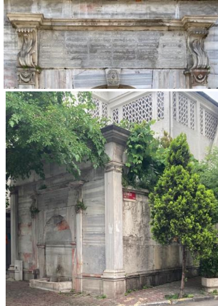
Şekil 5. Abdülmecid Han Çeşmesi ve Namazgâhı Çeşme alınlık detayı (üstte) (Turangil, 2021)

Rum Kilisesi ile Latin Katolik Kilisesi arasında yer alan Ayia Fotini Ayazması ile Gazi Evrenos Caddesi’ndeki Mecidiye Camii (1909) günümüze ulaşan diğer dinî yapılarıdır. 19. yüzyılda Yeşilköy’de azınlık olan Müslüman halkın ibadet etmesine yönelik namazgâhla çeşme formunda yapılmış olan Abdülmecid Han Çeşmesi ile aynı yüzyılın sonlarına doğru köyde artan