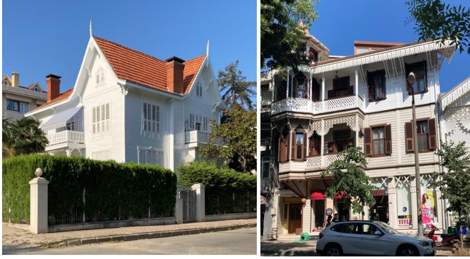
Şekil 10. Gelenbevîzâde Said Bey Köşkü (solda) Kuleli Ev (sağda) (Turangil, 2021)

19. yüzyılın ikinci yarısından itibaren İstanbul'un sahil kesimlerinde yer alan semtleri ile Adalar gibi Makrıköy ve Ayastefanos da yazlık ev kültürünün gelişmeye başladığı semtlerdendir. Bu dönemde Art Nouveau, Viktorian gibi batı mimarlığından ithal üsluplarla, karma tekniklerle vücut bulan ahşap ve kâğır yalı ve köşkler inşa edilmiştir. Bahsettiğimiz sivil mimarlık örnekleri haricinde Yeşilköy'de Sempirini, Amanchich, Perpignani gibi Levanten mimarların, bilhassa sahil kesiminde inşa ettiği çeşitli yapılar günümüze kadar erişmiştir. Bunlara en güzel örneklerden biri Ayastefanos'a ait tarihî kartpostallarda yer alan 'Kuleli Ev'dir (Şekil 3). Yeşilköy'ün simge yapılarından olan ev (Şekil 10, sağda), İtalyan asıllı Mimar Guglielmo Semprini tarafından 1900'lerin başında yan yana inşa edilen üç ahşap evden biridir.