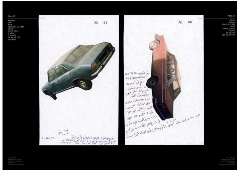
Görsel 1. Notebook Volume 38: Already Been in a Lake of Fire , Walid Raad, 1989-2004 (Theatlasgroup1989, t.y.).