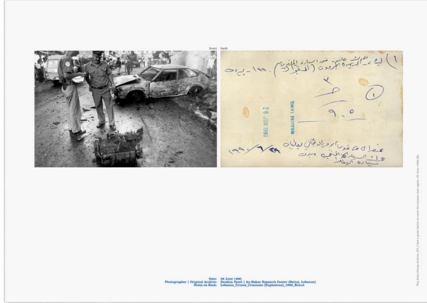
Görsel 6. My Neck is Thinner Than a Hair, Walid Raad, 1989-2004.

Olağandışı bir şekilde, laboratuvarlar mavi baskılardan küçük siyah beyaz gizli görüntüleri kurtardı. Küçük resimler, erkek ve kadınların grup portrelerini temsil ediyordu. Atlas Grubu, küçük siyah-beyaz görüntülerde temsil edilen tüm bireyleri teşhis edebildi ve hepsinin 1975 ile 1991 yılları arasında Akdeniz'de boğulan, ölen veya ölü bulunan bireyler olduğu ortaya çıktı. (The Atlas Group, t.y.-ç)