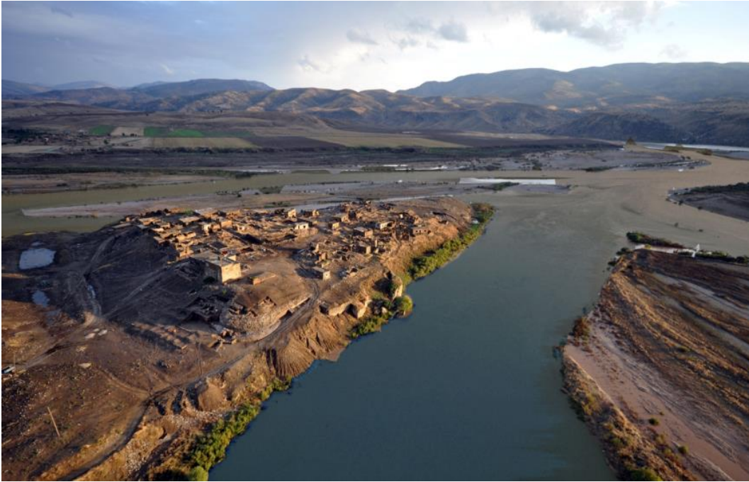
Şekil 4: Çattepe.

Höyüğün en erken bilinen adına baktığımızda; Osmanlı Dönemi'nde, Tilköy ve günümüzde ise Çattepe olarak geçmektedir (İller İdaresi, 1968: 136, 770) (Şekil 4). İlk yerleşim izleri Prehistorik Dönemlere kadar giden Çattepe'nin, bu dönemden itibaren sürekli bir kullanım evresi olmakla beraber (Sağlamtimur ve diğ., 2018: 242), Ilısu Baraj Projesi kapsamında sular altında kalan arkeolojik alanlar arasında girmiştir.