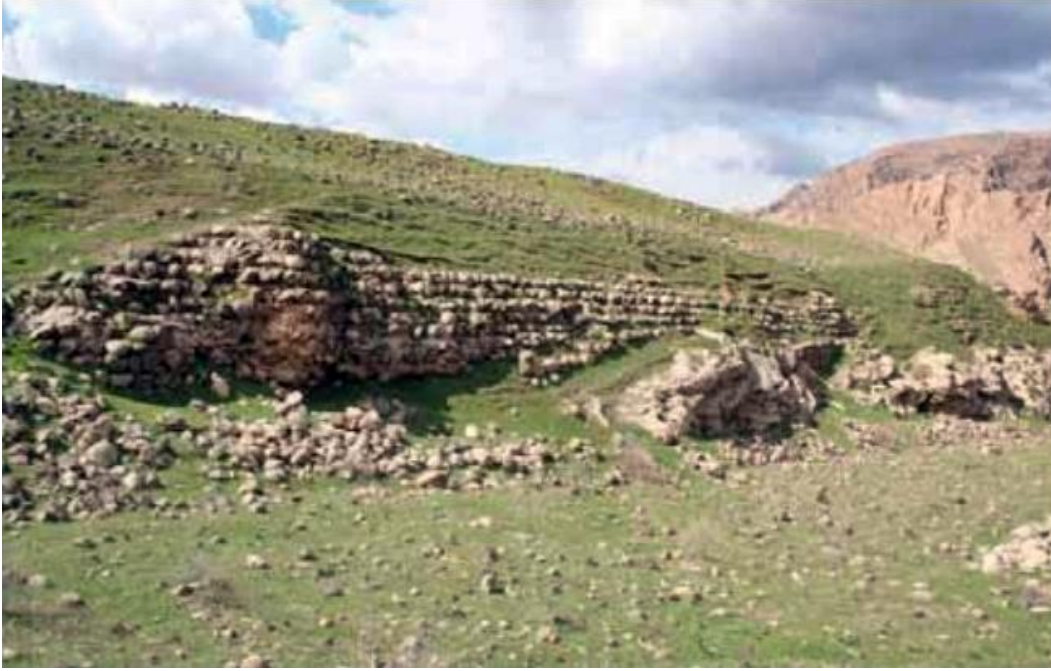
Şekil 3: Bezabde Surlarından Bir Görünüm (Çevik ve Konuk, İdil, s. 31).

da tahkim ettirmiştir (Brancato, 2020: 274). İki güç arasındaki mücadelede şehir, üç lejyonla savunulmuştur (Yücel, 2018: 243). II. Şapur, Bezabde'yi aldıktan sonra halkın büyük bir bölümünü öldürmüştür ancak şehrin surlarını restore ettirmiştir (Harmatta, 1958: 160). Nisibis ve Bezabde MS 363'te antlaşmasıyla Sasaniilere bırakılmıştır (Isaac, 2000: 252).