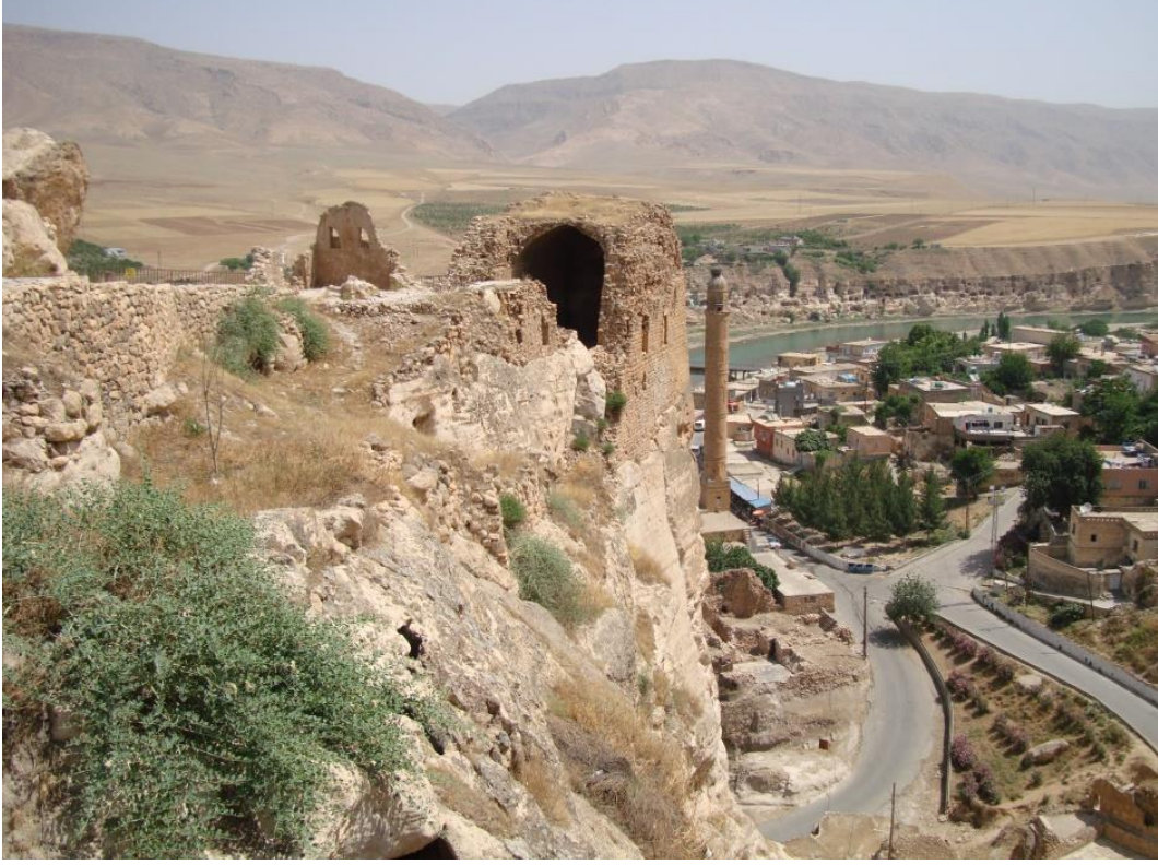
Şekil 2: Hasankeyf.

Güneydoğu Anadolu Bölgesi'nde yer alan Batman'ın bir ilçesi olan Hasankeyf, il merkezine 37 km uzaklıktadır (Şekil 2). Bu antik yerleşim, Dicle Nehri'nin iki yakasında kurulmuştur (Demir, 2022: 98). Raman Dağı'nın güney eteklerinde yer alan Hasankeyf, kısmen karasal iklime sahiptir (Uluçam, 2021: 30). Erken dönemlerde yerleşime ulaşım, Dicle Nehri'nden sağlandığı için Diyarbakır ve Cizre arasında denmekteydi (Zengin, 2001: 19). Yerleşim, ticari güzergâhlarda yer alan Orta Çağ'ın önemli stratejik merkezlerinden biriydi (Kaya, 2009: 383).