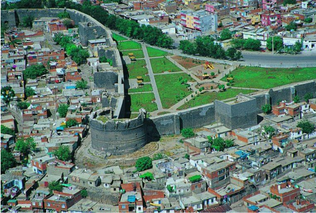
Şekil 1: Diyarbakir Surlarından Bir Görünüm (Akın, H. Diyarbakir Kısa Tarihçesi, 2020, 30 Ocak 2023 tarihinde https://diyarbekirde.com/diyarbakir-kisa-tarihcesi/ adresinden erişildi.)

ve burada çağdaş uygarlığın temelleri atılmıştır (Özkaya, 2021: 49). Bölgenin diğer önemli bir yerleşimi ise Çayönü olup Ergani ilçesinin 7 km kadar güneybatısında yer almaktadır. Çayönü, Neolitik Dönem'den başlayıp Demir Çağ'a kadar giden kesintisiz bir yerleşim yeri olmuştur (Özdemir, 2017: 250-252). Kültür tarihinin önemli bir dönüm noktası olan bu höyük, en erken kazısı yapılan arkeolojik alanlardan olup uzun yıllar kazı çalışmaları devam etmiş ve Neolitik Dönem'e ışık tutan pek çok önemli eser vermiştir (Özdoğan, 2018: 22). Günümüz Sur ilçesinde yer alan Amida Höyük yerleşiminin geçmişi ise Prehistorik Dönemlere kadar gitmektedir (Ökse, 2015: 63). Höyükte yapılan kazı çalışmalarında Artuklu Sarayı kalıntlarına ulaşılmıştır. Sarayın yapıldığı dönem bilinmese de burada elen geçen mozaikler, Roma-Doğu Roma Dönemi özellikleri göstermektedir. Bu da gösteriyor ki bu saray, Roma-Doğu Roma döneminde inşa edilmiş ve daha sonraki dönemlerde kullanılmaya devam etmiştir (Yıldız, 2019: 547). Amida Höyük'te ele geçen bu bulgular Roma İmparatorluğu'nun Amida'yı tahkim ederken yönetim üssü olarak sarayı da buraya kurmuş olduklarını söylemek bu bilgiler ışığında yanlış olmayacaktır. Amida'da yaşamış medeniyetlere bakıldığında; Asurlular (Radner ve Schachner, 2001: 729), Bit-Zamaniler (Duymuş Florioti, 2012: 26), İskitler, Medler, Persler, Makedonyalılar, Seleukoslar, Partlar (Boran ve Aykaç, 2019: 274), Büyük Tigran, Romalılar ve Doğu Romalılarıdır (Baş, 2017: 373) 2 .