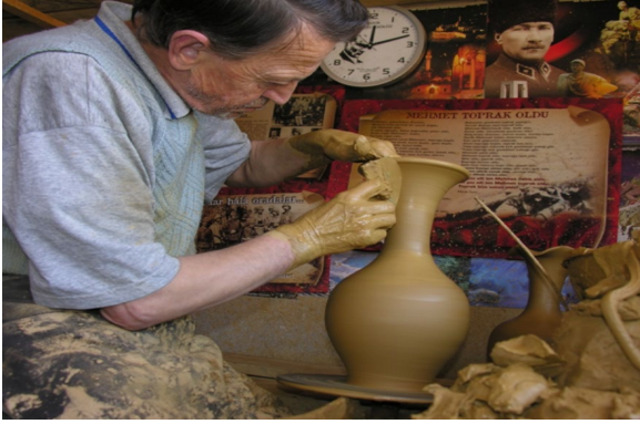
Fotoğraf 9 ve 10: İnhisar'da İpekböcekçiliği ve Kınık Köyü Çömlekçilik El Sanatı.

İpekböcekçiliği, 15. ve 16. yüzyıl belgelerinde Bilecik ve çevre illerinde yapılmaktaydı (Başkaya, 2013). 19. yüzyıl sonlarında Bilecik'te 16 adet harir (ipek) fabrikası vardı. Bilecik koza üretiminde Bursa'dan sonra ikinci sırada gelmekteydi. Daha sonraki süreçlerde, Balkan Savaşları, I. Dünya Savaşı ile Kurtuluş Savaşı'nın gerçekleşmesi ve çeşitli hastalıkların baş göstermesi nedeniyle ipek böcekçiliği kesintiye uğramıştır (Okuyucu, 2020). Günümüzde Söğüt ve İnhisar ilçesine bağlı bazı köylerde ipekböcekçiliği halen sürdürülmektedir. Çömlekçilik ve seramik sanatı, Pazaryeri ilçesine bağlı Kınık Köyü'nde 1800'lü yılların sonunda Bulgaristan'dan gelen muhacirler ile yörede uygulanmaya başlanmıştır. Seramik ustaları, köyün 1 km kadar karşısında bulunan yamaçtaki topraktan elde edilen çömlekçi çamuru ile atölyelerinde bu zanaatı yaklaşık 120 yıldır gerçekleştirmektedir (Göker ve Hergül, 2019; Poyraz ve Göker, 2019).