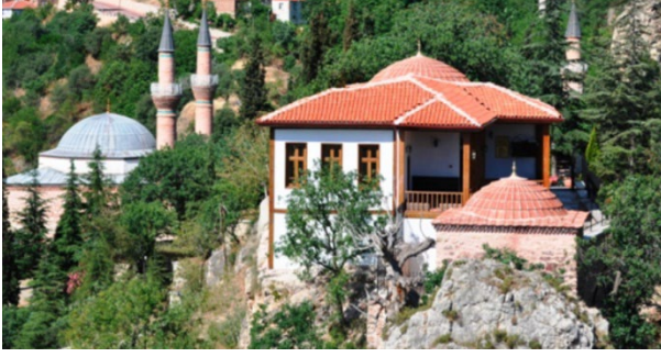
Fotoğraf 5 ve 6: Ertuğrul Gazi ve Şeyh Edebalı Türbeleri.

Son yıllarda Osmanlı Devleti'nin kuruluşunu anlatan dönem dizileriyle, bu türbelere olan ilginin artması söz konusu olmuştur (Okuyucu, 2020). Bu türbelerin dışında, Mihal Gazi'nin, Kumral Abdal'ın, Kamuran Gazi'nin, Savcı Bey'in ve Has Mehmet Bey'in türbeleri ile (Vatan, 2017) Milli Mücadele döneminde önemli görevler üstlenmiş ve şehit olmuş Bilecik Müftüsü Mehmet Nuri Efendi'nin türbesi de Bilecik'te yer almaktadır (Bilgili, 2022). Bilecik şehir merkezinde bulunan Şeyh Edebalı'nın türbesinde kendi neslinden altı büyük ve dört küçük sanduka bulunmaktadır. Türbe ve dergâh, Sultan II. Abdülhamid döneminde ve son olarak 2012 yılında onarım görmüştür. Türbenin hemen yanında Osman Gazi'nin eşi Bala Hatun ile annesinin sandukalarının bulunduğu bir başka türbe daha vardır (Bilecik Valiliği, 2023f). Ertuğrul Gazi'nin mezarı 1281-1285 yıllarında oğlu Osman Gazi tarafından açık mezar olarak yaptırılmıştır. Çelebi Sultan Mehmet döneminde ise üzeri kapatılarak türbe haline getirilmiştir. Daha sonrasında da çeşitli padişahlar tarafından aslına uygun olarak tadilat ettirilmiştir. Bahçe içerisinde Ertuğrul Gazi'nin eşi Halime Hatun ile üç oğlundan biri olan Savcı Bey'in asıl mezarları ile Osman Gazi'nin geçici kabri bulunmaktadır (Vatan, 2015).