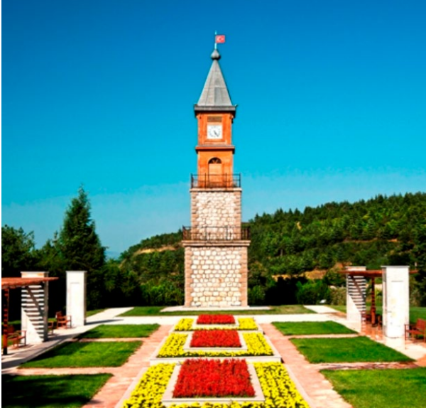
Fotoğraf 7 ve 8: Metristepe Zafer Anıtı ve Saat Kulesi.

Müzeler ve diğer tarihi yapılar: Bilecik ilinde dört müze bulunmaktadır. Bunlar; Bilecik Müzesi, Bilecik Yaşayan Şehir Müzesi, Bozüyük Şehir Müzesi ve Arşivi ile Söğüt Ertuğrul Gazi Müzesi'dir. Bilecik Müzesi'nde il ve çevresine ait arkeolojik ve etnografik eserler bulunmaktadır. Ağırlıklı Roma Dönemi olmak üzere Paleolitik, Neolitik, Tunç, Hellenistik, Roma, Bizans ve Osmanlı Dönemlerine ait eserler sergilenmektedir (Vatan, 2017). Söğüt Ertuğrul Gazi Müzesi'nde ise ağırlıklı olarak Söğüt ve civarındaki köylerden toplanan etnografik eserler yer almaktadır (Vatan, 2015). Büyük Önder Atatürk'ün silah arkadaşı Albay İbrahim Çolak'ın ailesiyle