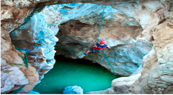
Fotoğraf 3 ve 4: Harmankaya Kanyonunu.

Yaylalar: Kömürsu, Sofular, Çiçekli ve Batan Yaylaları Bozüyük; Kamçı Yaylası ise Pazaryeri ilçesinde bulunmaktadır (Orman ve Su İşleri Bakanlığı, 2016). Kömürsu Yaylası, 90 hektar alana sahiptir ve 1700 metre yükseklikindedir. Bu özellikleriyle kış turizmi açısından elverişlidir. Köknar ağaçları ile kaplı Sofular Yaylası'nın yüksekliği ortalama 1600 metredir ve bölgenin yayla turizmi açısından