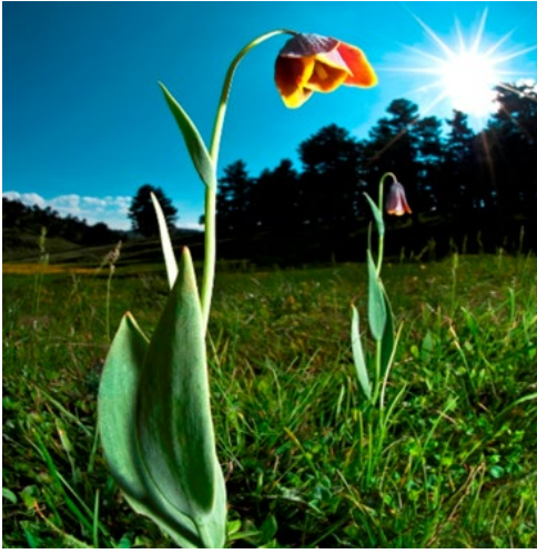
Fotoğraf: 1 ve 2: Pazaryeri Şerbetçi Otu Üreticisi ve Ters Lale.

Fauna: İlin orman açısından zengin olması, av hayvanları açısından da çeşitlenmeyi sağlamıştır. Dağlık, kayalık ve ormanlık alanlarda kurt, tilki, ayı, sansar, çakal, geyik, karaca, tavşan, dağ keçisi, yabandomuzu vb. memeli hayvan türlerinin yanı sıra ispinoz, baştan kara, keklik, bildircin, kırlangıç çulluk, yaban ördeği, üveyik gibi kuş türleri de mevcuttur. Merkez ilçe, Osmaneli ve Söğüt ilçelerinden geçen Sakarya Nehri ve kolları olan Göksu, Göynük Çayı ile küçük derelerde balıkçılık yapılmaktadır. Balık çeşitleri olarak, sazan, alabalık, kızılkanat, yayın, turna, tatlı su kefali ve kum balığı mevcuttur (Çevre ve Şehircilik İl Müdürlüğü, 2019). Yaban hayatı zenginliğinden kaynaklı olarak Bilecik ilinde çok sayıda devlet avlağı da bulunmaktadır (Orman ve Su İşleri Bakanlığı, 2016).