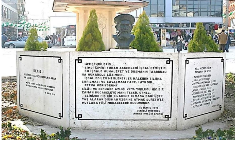
EK2: Ahmet Hulusi Efendi'nin Denizli-Bayramyeri'nde "Cihat Fetvası"nı verdiği alana dikilen kitabe.

Cumhuriyetin Kuruluşu ve Gelişimi Sürecinde Denizli’de Milliyetperver Bir Müftü: Ahmet Hulusi Efendi