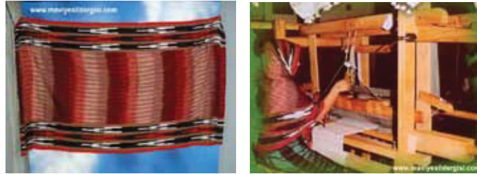
Resim 15: Rize Bezi

Rize bezi, Rize de yaşayan kültürün dış yansımasıdır. Özgün dokuma tezgâhı yöreye has, yörenin kültürünü ince bir üslûpla yansıtır.