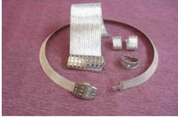
Resim 7: Trabzon Hasırından Takı Seti

Dünyada zırh örücülüğü olarak örnekleri görülen gümüş örücülüğü, ülkemizde "Trabzon işi" olarak bilinmektedir.