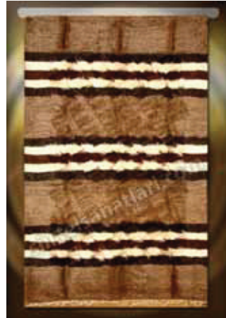
Resim 5: Siirt battaniye örnekleri

http://www.siirtelsanatlari.com/images/product/60_1.jpg [10]