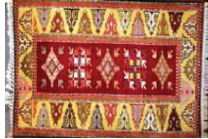
Resim 2: Hereke Halısı

http://milashalilari.com/modules/GesGaleri/index.php?kategorino=6&no=6 [6]