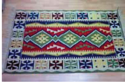
Resim 3: Afyon Bayat Kilimleri

Günümüzde, milli kültürümüzün ayrılmaz bir parçası olan kilimler, kolay taşınabilir ve az zamanda dokunabilmesi nedeniyle yaygın kullanılır.