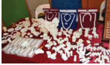
Resim 9: Lüle Taşı Ürünler

Eskişehir'in en önemli simgelerinden olan lüle taşı, ilginç şekillerde pipolar, biblolar, takılar olarak üretilmektedir.