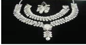
Resim 8: Telkari Gümüş Takı Seti

Özellikle Mardin ve Midyat ilçesinde telkari sanatı oldukça gelişmiştir