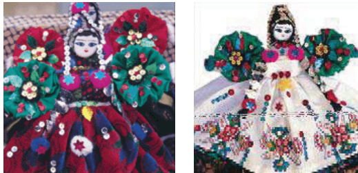
Resim 10: Soğanlı Bebekleri

Kapadokya Bölgesinin giriş kapısı olarak da bilinen Soğanlı, köyün simgesi haline gelen bez bebekleri ile de ünlüdür. Köylü kadınlarca yapılarak bütün Kapadokya da satılan ve Soğanlı Bez Bebekleri adı ile un yapan bu bebekler, koyun en önemli gelir kaynaklarından biridir.