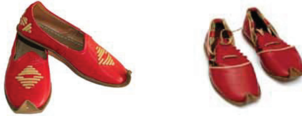
Resim 12: Yemeni modelleri

Yemeni yurdumuzun diğer yörelerinde yazmaya verilen ad olmasına karşılık yörede ayağa giyilen bir çeşit ayakkabıya verilen addır.