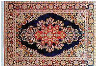
Resim 1: Milas Halısı

Muğla Milas yöresi kendine özgü renk, desen ve oldukça zengin örneklerle sahiptir. Hereke halısı Türkiye'de Kocaeli'ne bağlı bir kıyı şehri olan Hereke'de üretilen halıdır. Ham madde olarak ipek, yün ve pamuk kullanılır.