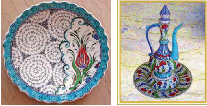
Resim 6: Kütahya Çini Örnekleri

Kütahya'nın simgesi ve onu bütün dünyaya tanıtan "Çinicilik" Kütahya 'da önemli bir sanat olmanın yanında bir geçim koludur.