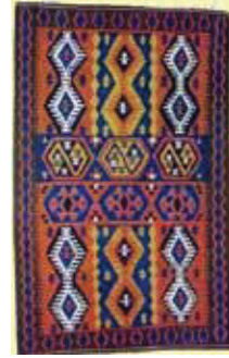
Resim 4: Uşak Eşme Kilimleri

http://www.kenthaber.com/ege/afyonkarahisar/bayat/Haber/Genel/Normal/bayat-kilimleri100-de-100-kok-boyayla-yapiliyor/937860e4-aed2-4e68-bc77-4fbf5452f26c [8]