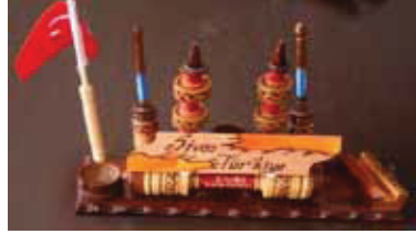
Resim 14: Kalemlik

Çubukculuk köklü el sanatlarından biridir. Sivas'taki ağızlıklar kalem, kalemlikler Kişisel kullanım ya da satış için yapılan çubuklar günümüzde turistik bir değer kazanmıştır.