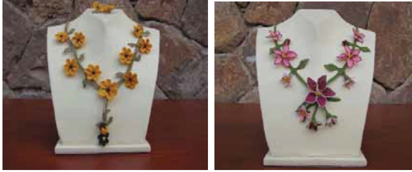
Resim 11: İğne Oyası Takılar

Geleneksel Türk el sanatlarının içinde önemli bir yeri olan oyalar ise yüzyıllardır geleneksel Türk giyim-kuşamının vazgeçilmez bir parçası olmuştur. Günümüzde ise daha çok takı yapımında kullanılmaktadır.