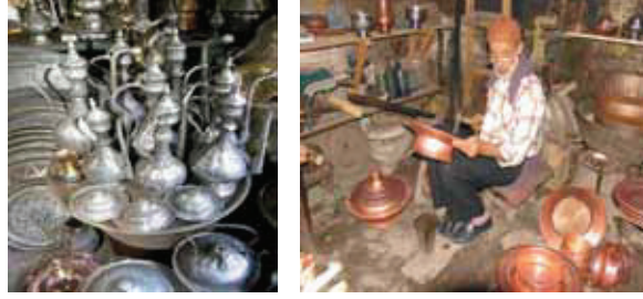
Resim 13: Bakırcılık

http://www.frmartuklu.net/g [19] http://www.sanliurfa.bel.tr/Sanliurfa_Taniyalim/detay.aspx?SectionID=sBBHiUoOnHeqNq4ACYN7UA%3D%3D&ContentID=PYoNapf6S%2FE8Lu%2FvXwenLg%3D%3D [20]