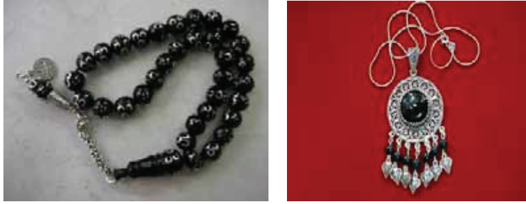
Resim 16 : Oltu taşı örnekleri

Erzurum'a özgü Oltu taşı Oltu ilçesinden güç koşullar altında çıkarılmakta olup bu taş ile tespih anahtarlık gerdanlık broş küpe saç tokası tarak ağızlık yüzük bilezik sigaralık ve çeşitli süs eşyaları yapılmaktadır.