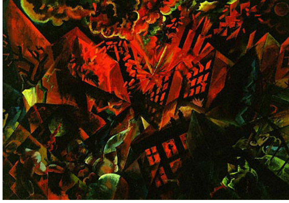
Resim 15. George Grosz, Patlama, 1917, Pano üzerine yağlıboya, 47.8x68.2 cm., Modern Sanatlar Müzesi, New York.

George Grosz da tıpkı Otto Dix gibi savaş sonrası çirkinlikleri, Alman toplumunun ve insanların çirkinliğine karşı duyduğu tiksintiyi resimleriyle anlatmıştır. I.Dünya Savaşı'nda piyade olarak görev yapan Grosz, hümanist bir ortamda büyüdüğünden savaşa hiç sıcak bakmadığını, savaşın onun için anlamsız fakat korkutan, yaralayan ve duyguları tahrip eden bir şey olduğunu ifade etmiştir. Sanatçı, bilge insanların da kendisiyle aynı duygulara sahip olduğunu düşünmektedir. 45