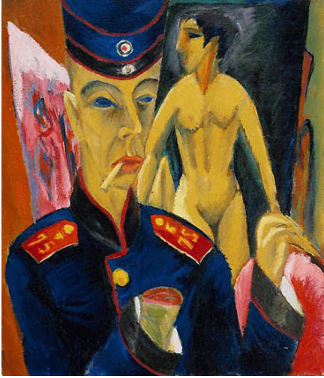
Resim 2. Ernst Ludwig Kirchner, Asker Olarak Otoportre, 1915, Tuval üzerine yağlıboya (T.Ü.Y.B), 69.2x61 cm., Allen Memorial Sanat Müzesi, Oberlin College, Ohio.

3. Kübizm: 1907 ve 1914 yılları arasında etkililiğini sürdüren bu akım Fransa'da Pablo Picasso ve Georges Braque öncülüğünde ortaya çıkmıştır. Akımın temelleri, iki göze sahip olduğumuz için bir nesnenin iki açıdan görülebildiğini düşünen Empresyonist ressam Paul Cezanne tarafından atılmıştır. Cezanne'ın bu düşünce doğrultusunda vermiş olduğu eserlerin, Picasso ve Braque'yi etkilediği bilinmektedir. Kübist eserlerde figürler ve objeler parçalara ayrılmış, parçalar genellikle köşeli geometrik biçimlerle birden fazla bakış açısıyla ifade edilmiş, ışık-gölge ve dolayısıyla hacim olgusu resimden çıkarılmış, resme yeni malzemeler eklenerek kolaj tekniği uygulanmıştır. Kimi zaman resimden atılan renk, kimi zaman resme yeniden dâhil edilmiş ve parçalara ayrılan biçimler yepyeni bir düzen kurulmak üzere yeniden bir araya getirilmiştir. Alman ordularının Guernica kasabasını bombalaması üzerine 1937'de "Guernica" adlı eserini yaparak savaşa karşı duyarsız kalamayan, nefretini dile getiren İspanyol ressam Picasso, aynı duyarlılığı I.Dünya Savaşı'nda da göstermiştir.