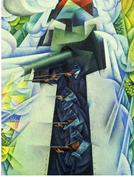
Resim 5. Gino Severini, Harekâttaki Zırhlı Tren, 1915, T.Ü.Y.B., 115.8x88.5 cm., Modern Sanatlar Müzesi, New York.

Bu dönem sanatçılarından Boccioni'nin "Mızraklı Süvarilerin Taarruzu" (Resim 4) isimli eseri 1915 yılında yapılmış olup, eser savaşta Avusturya-Macaristan İmparatorluğu ve Rus askerleri arasındaki karşılaşmayı konu almaktadır.