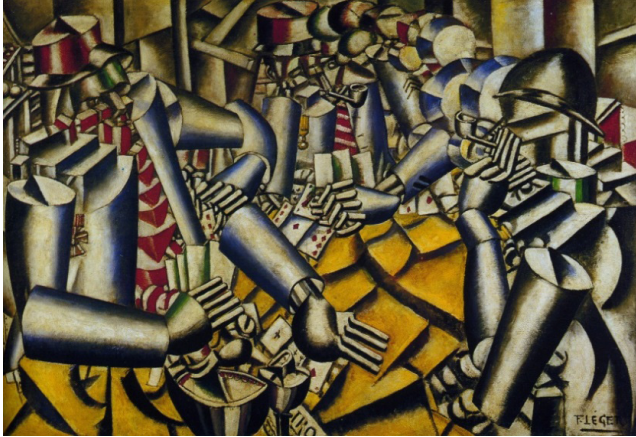
Resim 6. Fernand Léger, Kâğıt Oyuncuları, 1917, T.Ü.Y.B., 129x193 cm., Kröller-Müller Müzesi, Otterlo.

I.Dünya Savaşı'nda cepheye giden Léger, gazdan zehirlenmiş ve yaşadığı olaylar onun sanat görüşünü, üslubunu değiştirmiştir. Sanatçı cephedeki süreçte, aynı üniforma ve aynı amaç doğrultusunda bir araya gelmiş insanlar ve diğer askerlerle yakın ilişkiler kurarak yaşamıştır. Toplar, bombalar, uçaklar ve kamyonlar arasında bir dönem geçiren sanatçı, 1917'den sonra biçim ve toplum konusunda farklı bir anlayışa sahip olmuştur. Hastanede ve cephede geçirdiği süre içinde yaşadıklarını 1917'de yaptığı "Kâğıt Oyuncuları" (Resim 6) isimli eserinde ortaya koymuştur. Bu eser onun 1911'den sonra yaptığı en büyük tablosudur. 21