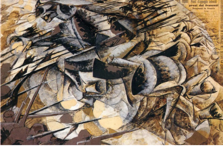
Resim 4. Umberto Boccioni, Mızraklı Süvarilerin Taarruzu, 1915, Kağıt üzerine suluboya ve kolaj, 32x50 cm., Jucker, Milano.

Fütürizm sonraki yıllarda Rusya'da da taraftar bulmuştur. Ancak Rus Fütüristler savaş karşıtı bir tavır sergileyerek tüm otoritelere, toplumsal, etik, estetik görüşlere karşı durduklarını belirtmişlerdir. Rus Fütüristler 1912 yılında "Toplumsal Zevke Tokat" isimli bir manifesto yayımlamış ve bu manifesto ile gelecekteki edebiyatı reddettiklerini bildirmişlerdir. 19 Bu akımdan 1922-1928 yılları arasında Rusya'da yaşayan ünlü Türk şair Nazım Hikmet'in de etkilendiği ve "Makineleşmek İstiyorum" isimli bir şiir yazdığı da bilinmektedir.