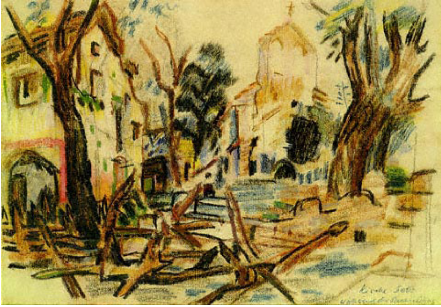
Resim 1. Oskar Kokoschka, Isonzo'nun Önü, 1916, Kağıt üzerine pastel, 30.5x43 cm., Jenisch Müzesi, Vevey.

cephesinde ağır yaralanmıştır. 6 Rus Cephesinde bir süngü yarası, Galiçya cephesinde ise bir kurşun yarası almıştır. Ressam, 1916'da İtalya'nın Isonzo önünde savaş ressamı olarak görev almıştır. Isonzo Cephesi İtalya ve Avusturya-Macaristan kuvvetlerinin çarpıştığı, zorlu arazi koşullarına sahip bir cephe dir. Mücadelenin devam ettiği bölge, nüfusun büyük çoğunluğunun İtalyanca konuştuğu dağlık Trentino bölgesindedir. 1915 yılında İtalyanların işgal ettiği bölgeye taarruz başlatan Avusturya-Macaristan kuvvetlerinin amacı bölgedeki işgalciler ile diğer İtalyan kuvvetlerinin bağlantısını kesmektir. 1915-1917 yılları arasında devam eden Isonzo muharebeleri sonunda yüz elli binden fazla İtalyan ve Avusturya-Macaristan askeri hayatını kaybetmiş, savaş yapılan bölge oldukça tahrip olmuştur. 7 Kanlı mücadelenin gerçekleştiği dönemde savaş ressamı olarak görev yapan Kokoschka savaş anını canlandırdığı eserinde (Resim 1) o bölgede yaşananları anlatmaya çalışmıştır. Sanatçının "Isonzo'nun Önü" isimli eserinde siperlerin yıkılmış, yerleşim biriminin bombalanarak tahrip edilmiş olduğu görülmektedir. Arka planda bombardımanda zarar görmüş kilise göze çarpmaktadır. Kokoschka'nın yaşanan ürpertici olayı yerde yatan yıkılmış siperlerdeki, kırılmış ve yanmış ağaç dallarındaki çizgilere anlam yükleyerek ifade ettiği söylenebilir.