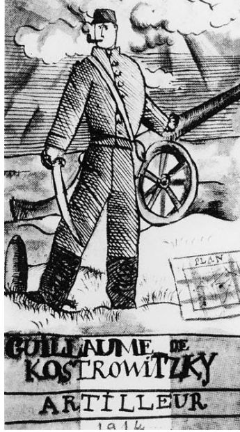
Resim 3. Pablo Picasso, Topçu William Kostrowitzky, 1914, Kâğıt üzerine mürekkep ve suluboya, 23x12.5 cm.

Bu eserinde (Resim 3) Picasso, 1914 yılında orduya yazılan; Polonyalı ismi ve karışık köklerine karşın kendini tam bir Fransız hisseden Kostrowitzky 10 ’yi resmetmiştir. Kostrowitzky’nin arkadaşı olan Picasso’nun bu eseri, Napolyon’un zaferlerini tasvir eden popüler çizimlerin bir öykünmesidir. Resimde tabanca ve harita gibi askerlikle ilgili semboller mevcuttur. Ancak bu çizimin amatörce yapılmış izlenimi vermesi, sanatçının arkadaşına karşı hürmetten uzak oluşuna işaret etmektedir. Bunun sebebi de askerlik karşıtı düşüncelere sahip olan Picasso’nun bu eserinde arkadaşının güçlü vatanseverliği ve heyecanına karşılık, kendisinin bu tarz konularla işi olmadığını belirtmeye çalışmasıdır. 11