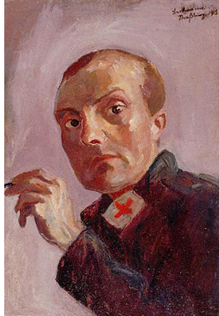
Resim 14. Max Beckmann, Sağlıkçı (Hemşire) Olarak Otoportre, 1915, T.Ü.Y.B., 55.5x38.5 cm., Von der Heyt Müzesi, Wuppertal.

Akımın diğer temsilcisi Max Beckmann da Eylül 1914'te birkaç ay Doğu Prusya'da sağlıkçı (hemşire) olarak görev yapmıştır. Eşiyle doktorların kendisine korkunç yaralar gösterdiğini, her yerin aydınlık ve pencerelerin açık olmasına rağmen etrafta çürüyen etlerin ekşi kokular yaydığını ve bir saatliğine alanın dışına çıkmasına rağmen bunu yarım saat daha uzatmak zorunda kaldığını ifade etmiştir. 44 Resim 14'te, sanatçının kendini sağlıkçı olarak resmettiği eseri görülmektedir.