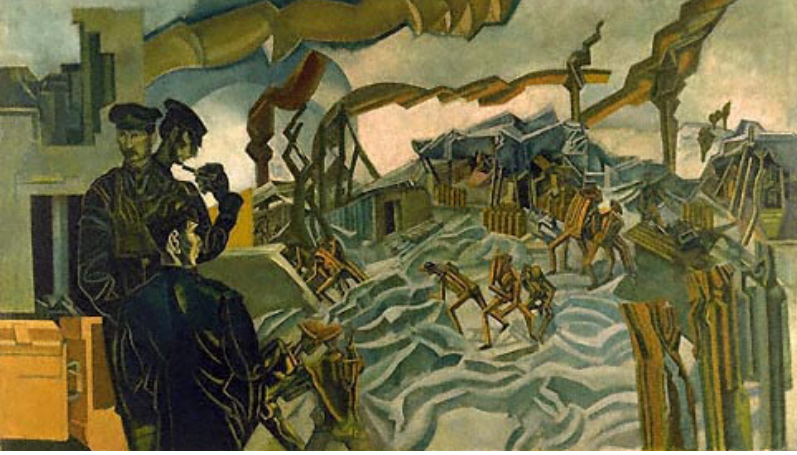
Resim 8. Percy Wyndham Lewis, Silah Deposu Bombalandı, 1919, T.Ü.Y.B., 182.8x317.8 cm., İmparatorluk Savaş Müzesi, Londra.

Akımın öncüsü Lewis'in 1918'de yaptığı "Kanada Silahı-Çukuru" (Resim 7) ve 1919'da yaptığı "Silah Deposu Bombalandı" (Resim 8) isimli eserleri farklı tarzlarda yapılmış olmasına rağmen aynı hikâyeye ait iki anı yansıtmaktadır.