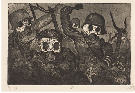
Resim 13. OttoDix, Gaz Saldırısı Altında İlerleyen Fırtına Birlikleri, “Savaş”tan, Plaka 12, 58/70, 1924, 19.6x21.9 cm., Alman Tarihi Müzesi, Berlin.

Dix, 1924 yılında seri halinde “Savaş” temalı elli adet gravür yapmıştır. “Gaz Saldırısı Altında İlerleyen Fırtına Birlikleri” (Resim 13) isimli eser, serinin ardından savaşla ilgili travmatik çalışmalar yapmaya devam eden Dix'in seriyeye ait çalışmalarından biridir.