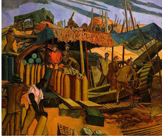
Resim 7. Percy Wyndham Lewis, Kanada Silahı-Çukuru, 1918, T.Ü.Y.B., 305x362 cm., Kanada Ulusal Galerisi, Ottava.

7. Vortisizm: İngiltere’de ortaya çıkmış olan bu sanat hareketi, İngilizce “Vortex”, yani girdap sözcüğünden doğmuştur. 1914’te ismi şair Ezra Pound tarafından konulan, Wyndham Lewis öncülüğünde gelişen bu akım kısa ömürlü bir İngiliz sanat hareketi olmuştur. 26 Dönem çalışmalarında Kübist ve Fütürist akımların etkisi görülmektedir. Eserlerde kullanılan formların geometrik özellikleri ön plana çıkarılırken, Kübizm’den farklı olarak da nesnelere renk ve ışık geldiği söylenebilir. Lewis’in yanı sıra H.G Brzeska da dönem sanatçıları arasındadır.