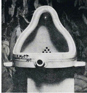
Resim 10. Marcel Duchamp, Fountain (Çeşme/Pisuar), Hazır Yapım, 1917, 62.5 cm, Fiedelfiya Sanat Müzesi. Fotoğraf: Alfred Stieglitz. The Blind Man (Mart 1917, sayı 2) dergisinde yayımlandığı haliyle.

Duchamp'ın hazır nesnelere sanat objesi olarak seçmesinin nedenlerinden biri de sanatçının görsel sanatın “zanaat” çağrışımı yapmasına duyduğu antipati ve buna karşılık da sanat eserinin el becerisine değil düşünceyle yapılmasına dair inancı olmuştur. Sanatçı “Fountain (Çeşme/Pisuar)” (Resim 10) 36 isimli ünlü eserini de bu bakış açılarından hareketle üretmiştir.