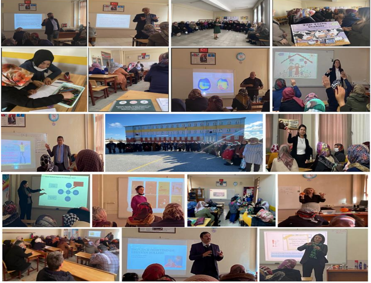
Őekil 1. Uygulama Srecinden Grseller

Tablo 1’de grlen eđitim programı alanında uzman altı Profesr, drt Doent, iki Doktor đretim yesi ve bir Arařtırma Grevlisi akademisyen tarafından 11 hafta boyunca okul ynetiminin belirlediđi saatlerde ve gnlerde, okul seminer sınıfında yrtlmřtr. Uygulama srecine iliřkin grseller Őekil 1’de sunulmuřtur.