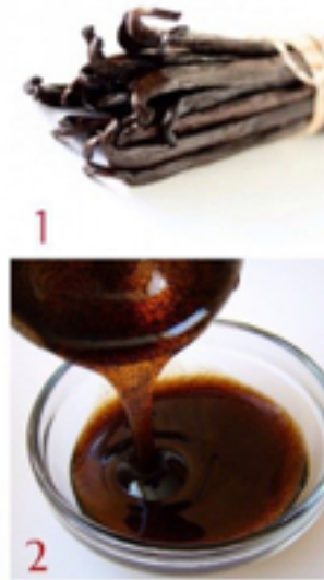
Őekil 1. Vanilya ubukları (1) ve vanilya ekstraktı (2) (Baquero-Peña ve Guerrero-Beltrán, 2017)

ubuklar “güneşlenme” ile avlularda bekletilmektedir. ubuklar yaklaşık iki ay boyunca “terleme” ve güneşlenme” dnglerinden gemektedirler ve bu dnglerde gndzleri gneşeye maruz kalırlar ve geceleri ısıyı korumak iin ahşap kutulara yerleřtirilmektedirler. Bu ařamada, enzimatik ve kimyasal reaksiyonlardan elde edilen vanilya kokusunun nemli bir kısmı retilmekte, ubuklar przsz bir dokuya sahip olmakta, vanilyanın karakteristik kokusu ve kahverengi renk kazanmasında etkili olmaktadır (Baquero-Peña ve Guerrero-Beltrán, 2017). Soldurma, tatlandırma, terleme, gneşlendirme ve kurutma iřlemleri sonrasında olgunlařtırılan vanilyanın krleme sreci tamamlanmaktadır. Vanilyanın sahip olduėu tipik aromasının, \beta -glukozidazların etkisi ile krleme sresince geliřen enzimatik reaksiyonlarla oluřtuėu bilinmektedir (Havkin-Frenkel ve Dorn, 2004; Nascimento ve ark. 2019) Vanilya ubuklarının ve vanilya ekstraktının grnts Őekil 1’de verilmiřtir.