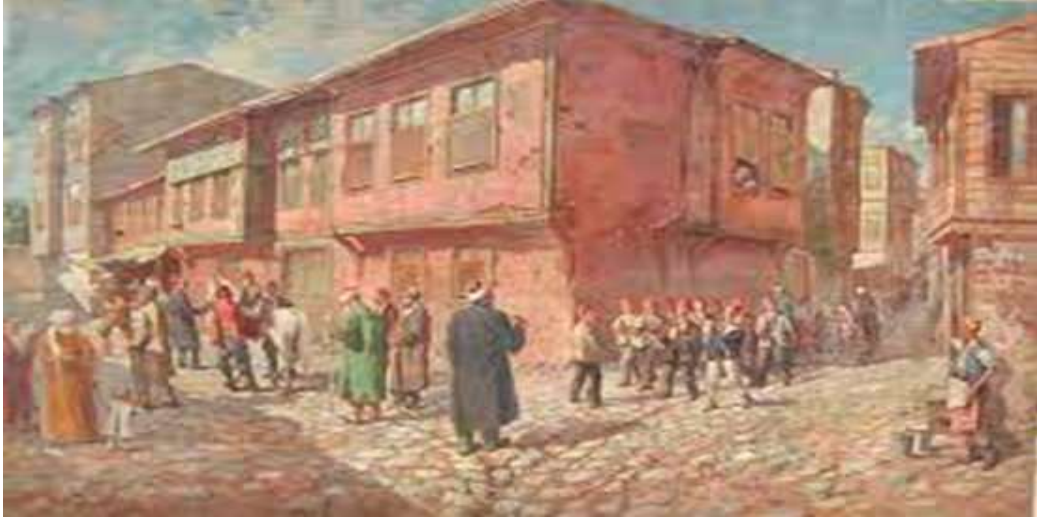
Resim 2. Hüseyin Rıfat Çeteci'nin âmin alayı resmi ( https://dergipark.org.tr/download/article-file/92881 )

Resmi incelediğimizde mektep hocasının görselin merkezine yerleştirildiği görülmüştür. Ata bindirilen çocuk, mektebe gidecek olan ve eğitim hayatına başlayan çocuk olarak tasvir edilmiştir. Çocuğun ardında ise mektebin öğrencilerinden oluşan bir kalabalık yani alay resmedilmiştir. Çocuklardan oluşan bu kalabalığın önünde ilâhicibaşı olarak görevlendirilmiş olan bir çocuk profili ile karşılaşmıştır. İlâhicibaşı olarak tasavvur edilen çocuğun ardında ise âminciler grubu yer almıştır. Resmin solunda âmin alayının geçişini seyreden kadınlara yer verilirken, sağda ise alayı seyre gelen bir esnafı görmek mümkündür (Üstünipek & Üstünipek, 2014).