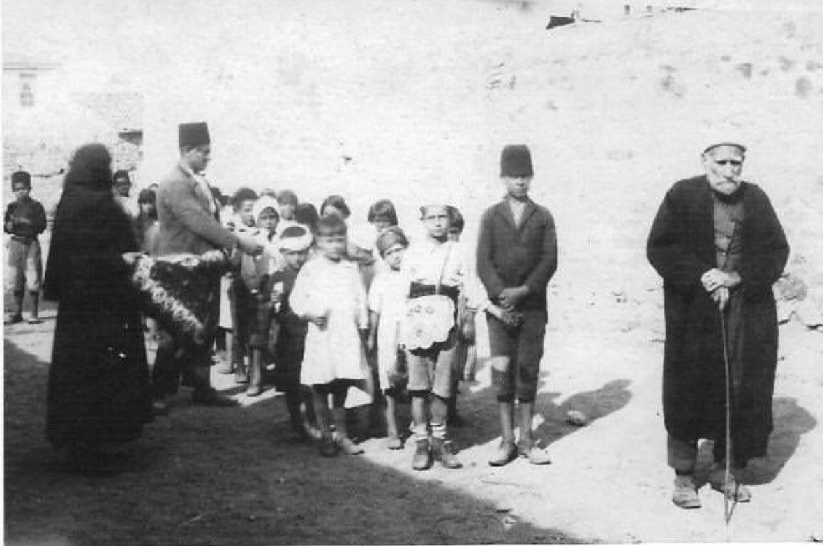
Resim 1. Osmanlı Devleti'nde mektebe başlama ritüeli: Âmin alayı

https://tr.pinterest.com/pin/balkanlarda-amin-alay-ya-da-elifba-alaydenilen-ocuklarn-okula-balama-treni--318629742377464046/