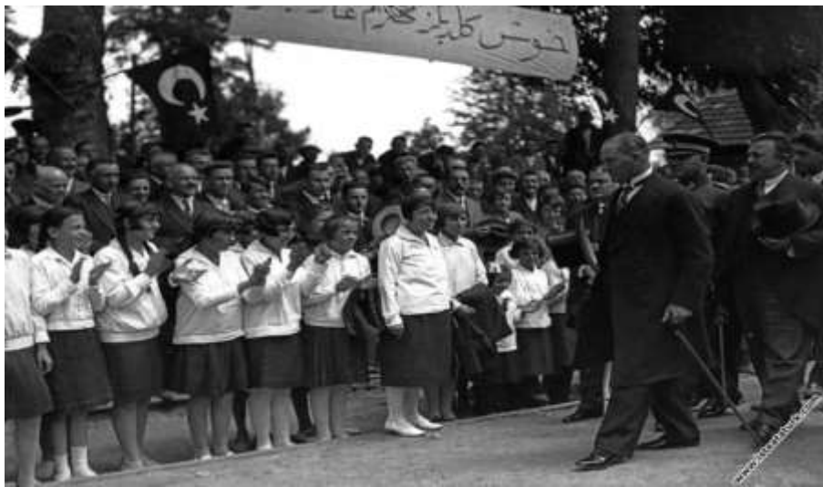
Resim 3. Mustafa Kemal Atatürk’ün İzmit’te bir ilkokulu ziyareti