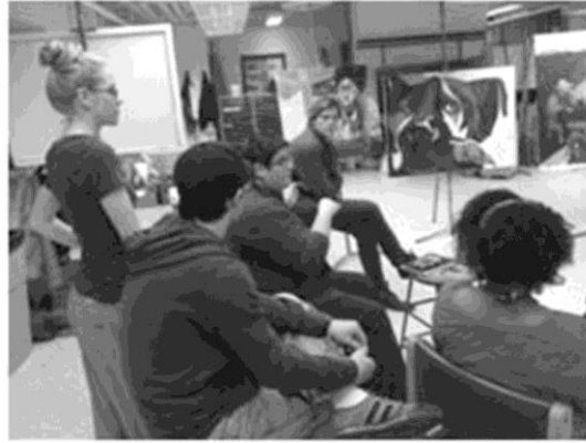
Şekil 3: Advanced Painting dersi atölye kritikleri - Piehl ve öğrencileri projeleri eleştirirken.

Ev ödevleri ve ders projelerine not verildikten sonra ve çalışmalar geri verildiklerinde, öğrenciler yeni not için iki haftaya sahiptirler. Notlar bu yeniden düzeltme yüzünden asla düşürülmez; ancak not sabit kalabilir. Resim atölye derslerinde renk quizleri, günlük değerlendirmeler ve ev ödevleri %15, projeler&sunumlar %75 (Tuval resimleri notların büyük bir kısmı sayılmaktadır. Ara sınav için öğretim elemanı ile öğrencinin görüşmesi ve gelişimi hakkında bilgi edinmesi ve geçici bir not alması beklenir. Eğer isterse öğrenci, resmini yeniden çalışabilir ya da gerekli düzeltmeleri yaparak iki haftalık bir sürede teslim edebilmektedir), derse katılım, ders dışı saatler ve kritikler %10 değerlendirme kapsamındadır.