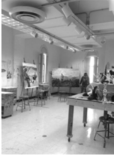
Şekil 1: Oil Painting Studio-RM 202(202 No'lu atölye)(Fotoğraf:C.Arzu Aytekin,2013)

yazma ve özgeçmiş hazırlama gibi becerileri edinebilmektedirler. Ön koşul dersleri (2D ve 3D Foundations, Drawing I, ) olarak ya da atölye derslerini yürüten öğretim elemanının onayı ile ART 2223 Yağlıboya Resim Atölye Dersini alabilmektedirler.